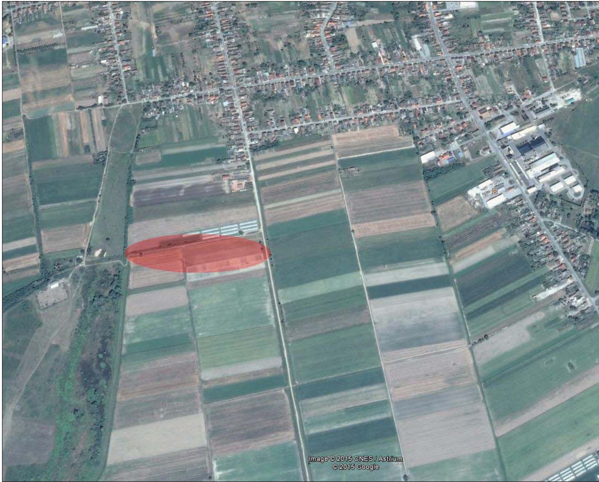
Sl. 1 Položaj lokaliteta AN 2 Donji Miholjac – Vrancari (modificirano prema Google Maps).

Fig. 1 Position of AN 2 Donji Miholjac - Vrancari site (modified according to Google Maps).