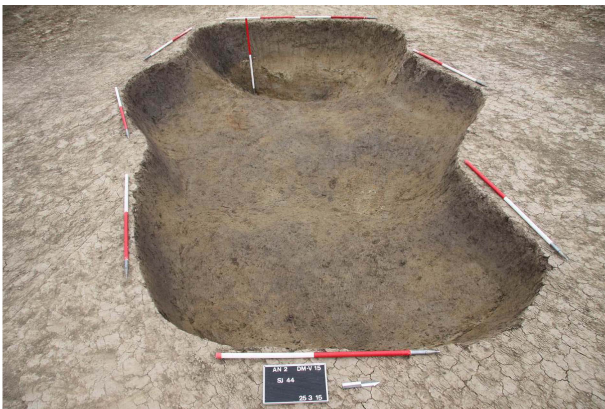
Sl. 4 Pogled s istoka na jamu SJ 44.

Fig. 3 View from the southeast at the object enclosed by canals SU 84 on the right (east) side and SU 94 on the left (west) side.