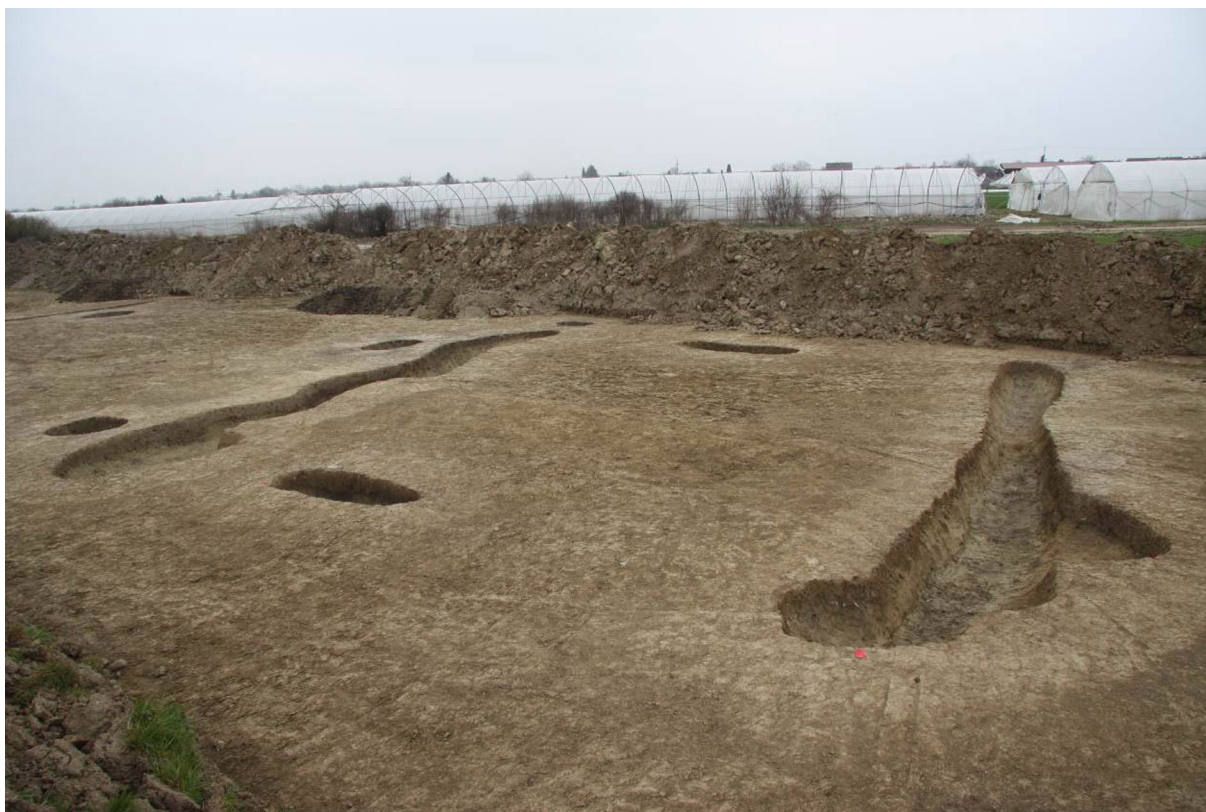
Sl. 3 Pogled s jugoistoka na objekt kojeg zatvaraju kanali SJ 84 s desne (istočne) i SJ 94 s lijeve (zapadne) strane.

Fig. 3 View from the southeast at the object enclosed by canals SU 84 on the right (east) side and SU 94 on the left (west) side.