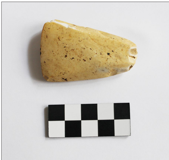
Sl. 5 Polirana kamena sjekira iz radnog prostora SJ 20.