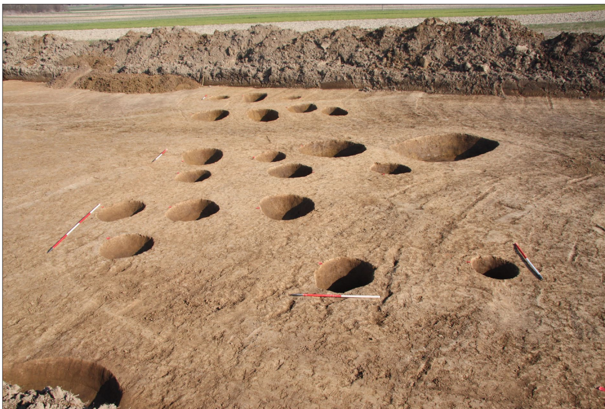
Sl. 3 Ostaci rupa za stupove nadzemne kuće badenske kulture, pogled s juga.