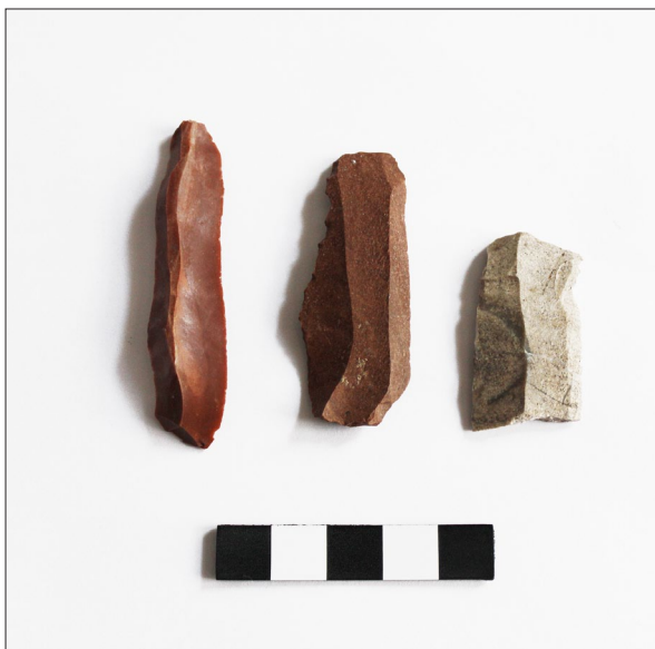
Sl. 2 Odbojci i sječiva iz jame SJ 180.

Fig. 1 Explored Sopot culture pit SU 180.