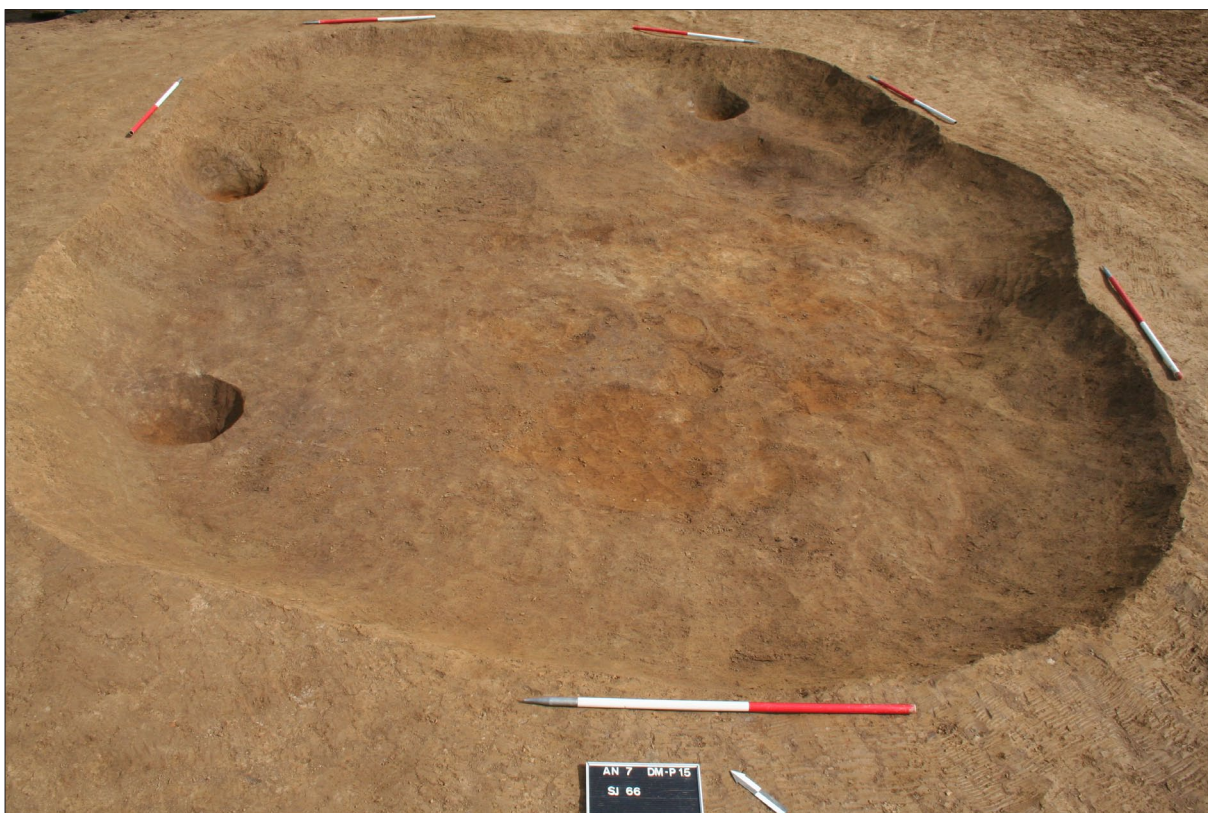
Sl. 4 Istraženi poluukopani radni prostor SJ 66.