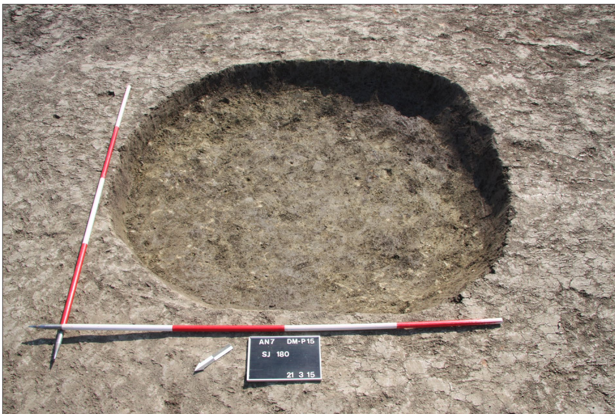
Sl. 1 Istražena jama sopotske kulture SJ 180.

Fig. 1 Explored Sopot culture pit SU 180.