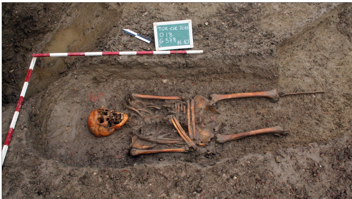
Sl. 2 Grob neuobičajene orijentacije – G 378 (snimila: K. Turkalj).