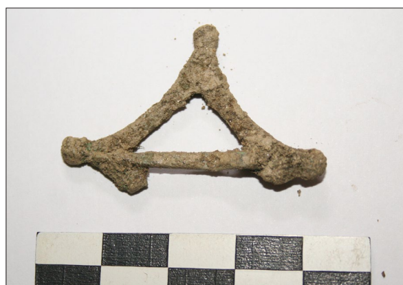
Sl. 6 Dio romboidnog broša iz groba 365.

Fig. 5 Ring from Grave 320.