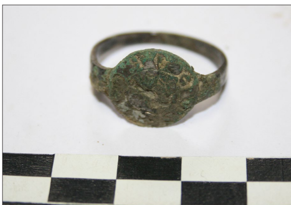
Sl. 5 Prsten iz groba 320.

Fig. 4 Joint burial of an adult and child G317 and G 321.