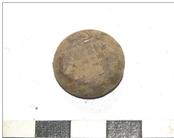
Sl. 3 Gumb iz zapune G 351.

Osim grobova u sondi je pronađen i ukop SJ 863 za sada nepoznate namjene. Ukop je presjekao pojedine grobove i unutar njega su ustanovljeni tragovi više zapuna i moguće drvene oplatae.