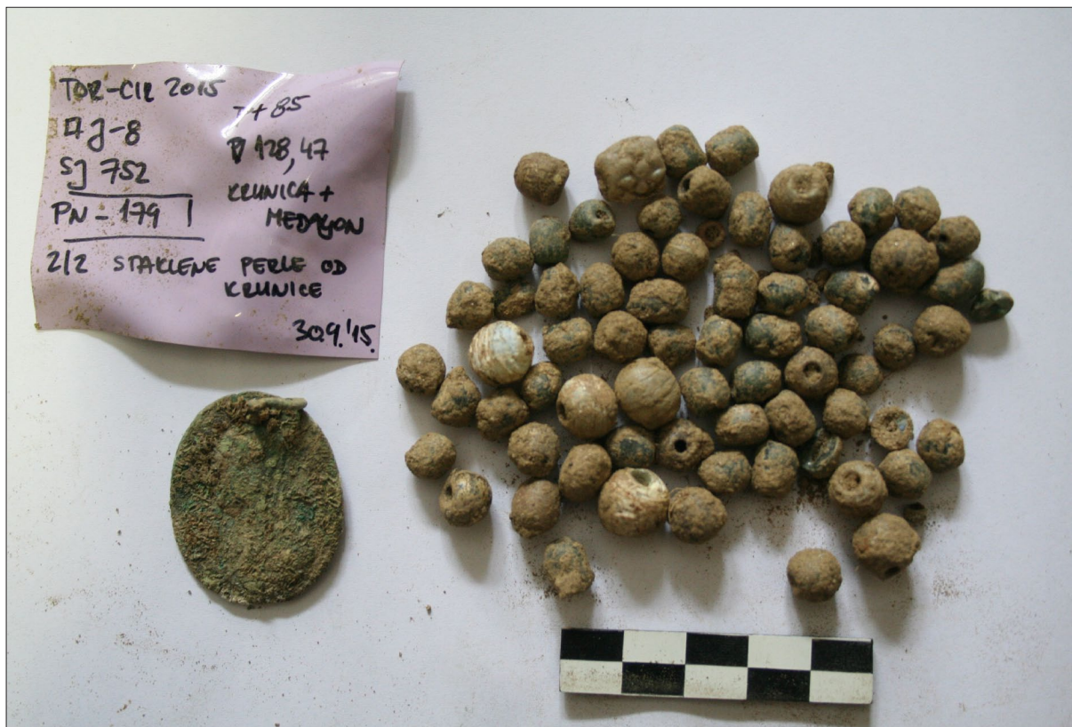
Sl. 7 Krunica iz groba 310.