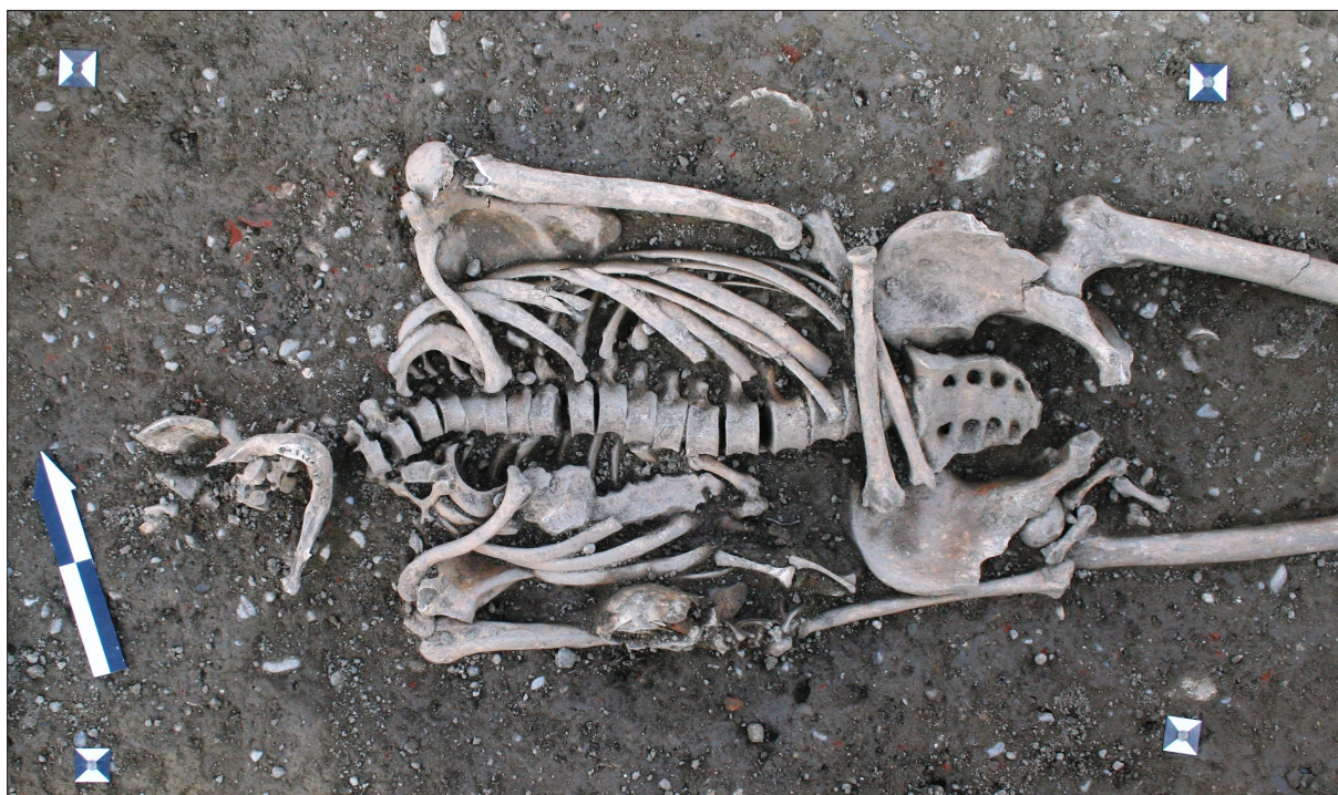
Sl. 4 Istovremeni ukop odrasle osobe i djeteta - G317 i G 321.

Fig. 3 A button from backfill G 351.