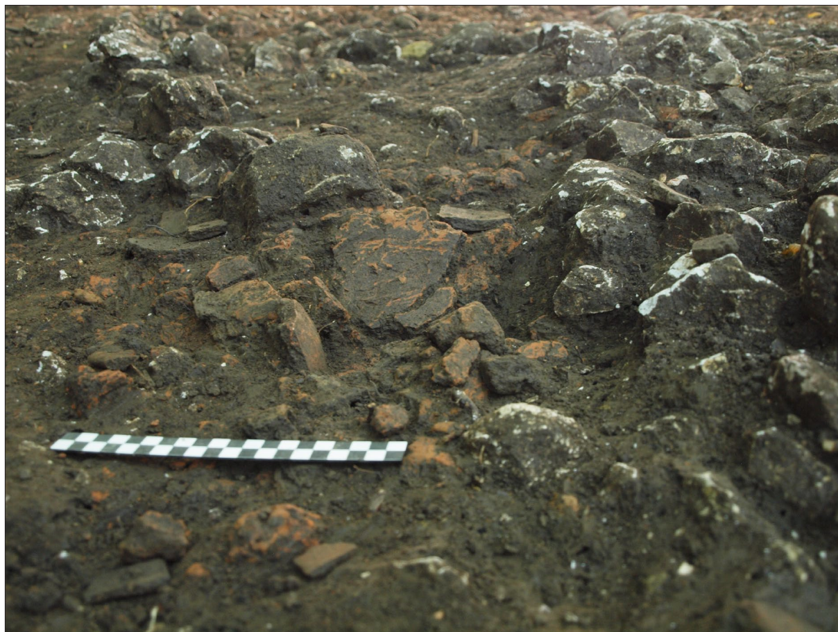
Sl. 2 Kalnik – Igrišće – ostaci urušnja konstrukcije peći (SJ) 321.

Najznačajniji nalaz izrađen od bronce jest strelica pronađena u blizini urušnja od peći (sl. 3). Takve strelice su rijedak