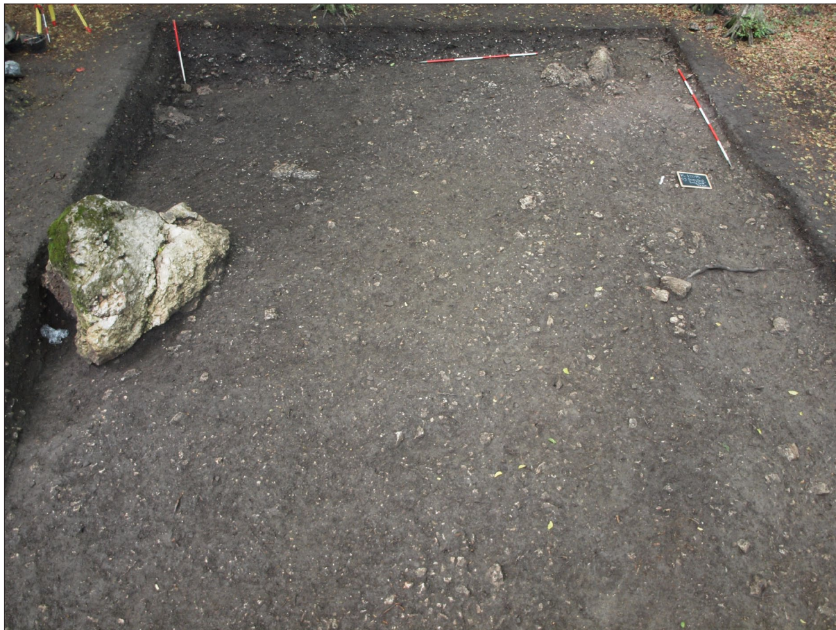
Sl. 1 Kalnik – Igrišće – slojevi s keramikom latenskih karakteristika.

Objekt s keramikom latenskih obilježja plitko je ukopan u sloj (SJ) 307. Riječ je o sloju koji je na sjevernom i istočnom dijelu sonde najtanji, dok se prema zapadom i južnom dijelu zadebljava. Sloj je sastavljen od kompaktnog, glinovito-prahovitog tla koje sadrži sitne ulomke prapovijesne keramike i lijepa te sitnog kamena. Sloj je oštećen mlađim ukopima iz latenskog razdoblja (SJ 301, 306) što je ranije u tekstu već spomenuto. Ispod sloja (SJ) 307, vrlo vjerojatno erozivnog postanka, otkriveni su intaktni slojevi iz kasnog brončanog doba. Nakon njegovog uklanjanja zaravnjenje padine, koje se moglo pratiti u sjeverozapadnom dijelu sonde od razine srednjovjekovne podnice, nije više toliko naglašeno. Skidanjem sloja 307 jasnije je vidljiv nagib terena od sjevernog ka južnom dijelu sonde, točnije od sjeveroistoka prema jugozapadu. Ostaci slojeva i struktura otkrivenih ispod sloja (SJ) 307 predstavljaju intaktni stratigrafski kontekst iz kasnog brončanog doba, koji se vrlo vjerojatno može povezati s ostacima kasnobrončanodobnog objekta istraženog u razdoblju