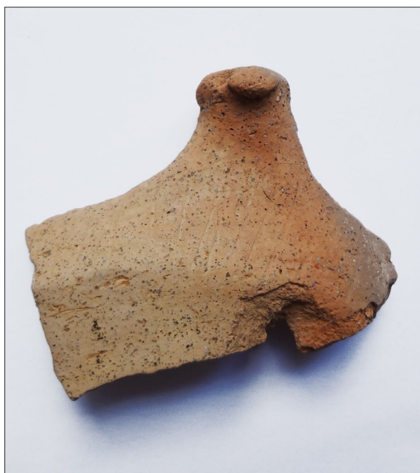
Sl. 3 Ulomak posude sa zoomorfnim plastičnim ukrasom.