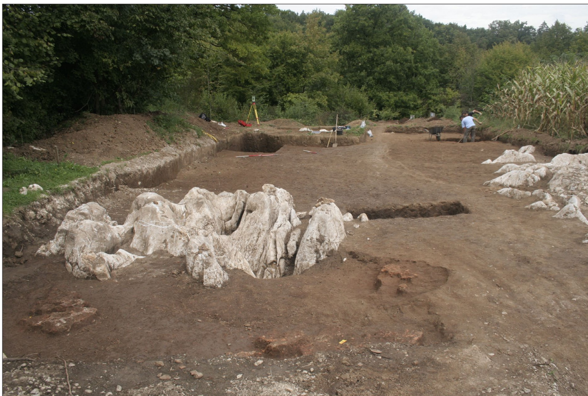
Sl. 1 Pogled s juga na sondiranu površinu tijekom istraživanja.

Fig. 1 View from the south of the area with trial trenches during excavation.