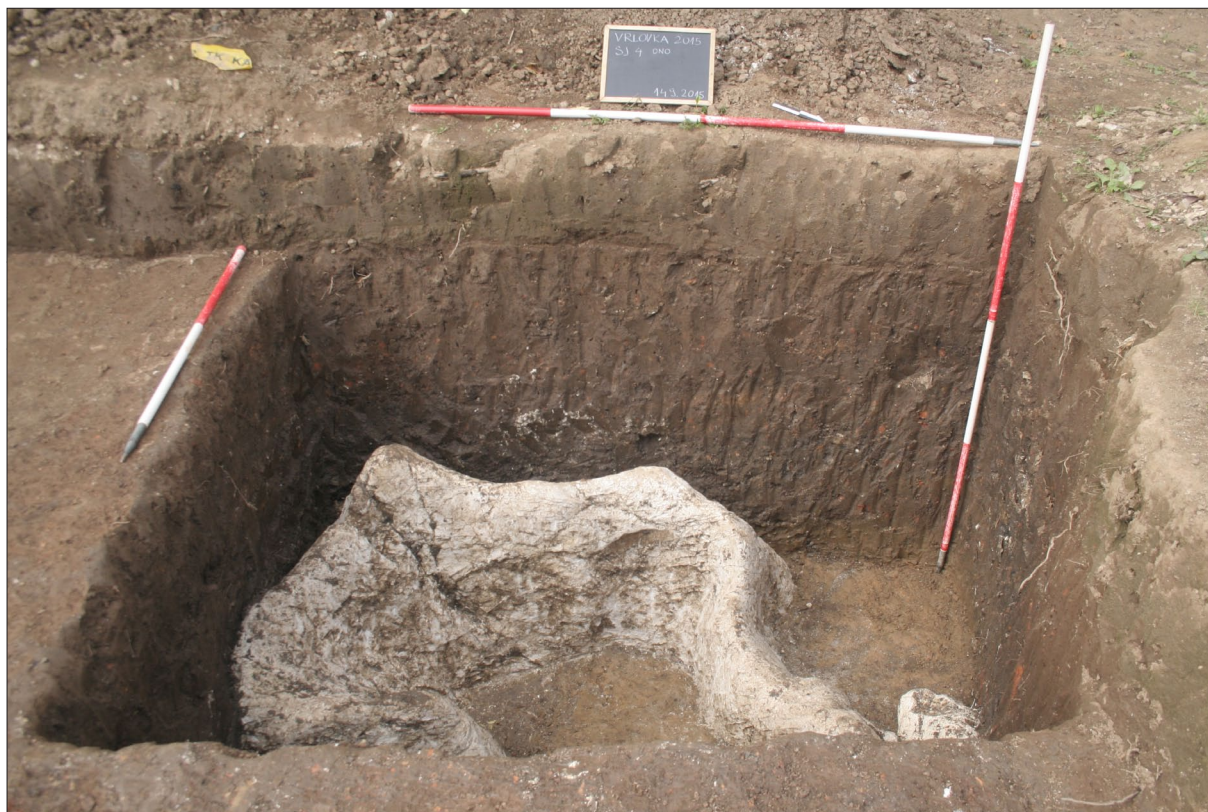
Sl. 2 Sjeverozapadna sonda, zapadni profil.