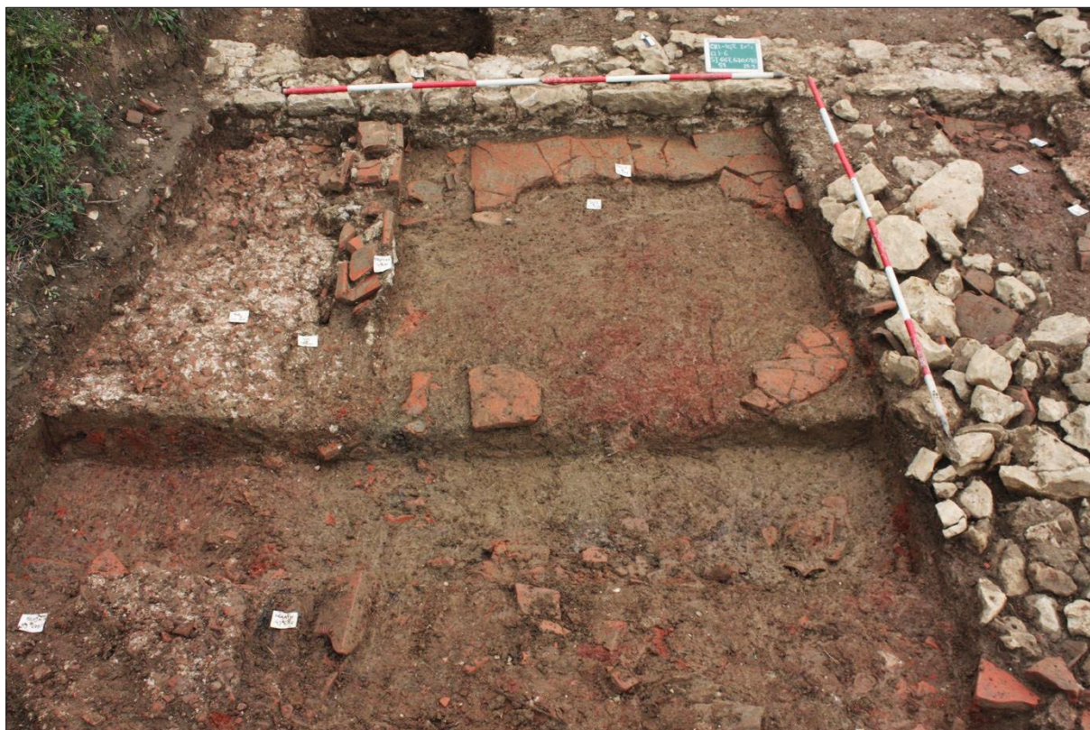
Sl. 4 Crikvenica-Igralište, 2015., dvije različite strukture podnice (hidraulična, SJ 554 i SJ 667 i podnica s opekama SJ 698 i SJ 662) unutar dviju prostorija odvojenih pregradnim zidom, SJ 670.