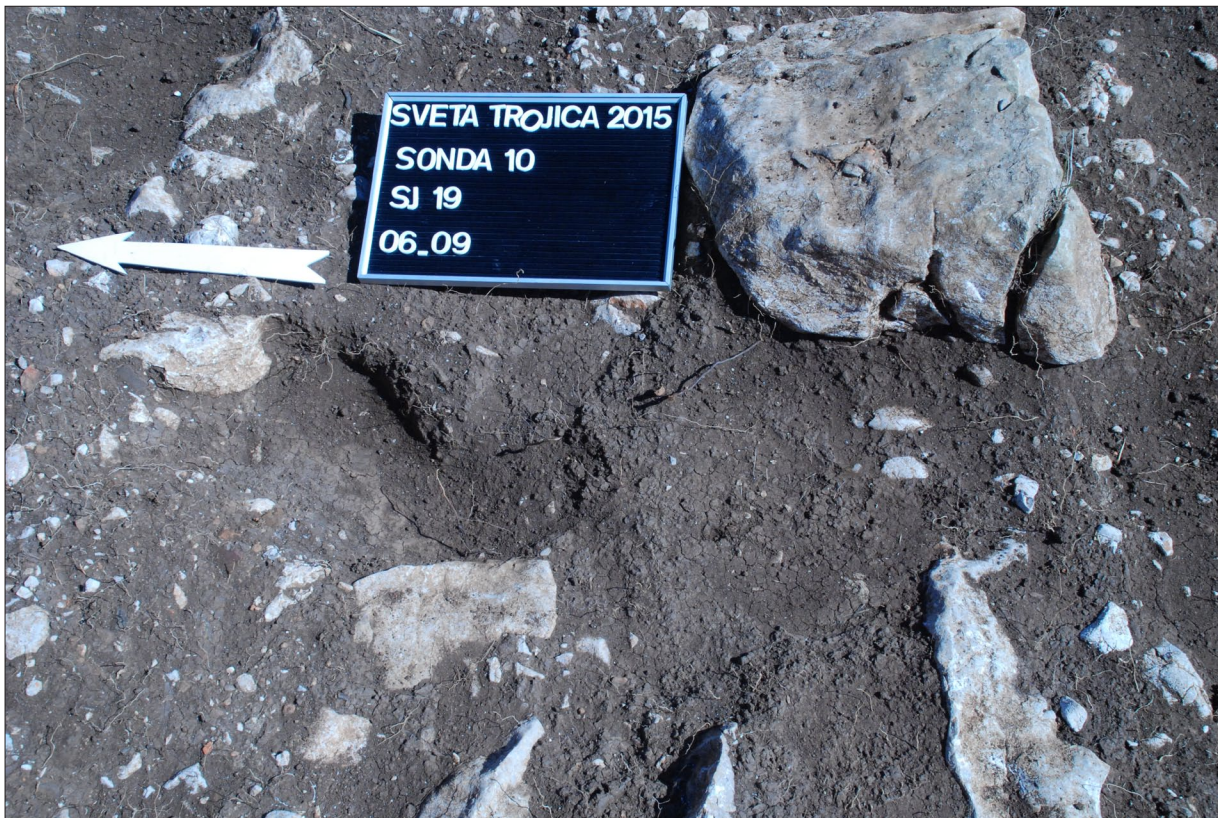
Sl. 1 Detalj sačuvanog sloja nabijene gline (podnice) u sondi 10.

Fig. 1 Detail of a preserved layer of compacted clay (floor) in trench 10.