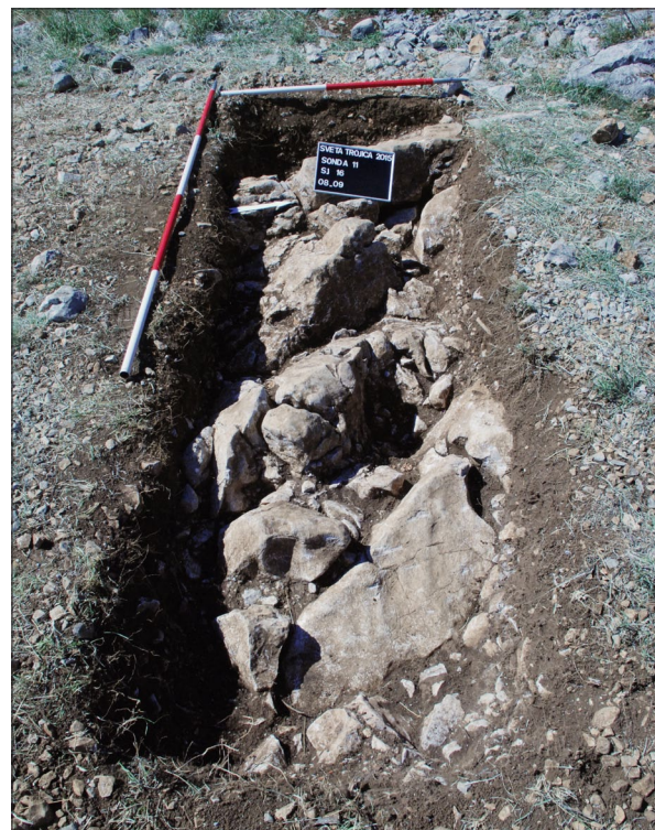
Sl. 2 Sonda 11 na kraju istraživanja.

Prikupljena pokretna građa potvrđuje dosadašnje zaključke o intenzivnom korištenju tog gradinskog položaja tijekom druge polovice 1. tis. pr. Kr. S obzirom na odsustvo nalaza koji odgovaraju onima iz sondi istraženih na južnim obroncima naselja, moguće je da slojevi istraživani ove sezone pripadaju najstarijoj fazi samog gradinskog naselja. Posebno vrijedi istaknuti ostatke podnice koji predstavljaju jedine do sada zabilježene strukture koje bi se mogle povezati sa stambenom infrastrukturom. Istraživanjima 2015. godine završen je ciklus istraživanja u sklopu trogodišnjeg financiranja odobrenog od Ministarstva kulture, no dosadašnji rezultati upućuju na važnost nastavka istraživanja na ovom iznimnom položaju. Predstoji obrada cjelokupne keramičke i metalne građe kao i životinjskih kostiju kojima će se dobiti bolji uvid u gospodarske, kronološke i kulturoške osobitosti protopovijesnog naselja. S obzirom na