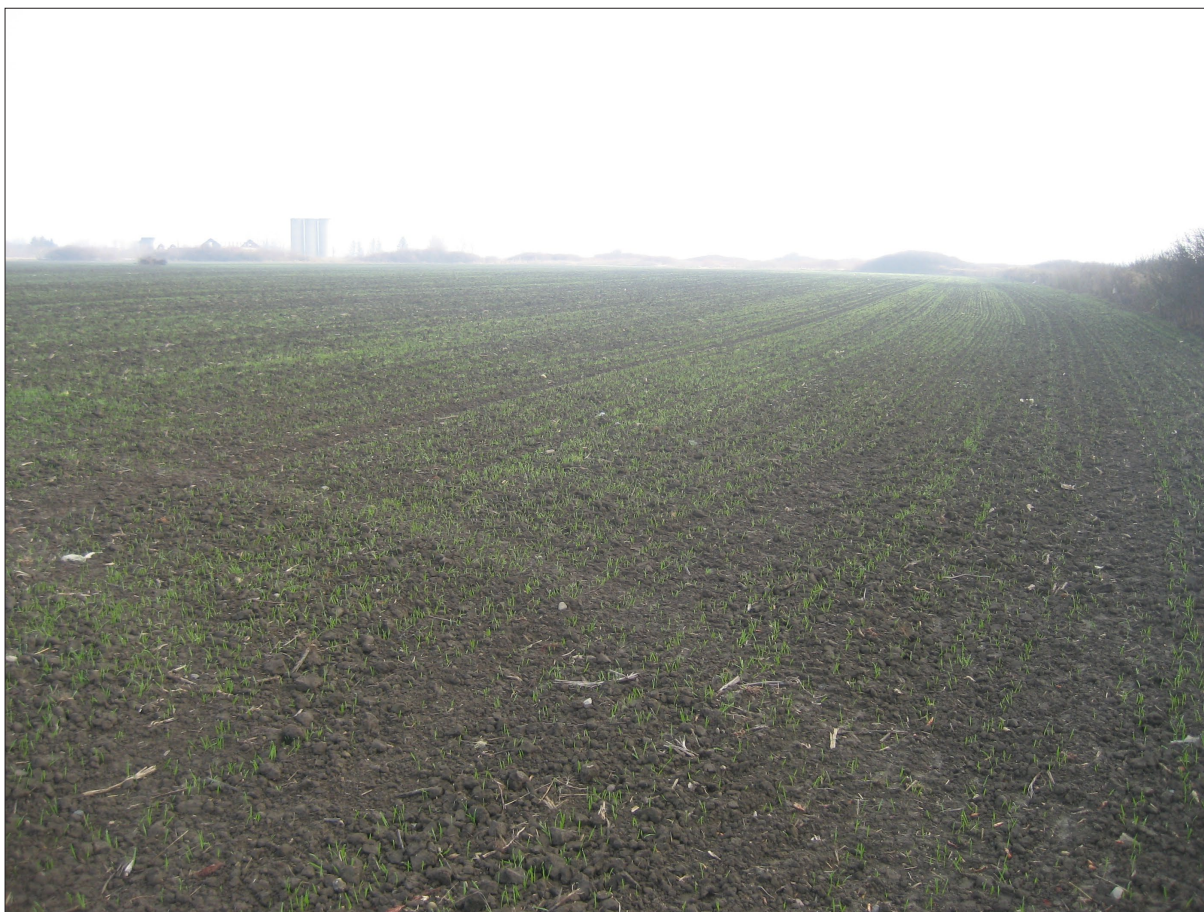
Sl. 2 AN 3 Vinkovci - Milovanci.