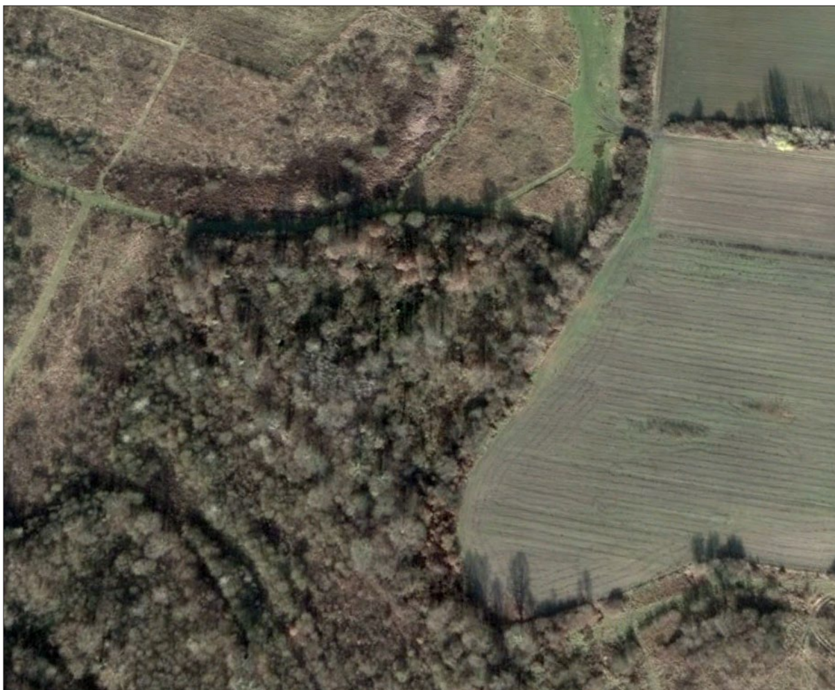
Sl. 1 Marjanski Ivanovci – Otok – satelitska snimka s položajem objekta trokutastog tlocrta i vidljivim nasipom te jarkom oko lokaliteta (prema Google Earth 03.12.2015.).