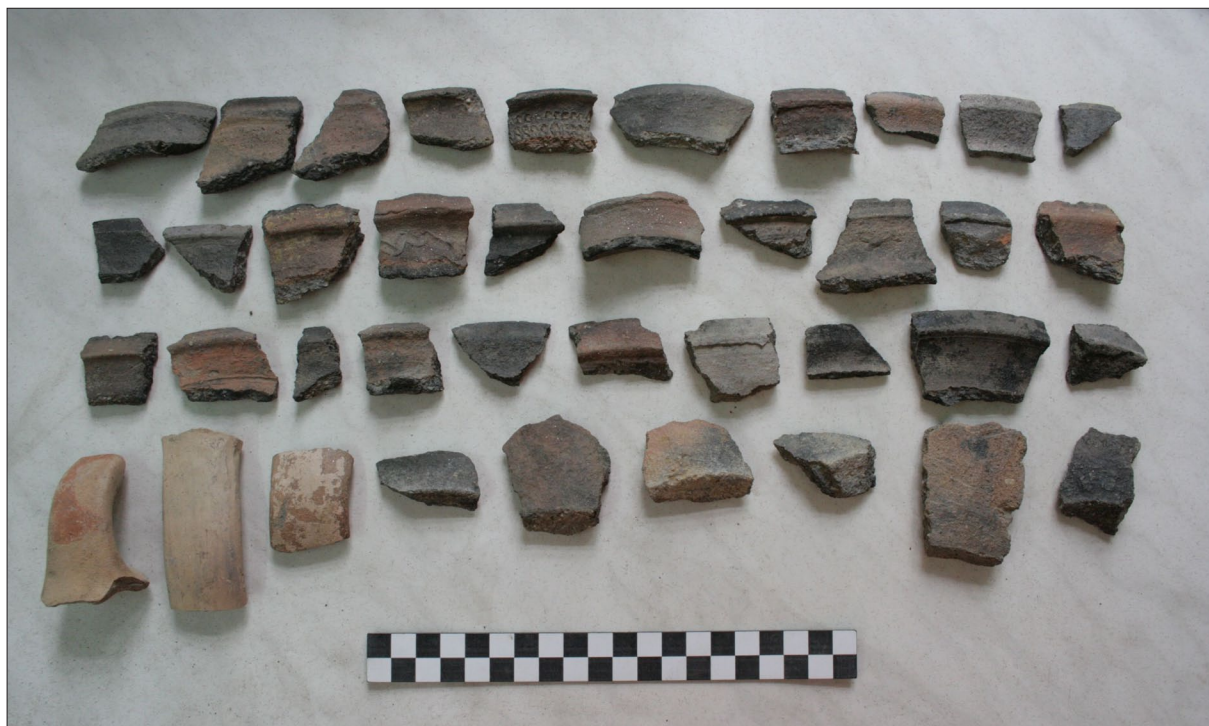
Sl. 3 Rakitovica – Serkovine – srednjovjekovna keramika s lokaliteta.