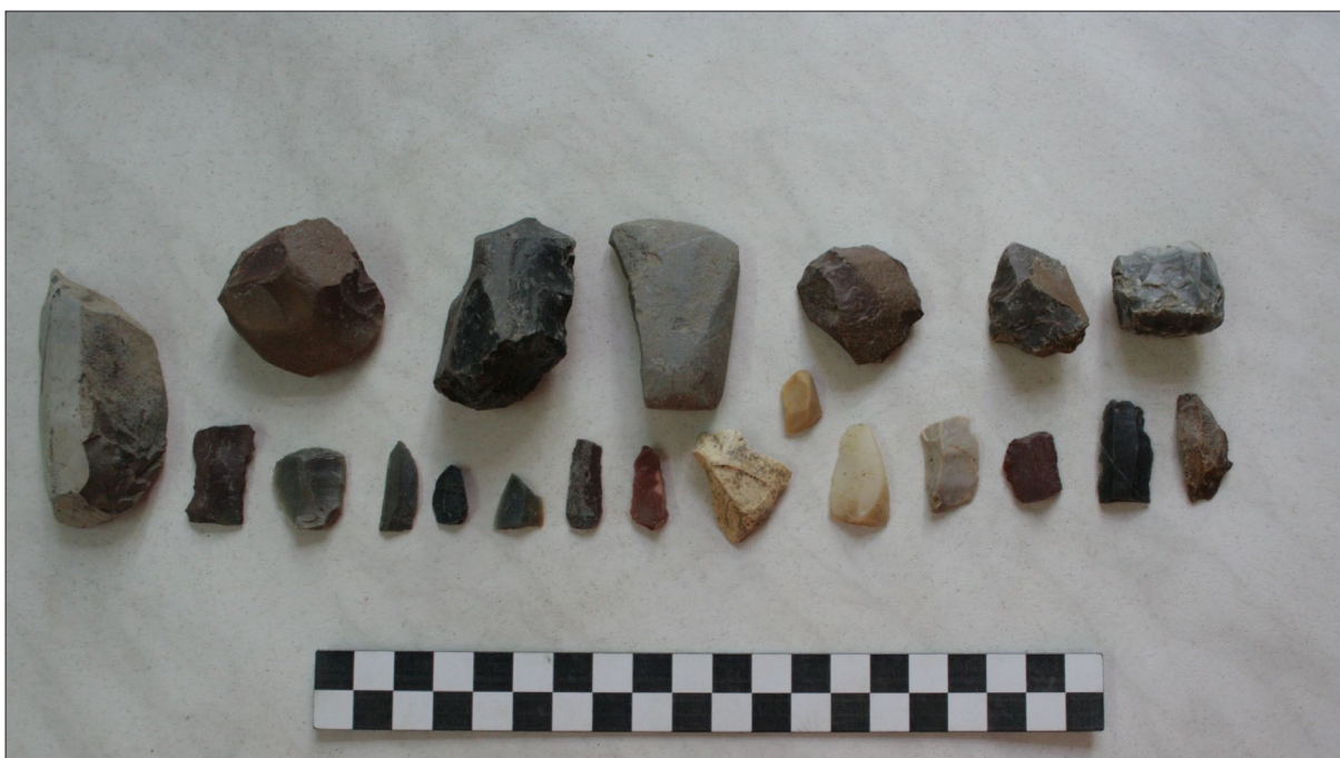
Sl. 2 Miholjački Poreč – Gaj – litički artefakti s lokaliteta.