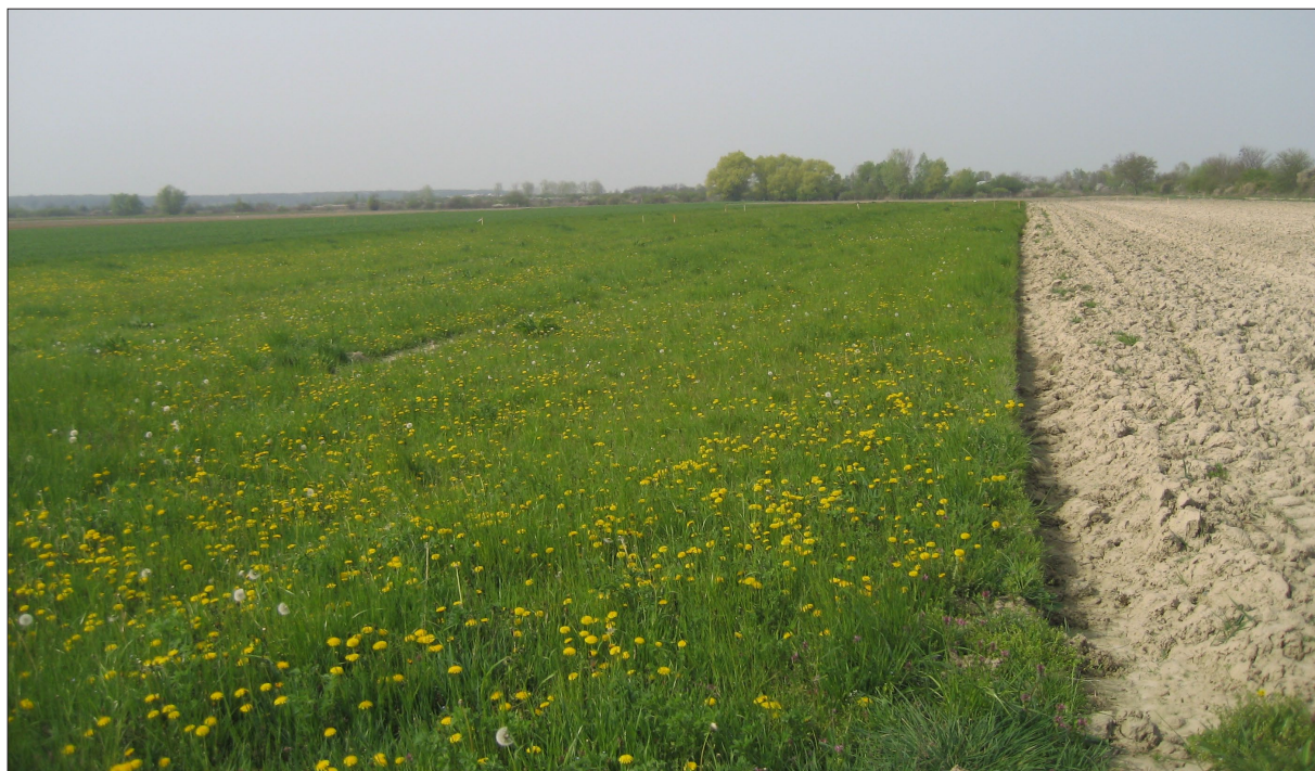
Sl. 2 AN 2 Donji Miholjac – Vrancari.