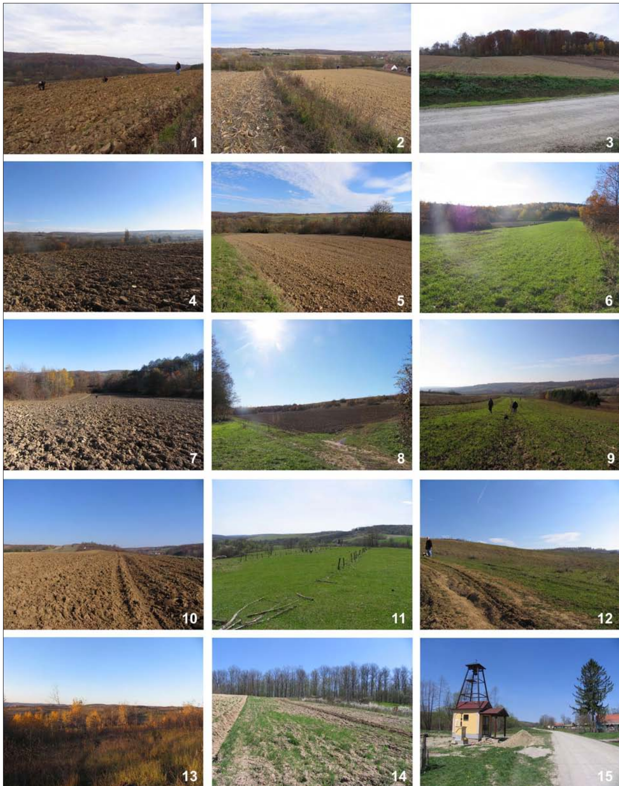
Sl. 2 Nalazišta. 1: Branjevina – Pavlovac; 2: Polubaše 1; 3: Polubaše 2; 4: Polubaše 3; 5: Polubaše 4; 6: Polubaše 5; 7: Polubaše 6; 8: Polubaše 7; 9: Granice – Cerik; 10: Granice – Salaš; 11: Rozmajerovac – Drenik; 12: Rozmajerovac – Duge njive; 13: Rozmajerovac – Zidine; 14: Rozmajerovac – Grad; 15: Rozmajerovac – Kapela sv. Florijana (snimila: J. Jurković; izradila: K. Botić).