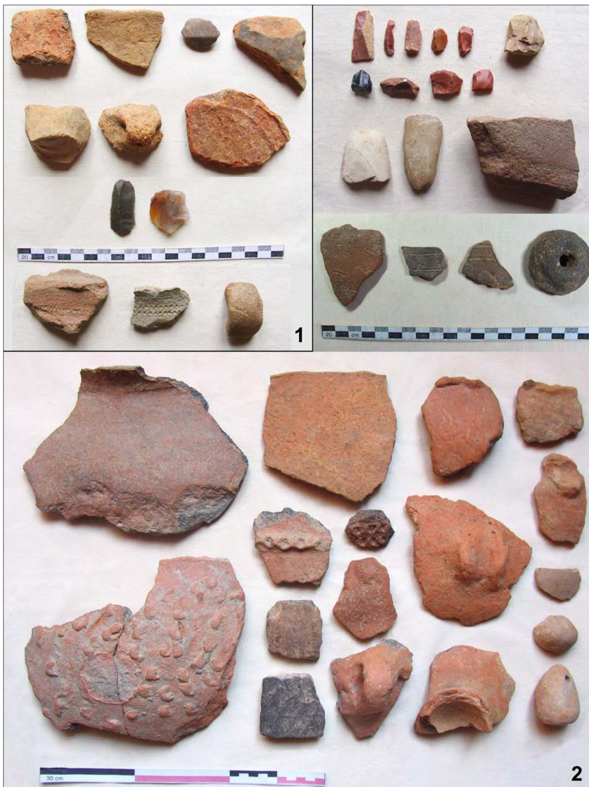
Sl. 3 Branjevina – Pavlovac, eneolitička (lasinjska?) keramika, mikroliti i kasnosrednjovjekovna keramika (1); Polubaše 1, starčevačka keramika i litika te jedan ulomak ranosrednjovjekovne i nekoliko ulomaka srednjovjekovne keramike (2) (snimila: J. Jurković; izradila: K. Botić).