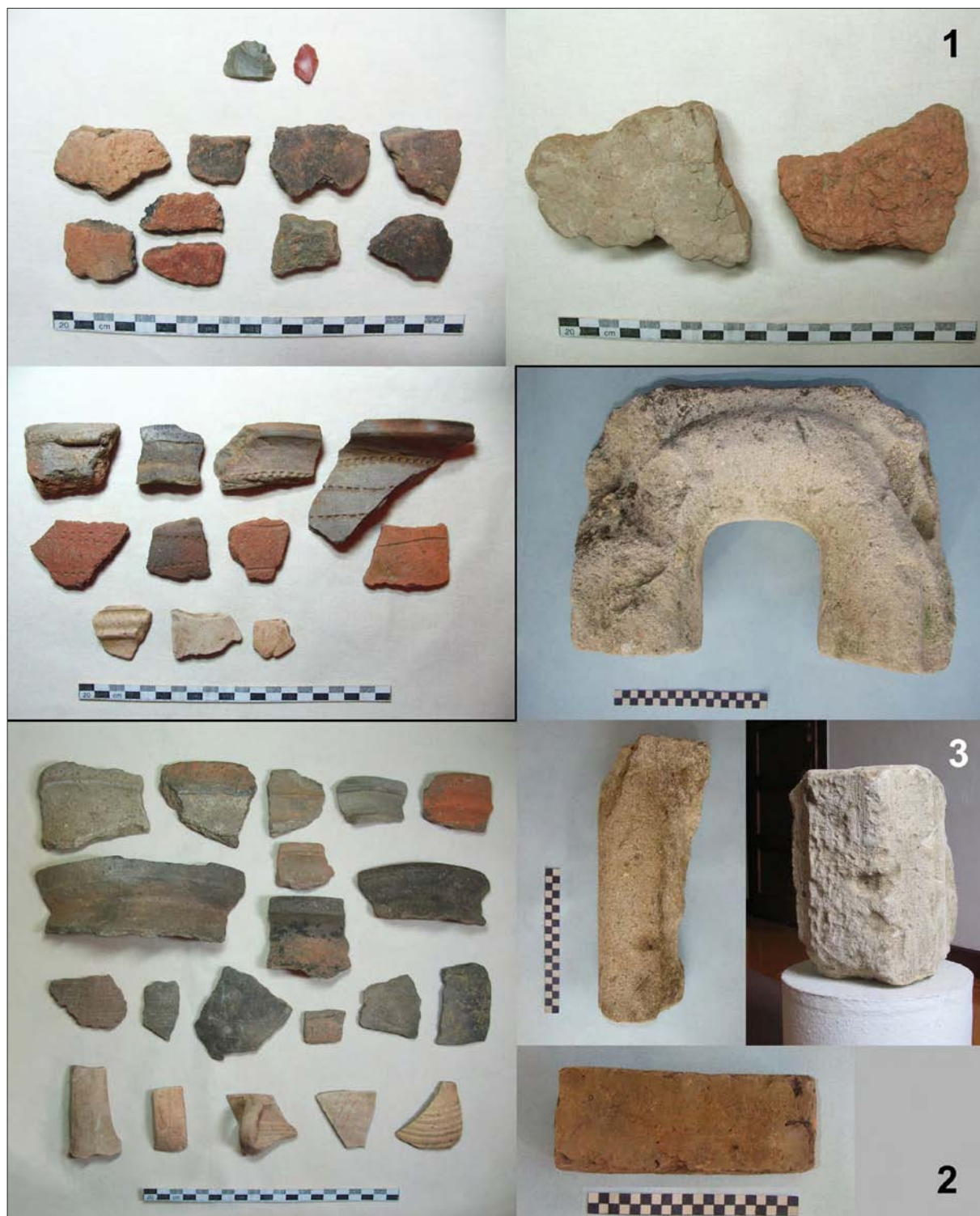
Sl. 6 Rozmajerovac – Duge njive, ulomci prapovijesne keramike, litika, prapovijesni lijepljivi i ulomci srednjovjekovne keramike (snimila: J. Jurković) (1); Rozmajerovac – Grad, ulomci srednjovjekovne keramike (snimila: J. Jurković), prednja strana romaničke kustodije i romanička opeka (snimio: R. Ivanušec) (2); Rozmajerovac – Kapela sv. Florijana, ulomak romaničkog polustupa (snimila: J. Jurković) (3) (izradila: K. Botić).