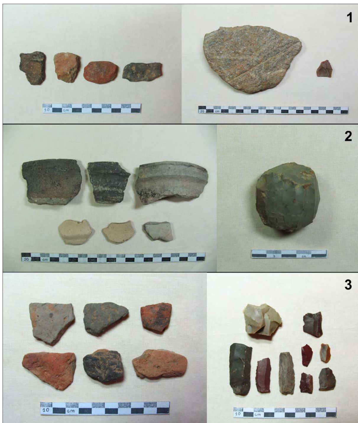
Sl. 5 Granice – Cerik, ulomci prapovijesne keramike i litika (1); Granice – Salaš, ulomci kasnosrednjovjekovne keramike i jezgra (2); Rozmajerovac – Drenik, ulomci prapovijesne keramike i litika (3) (izradila: K. Botić).