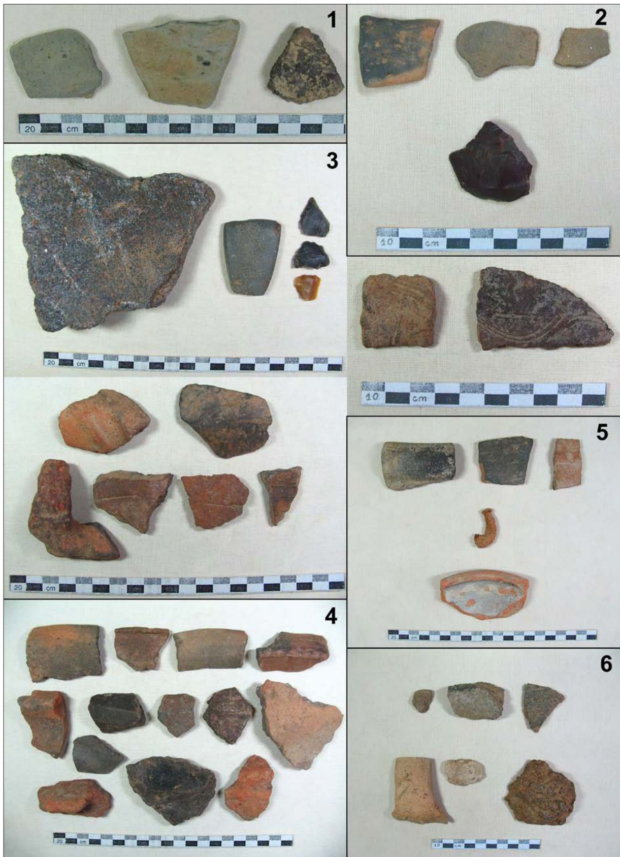
Sl. 4 Polubaše 2, ulomci neolitičke keramike (1); Polubaše 3, ulomci neolitičke keramike i litika (2); Polubaše 4, litika, ulomci eneolitičke keramike, ulomci ranosrednjovjekovne keramike (3); Polubaše 5, ulomci brončanodobne keramike (4); Polubaše 6, ulomak latenske keramike i ulomci novovjekovne keramike (5); Polubaše 7, ulomci kasnosrednjovjekovne keramike, šljaka (6) (izradila: K. Botić).