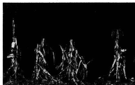
Oh 43 (1964)