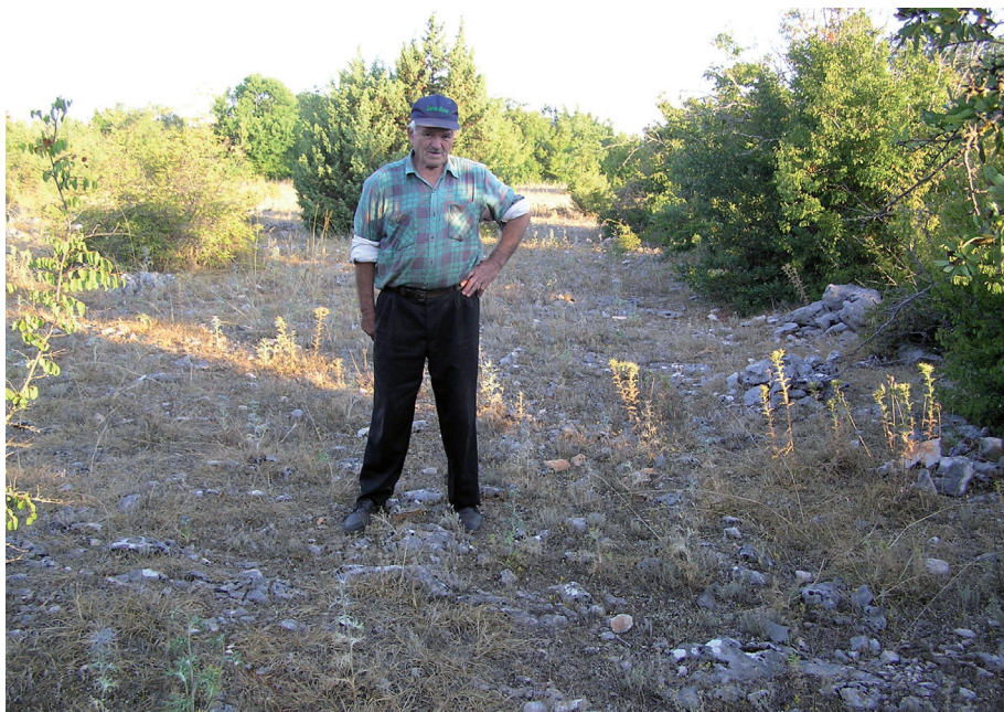
Sl. 18. Ostatci ceste od Tucakovića razdolja do Papčeve vinogradine