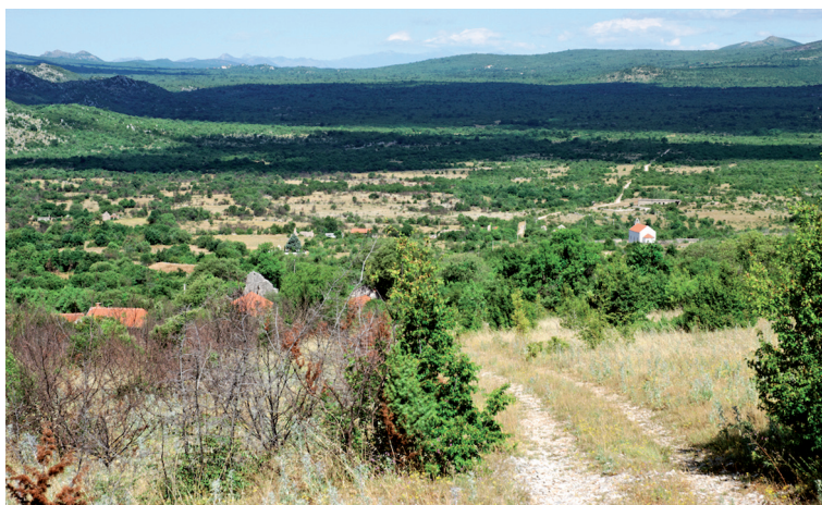
Sl. 20. Trasa ceste uz Voznik

Iz sela Grahovišta cesta ide uz uspon Voznik, 64 te pokraj zaseoka Mahala (Elezovina) izlazi na zaravan do manje uvale. Kasnija trasa kroz uvalu pravi obilaznicu prilagođenu konjskim karavanima. Iz uvale, uz kraći strmi uspon izlazi na brdo Vlaku, ispod Orlova kuka.