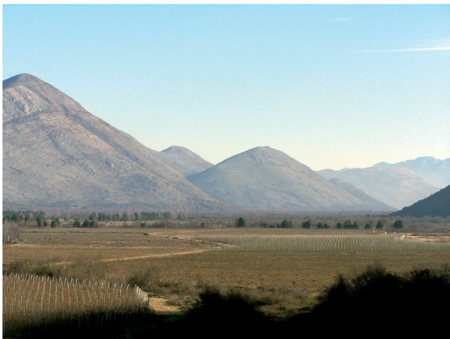
Sl. 31. Kraj Popova polja i početak Luga

U blizini Poljica nalazi se lokalitet Međine na kojem se nalaze dva brežuljka i uokolo njih 8 do 10 gomila, a sve je omeđeno zidinama. 78 Potom cesta prolazi ispod gradine Kličanj, kroz Debeli lug pokraj sela Krnjevića te vodi prema brdu Hum, kojeg obilazi s istočne strane, te nastavlja dalje prema selu Cicini.