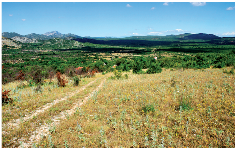
Sl. 21. Crkva sv. Nikole u Gornjem Hrasnu i plato Hrasna

Trasa rimske ceste ograđena je i sužena starim zidovima (ulica), širine 3,5 m. Uz Pelinov brijeg ide do izlaza na prijevoj (sedlo) kod Miloševića tora. Na samom kraju gdje trasa izlazi na prijevoj, granica je između općine Neum i Ravno. Također i na navedenoj dionici, uza samu trasu, nalaze se gomile, a nekoliko njih je u nizu. 65