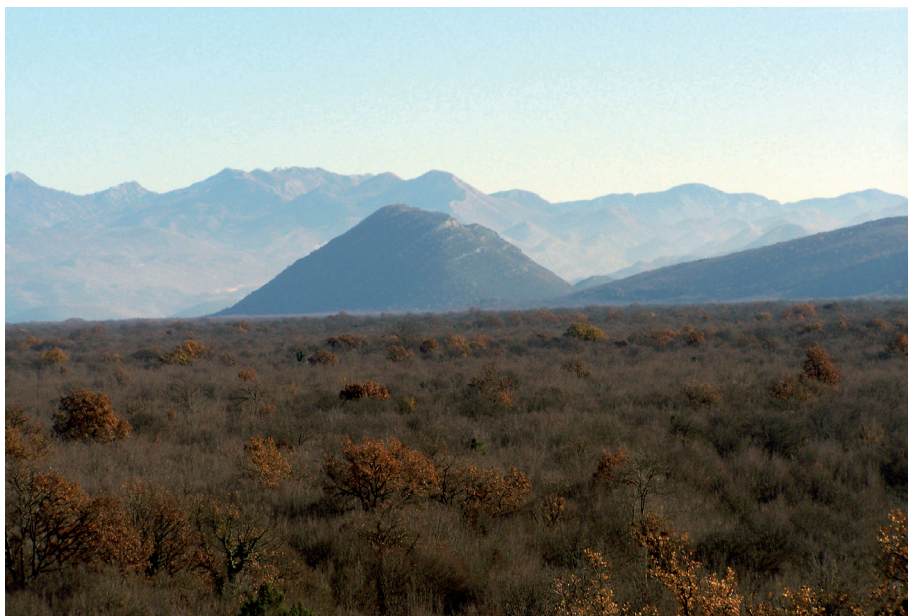
Sl. 33. Lug - u pozadini brdo i gradina Hum

Pretpostavljamo da je kasnije (2. ili 3. st.) na području gdje su pronađeni miljokazi bilo veće križanje putova pa su postavljeni da usmjeravaju putnike. I ovaj putni pravac karakterističan je za rimske ceste, a izlazio je u Bjelin dolu 82 gdje je bila željeznička stanica Hum. Na širem području Huma registrirane su prapovijesne gradine i antička naselja.