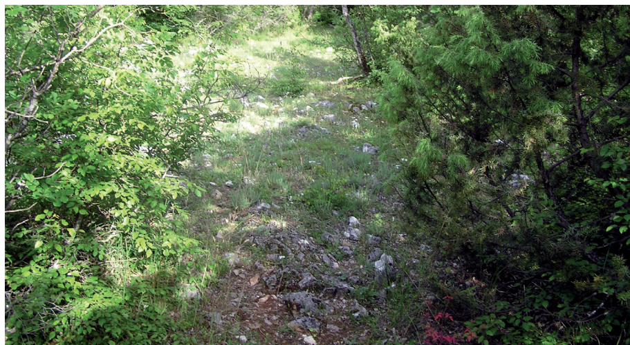
Sl. 15 i 16. Obaljeno groblje i ostatak Velikoga puta kroz Njavrine ograde ispod Osječenice