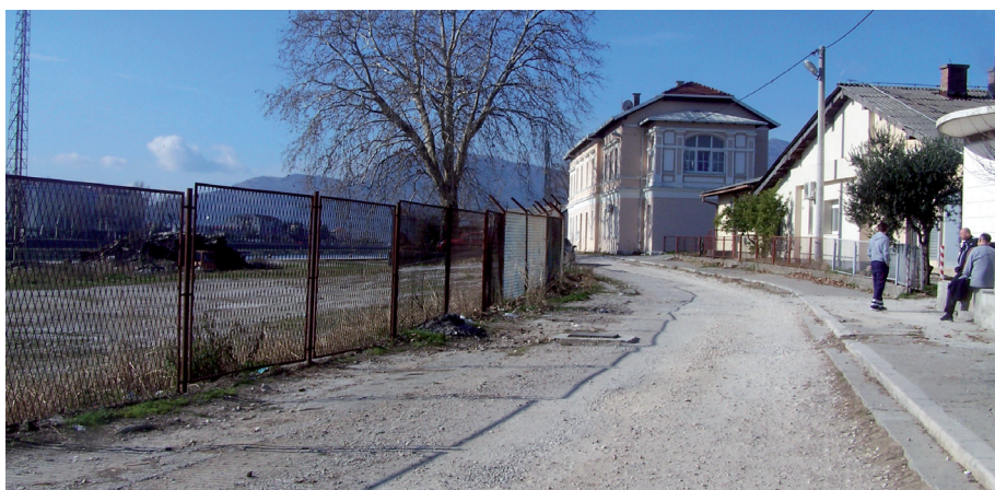
Sl. 3. Mjesto na kojem se nalazila rimska ciglana