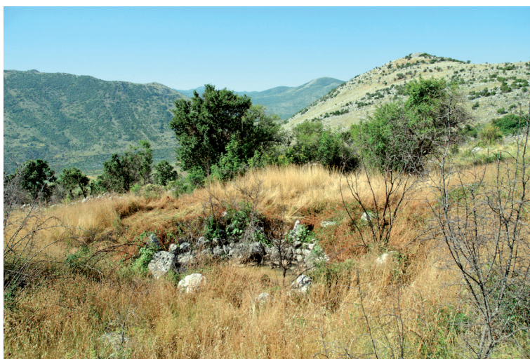
Sl. 23. Lokva uz put pokraj Čavaške gradine

U proljeće, kada je vegetacija niska, promatrajući s željezničke pruge diionicu ceste od Zmijanja pa prema selu Čavaš, 69 uočava se žuta crta koja označava samu cestu.