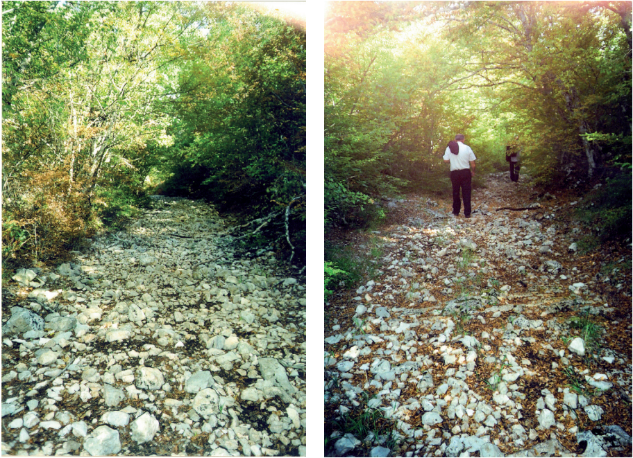
Sl. 12 i 13. Ostaci ceste preko Babina dola

đen nasip niti usjek. Da je navedena cesta išla ovim pravcem, potvrđuje rimski novac pronađen na Babinom dolu nedaleko od same dionice. 42