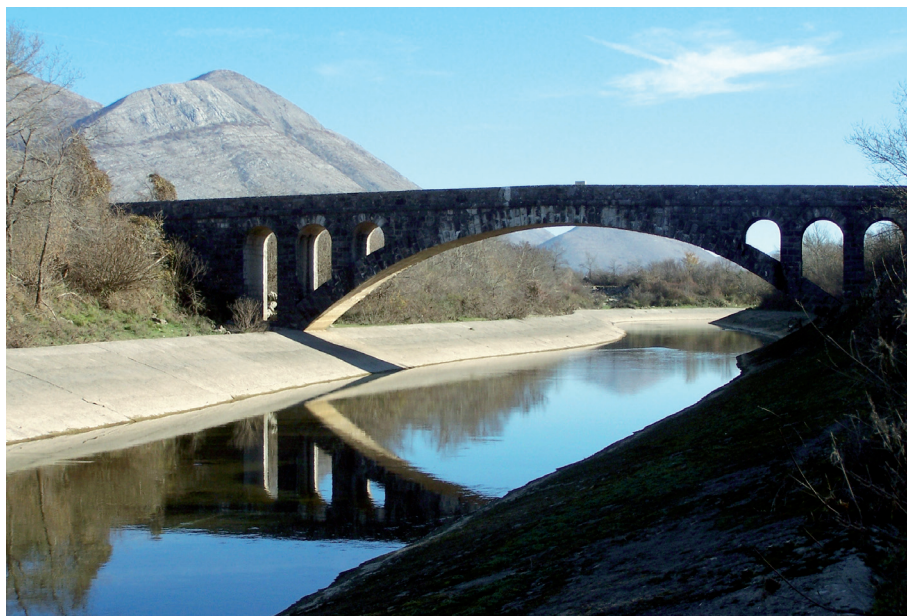
Sl. 32. Novi most preko Trebišnjice pod Sedlarima

Trasu rimske ceste od Doljana do Huma nije nitko od arheologa do sada detaljno istražio tako je i pitanje miljokaza upitno do Veličana u Popovu. Do sada pronađeni miljokazi su na Velikom putu u blizini Huma. 79 Pokraj puta u selu Nenovićima nalazi se rimski miljokaz na kome je u reljefu isklesan križ. U selu Đedićima također se nalazi izvrnuti rimski miljokaz oblim dijelom zaboden u zemlju. Površinska likovna analiza pokazuje tri faze: miljokaz, isklesavanje križeva, i postavljanje u obrnut položaj te urezivanje natpisa. 80 Treći miljokaz pronađen je u blizini Zborne gomile, uza stari kaldrmirani (napušten) put 81 ispod sela Lug.