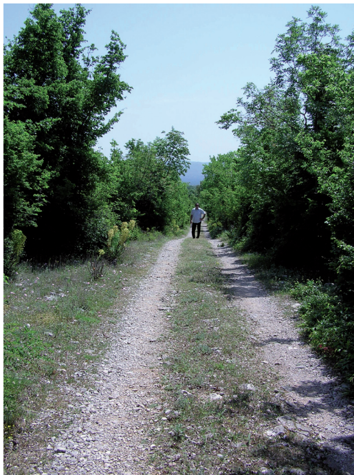
Sl. 17. Dio trase Velikoga puta od skretanja Međuljuće prema Toplici

Cestu presijeca skretanje za Osječenicu a ograđena je zidovima. Nasuprot skretanju na Osječenicu nalazi se Raičeva lokva (ili Kaočina). 54 Trasu ceste od raskrižja u Međuljuću do Toplice mještani zovu Donji put , Veliki put ili cesta . Na dionici Međuljuće - Raskrsnica - Toplice, u blizini Hrasna nađene su spurile. 55