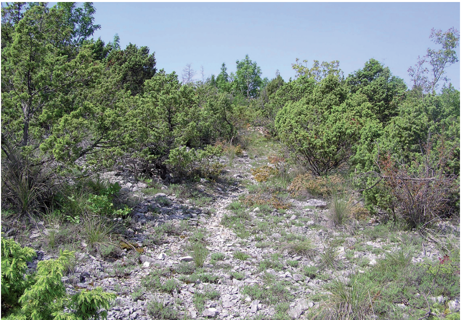
Sl. 8. Dio stare ceste kod Gomila