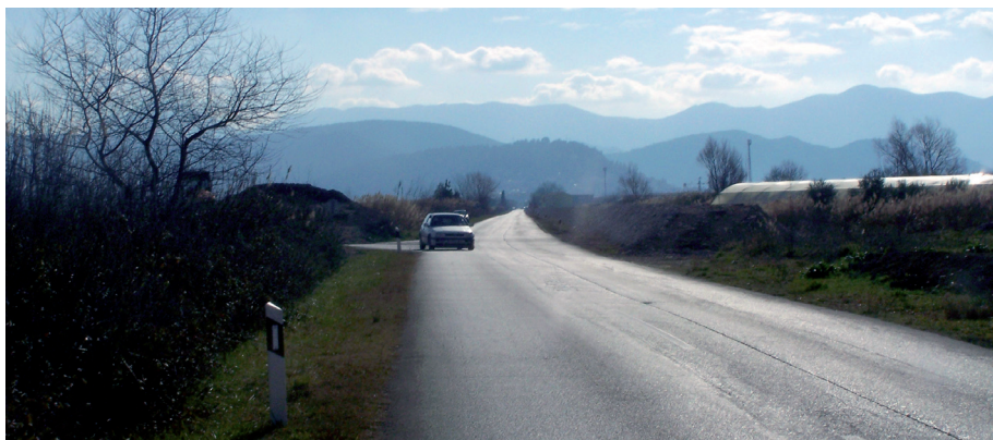
Sl. 2. Cesta od Vida prema Metkoviću