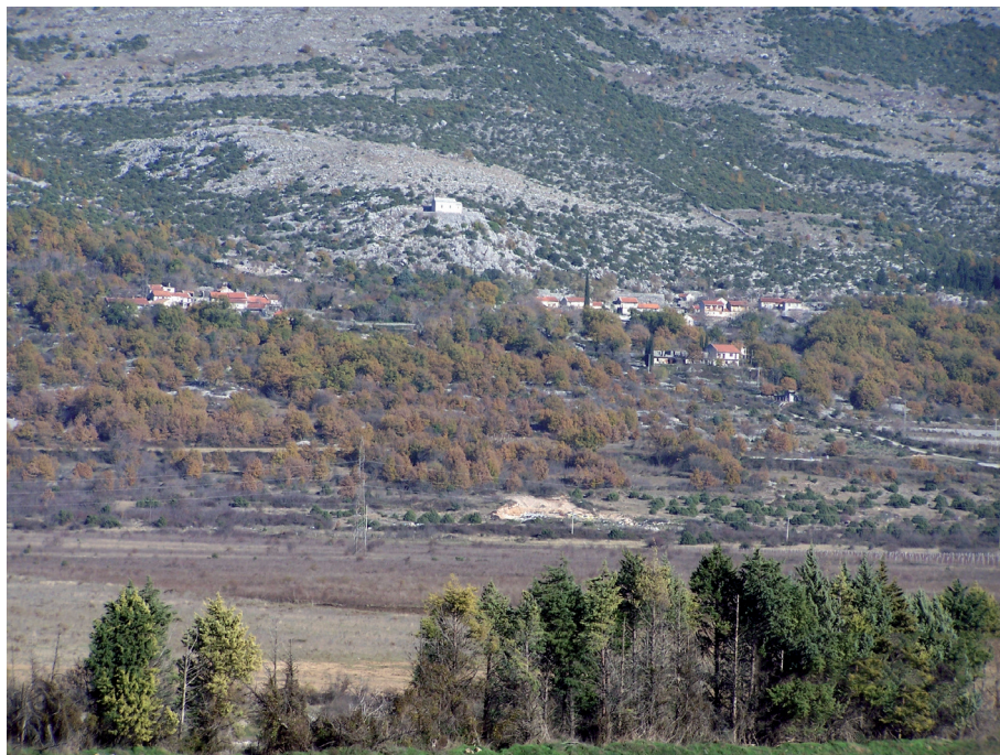
Sl. 30. Selo Dubljani