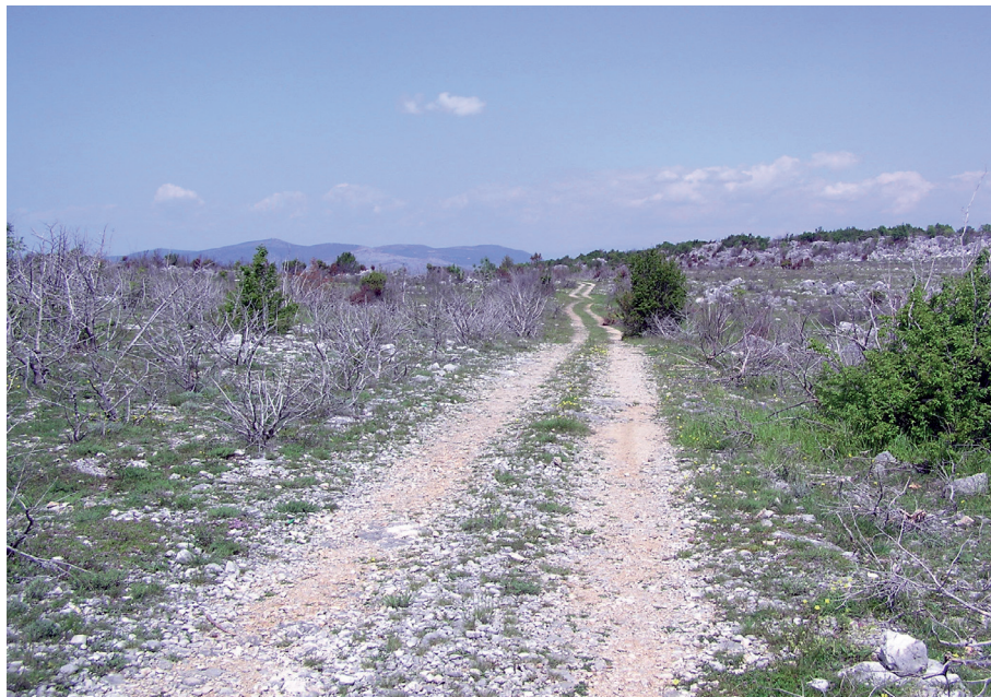
Sl. 6. Današnja cesta koja poklapa rimsku, a koja izlazi na visoravan kod Ristina greba

Na ovoj dionici cesta je široka oko 4-5 m s podzidom i očuvanim ivičnjacima. Makadamska cesta na prijevoju kod Gomila izlazi kroz usjek te skreće ulijevo i ide iznad Stare ceste te prije Ristina greba ponovno se spaja s rimskom cestom. Pokraj Ristina greba produžava ravninom Milkove drage gdje je Staru cestu , širine oko 6 m, prekrila makadamska cesta koja obilazi Bubrešku valu, a trasa rimske ceste pruža se u ravnoj liniji, te spušta niz uvalu (širina trase 6 m). U uvali su sačuvani ivičnjaci i podzid. Vjerojatno je u kasnije doba cesta u uvalu silazila u krivini gdje se također uočavaju ivičnjaci.