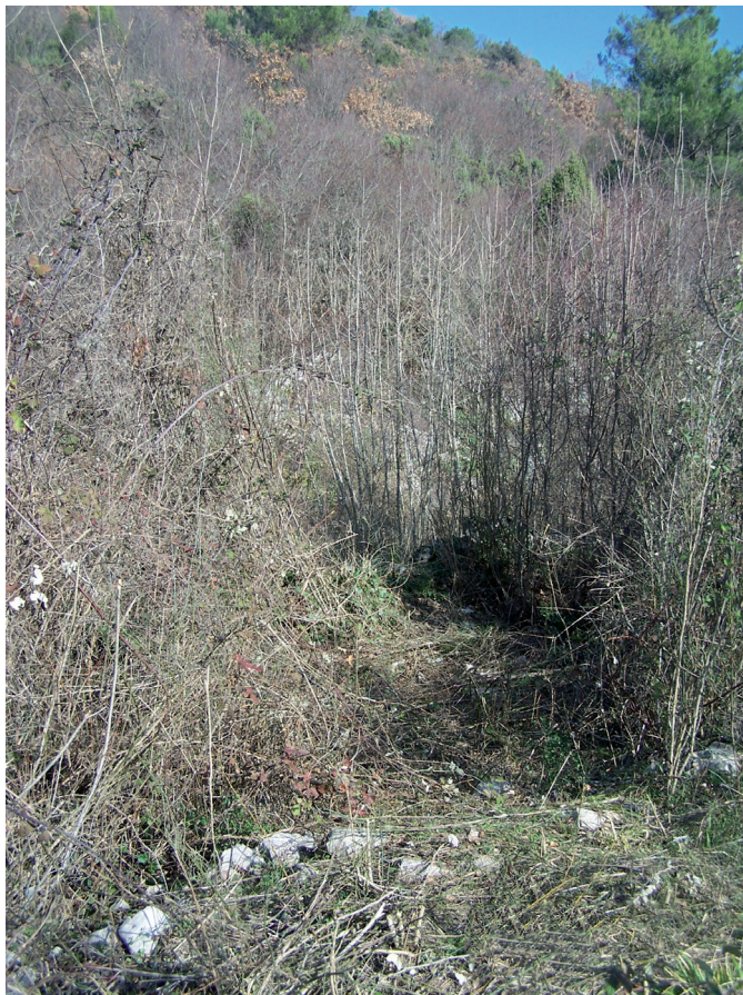
Sl. 5. Ostatci rimske ceste u širini od 4 m ispod brda Šibenica

Raičevom valom prema Brstinovim ledinama, te dalje uz brdo nastavlja prema Kljenku. 25