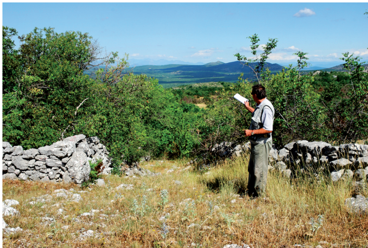
Sl. 22. Izlaz iz Hrasna na Čavašku gradinu