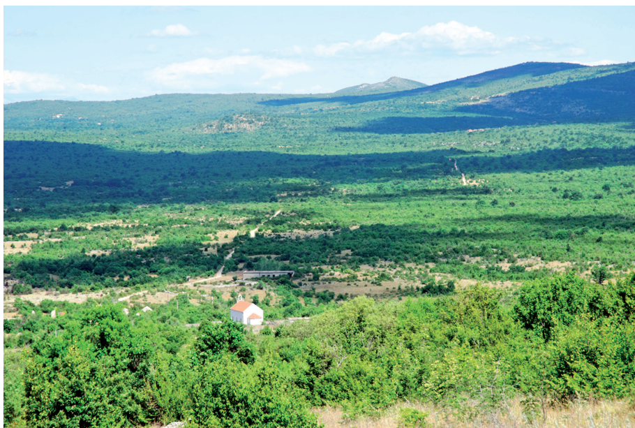
Sl. 19. Panorama Hrasna s putnim pravcem prema Grahovištu