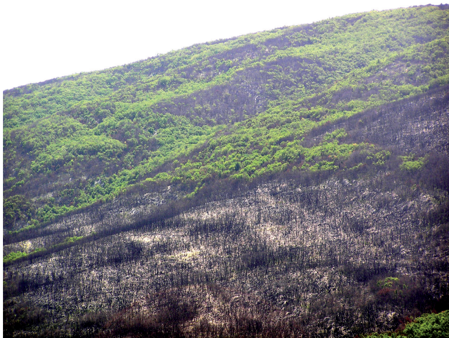
Sl. 11. Sjeverni dio brda Zvezdine (gdje je uočljiva trasa ceste koja se koso diže do Petrova dola)