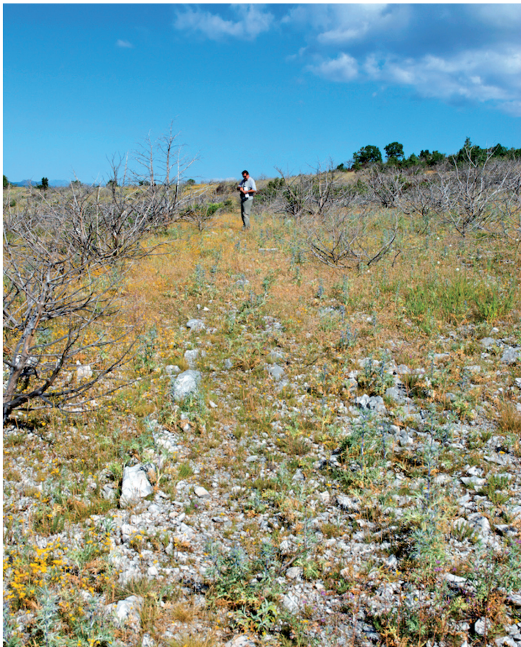
Sl. 24. Detalj trase na Zmijanju