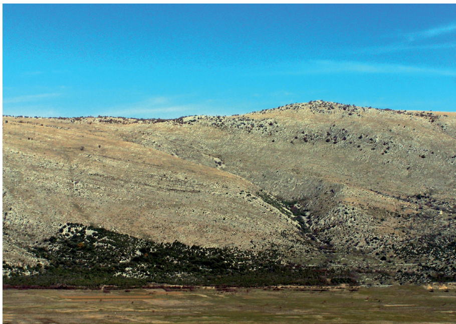
Sl. 25. Silaz niz Zmijanje pred Čavašem