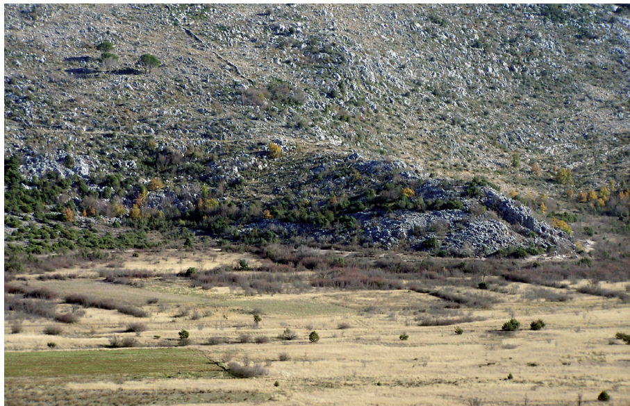
Sl. 27. Orašje - stara cesta