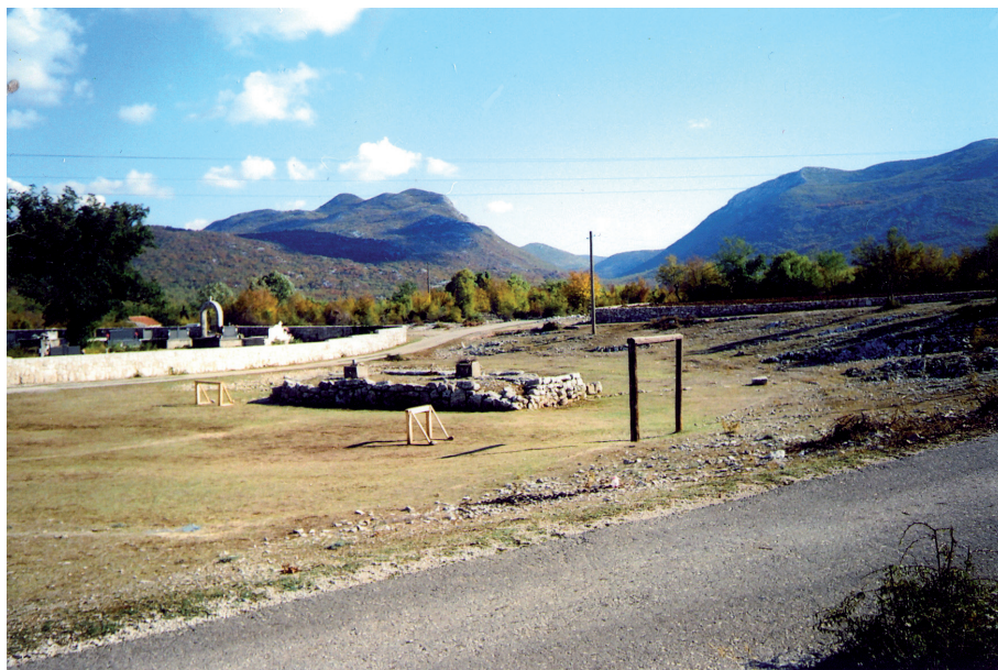
Sl. 14. Stara cisterna (čatrnja) na Brštanici. Desno od čatrnje uza zid groblja nalaze se ostatci rimske građevine

Patsch je ovaj pravac označio kao dionicu ceste Tilurium - Scodra preko Hutova 43 a koji je doveden u pitanje pronalaskom miljokaza cara Tita u Prudu. 44 Na ovaj putni pravac u selu Mramoru izlazi put koji ide iz sela Brštanice (od crkve sv. Ante). Uza samu dionicu, na lokalitetu Špadnji greb - Bekanova dubrava nalazi se manja nekropola stećaka. 45