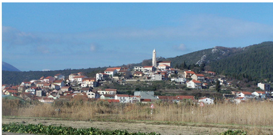
Sl. 1. Panorama Vida