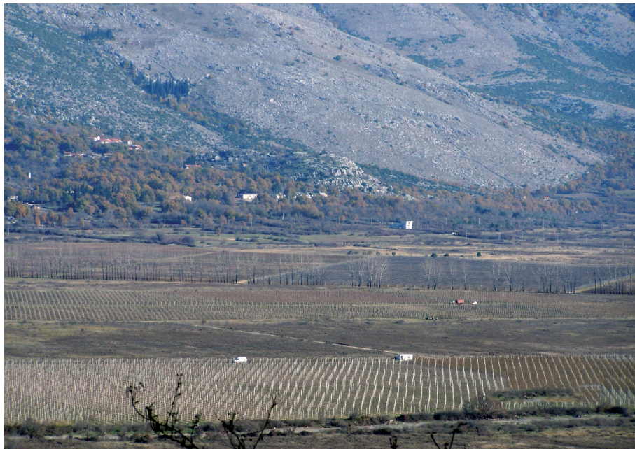
Sl. 29. Popovo polje - Selo Veličani