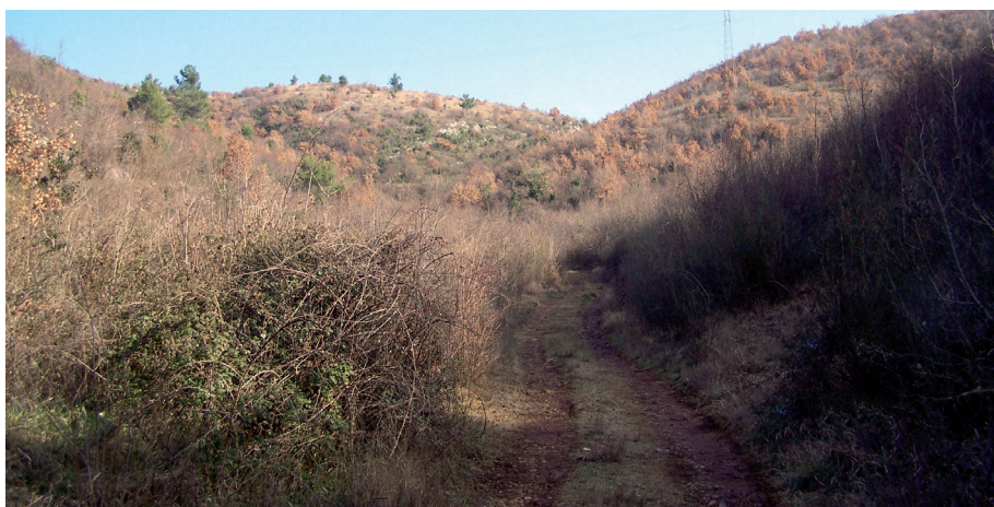
Sl. 4. Udolina ispod Kljenka-Lazetine