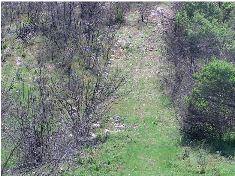
Sl. 9 i 10. Ostaci rimske ceste prema Kljenku