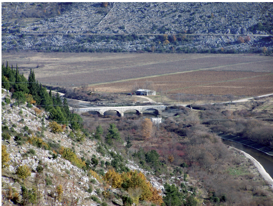
Sl. 28. Dvije trase starih cesta na izlazu iz Orašja - stara cesta preklopljena magistralnom prema Galičićima te cestom i mostom preko Trebišnjice pod Ravnim