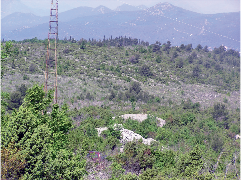
Sl. 7. Lokalitet Gomile