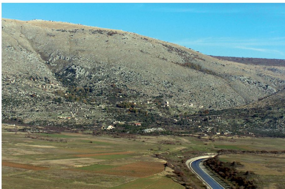
Sl. 26. Selo Čavaš