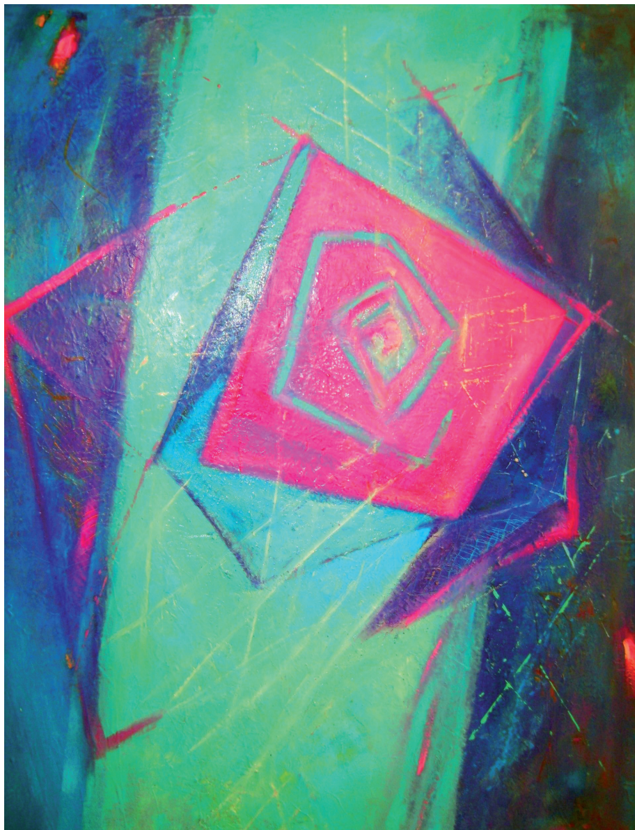
Slika 2: Kristalna samogradnja, 2015., 180x100 cm