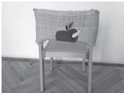
Orijentiri su taktilne oznake pomoću kojih dijete raspoznaje prostor

J edno od čestih pitanja jest i ono kakve igračke dati djetetu s oštećenjem vida. Treba reći kako ne postoje posebne igračke za djecu s oštećenjem vida osim nekoliko prilagođenih igračaka poput zvučne lopte i društvenih igara. Svaki odgajatelj može sam prilagoditi vizualne igračke kako bi se njima moglo koristiti i dijete s oštećenjem vida. U