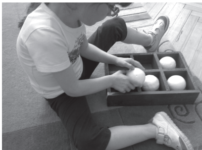
Igra za vježbanje sheme šestotočke kao temelja brajevog pisma

okoline koje doživljavamo. Najveći udio u našem doživljavanju okoline ima vizualno percipiranje, koje nam pruža 80% informacija. Kod djeteta s oštećenjem vida vizualno percipiranje je smanjeno, govorimo li o slabovidnom djetetu, ili ga, govorimo li o slijepom djetetu, uopće nema. Stoga je i modalitet učenja kod ovog djeteta sasvim drukčiji. To u prvom redu znači da kod djeteta s oštećenjem vida nema spontanog učenja. Dijete koje ima mali ostatak vida ili ga uopće nema neće moći učiti po modelu, imitacijom. U ranom djetinjstvu to je dominantan način učenja. Osim različitosti u načinu, i proces učenja kod ovog djeteta je znatno sporiji. Razlog tome je što dijete uči sukcesivno. Dijete uči uglavnom putem dodira konkretnih predmeta koje mora uzeti u ruku ili opipati – ili mora koristiti više i druga osjetila kao što su sluh, njuh ili okus, što zahtjeva više vremena. Na primjer, kad slijepo dijete uđe u prostoriju, ono rukama opipava stvari koje su u njegovoj najbližoj okolini i na taj način upoznaje dio prostorije. Za razliku od njega, dijete koje nema poteškoća s vidom pogledom obuhvati cijelu prostoriju i doživljava je u cijelosti.