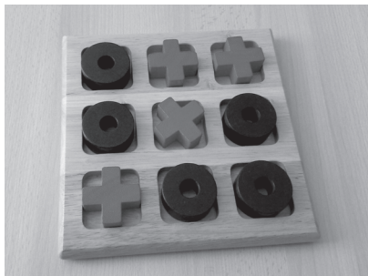
Taktilna igra križić-kružić

N avedeno su razlozi za razvojna kašnjenja kod djeteta s oštećenjem vida koja prema različitim istraživanjima iznose otprilike godinu dana. Naravno, to kašnjenje ovisi o svakom pojedinom djetetu kao i ostatku vida koje dijete ima. Navedeno su razlozi za nužnost rane intervencije u odnosu na dijete s oštećenjem