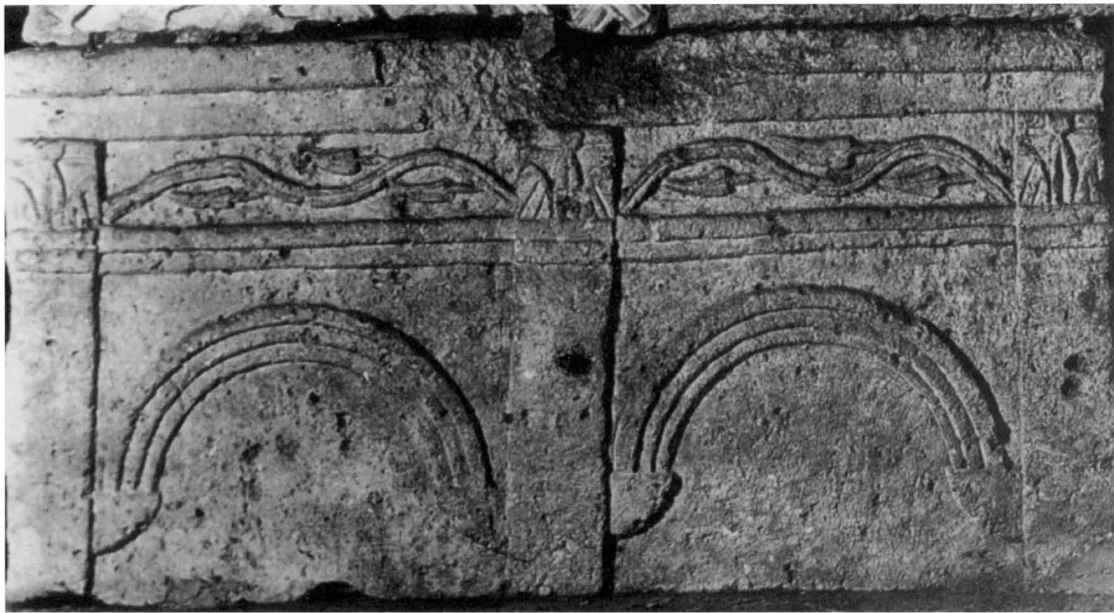
5. Aquileia, Museo Paleocristiano, ulomak bočne strane sarkofaga / Aquileia, Museo Paleocristiano, fragment of a side of a sarcophagus

i rubnom profilacijom nalazi se na ulomku (sl. 6) bočne strane ranokršćanskog sarkofaga iz Novigrada u Istri. 18 Već je uočeno da su primjeri iz Novigrada i Aquileje produkti iste radionice. 19 Ti sarkofazi pripadaju tipu arhitektonskog sarkofaga koji je bio popularan na području gornjeg Jadrana 20 a čak su i sarkofazi sjeverne Dalmacije bili bliski akvilejskoj produkciji. 21 Motiv lukova na konzolama također je evidentiran na sarkofazima 3. stoljeća iz gornje Italije (npr. Modena i Carpi). 22 Budući da je na ulomku iz Novalje očuvan samo rub sarkofaga ukrašen bršljanovom viticom, ne može se znati da li je pripadao prednjoj strani s pretpostavljenim strigilama ili jednoj od bočnih strana s lukovima na konzolama.