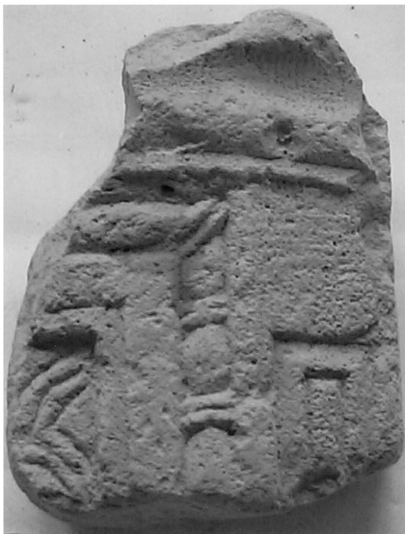
1. Novalja, zbirka Stomorica, ulomak pluteja ukrašen motivom squama / Novalja, Stomorica Collection, fragment of a panel with squam motif