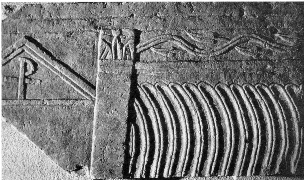
4. Aquileia, Museo Paleocristiano, ulomak prednje strane sarkofaga / Aquileia, Museo Paleocristiano, fragment of the front of a sarcophagus

zirajućim profilacijama (sl. 2), A. Šonje ga nigdje ne spominje a nepoznate su i okolnosti njegova pronalaska. 12 Ulomak je isklesan od identičnog vapnenca a dio je gornjeg ili donjeg dijela pluteja. Sačuvan je i trag krajnje rubne profilacije. Plutej je bio ukrašen mrežom rombova uokvirenom profilacijom i ukrasnom trakom koja se sastojala od pognutih S vitica. Čini se više nego vjerojatnim da je ovaj plutej činio istu oltarnu ogradu zajedno s prethodnim plutejem. Isti tretman rubnih profilacija i ukrasne plohe koja se ukrašava mrežom – na ovom primjeru mrežom rombova a na prethodnom mrežom squama – govori u prilog njihovom zajedničkom porijeklu. Jednako tako, oltarne ograde ukrašene rombovima derivat su antičkih ograda kakve su stajale u konzularnim i carskim ložama. Premda C. D. Shepard datira ulomak okvirno u 5. ili 6. stoljeće, sklonija sam prihvatiti dataciju A. Šonje ta ga pripisati 5. stoljeću zbog nedostatka tipičnih justinijanskih rješenja kakve poznajemo duž cijele istočne jadranske obale tijekom 6. stoljeća.