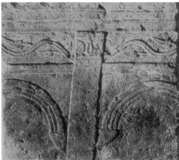
6. Novigrad, lapidarij, ulomak bočne strane sarkofaga / Novigrad, Lapidarium, fragment of a side of a sarcophagus

groblja izvan zidina, sekundarno dospio unutar gradskih zidina te da je poslužio kao građevinski materijal za kasnije građevine nastale iznad velike ranokršćanske bazilike sv. Marije.