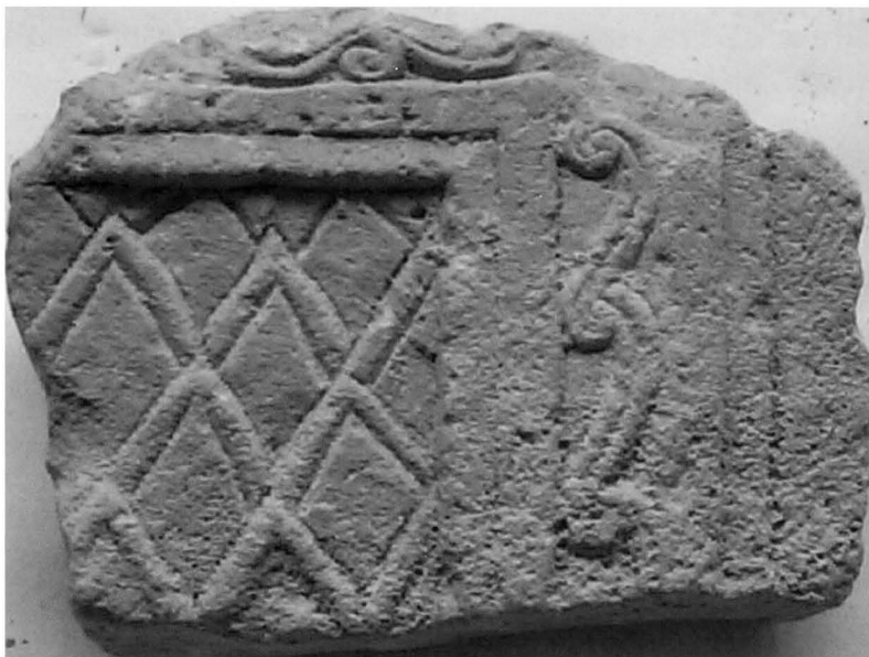
2. Novalja, zbirka Stomorica, ulomak pluteja ukrašen rombovima / Novalja, Stomorica Collection, fragment of a panel with loenges