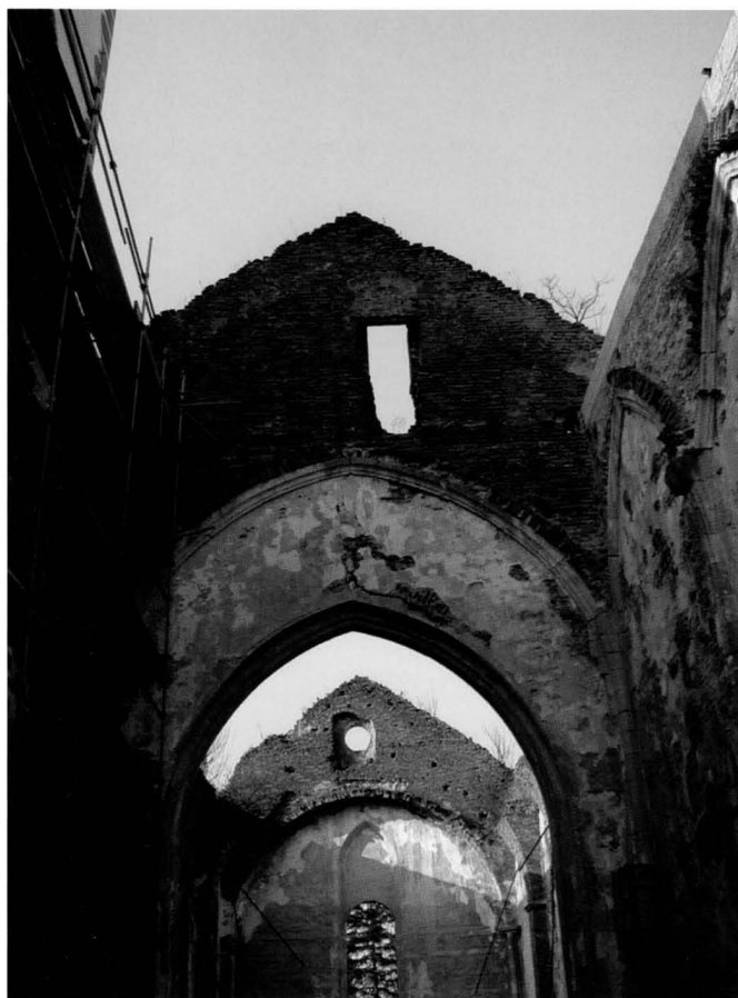
8. Pogled na unutrašnjost crkve, stanje 2004. godine / View of the interior in 2004

datke nalazimo već objavljene u literaturi o povijesti ivaničkog kraja.