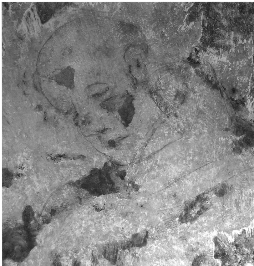
5. Sv. Ante Padovanski, detalj oslika južne naslikane niše glavnog pročelja / St. Anthony of Padua, detail of the wall-painting of the southern niche of the main facade

koji je postavljen ispod pjevališta. Godine 1754. podignuti su oltar sv. Apolonije na sjevernom i oltar sv. Florijana na južnom zidu.