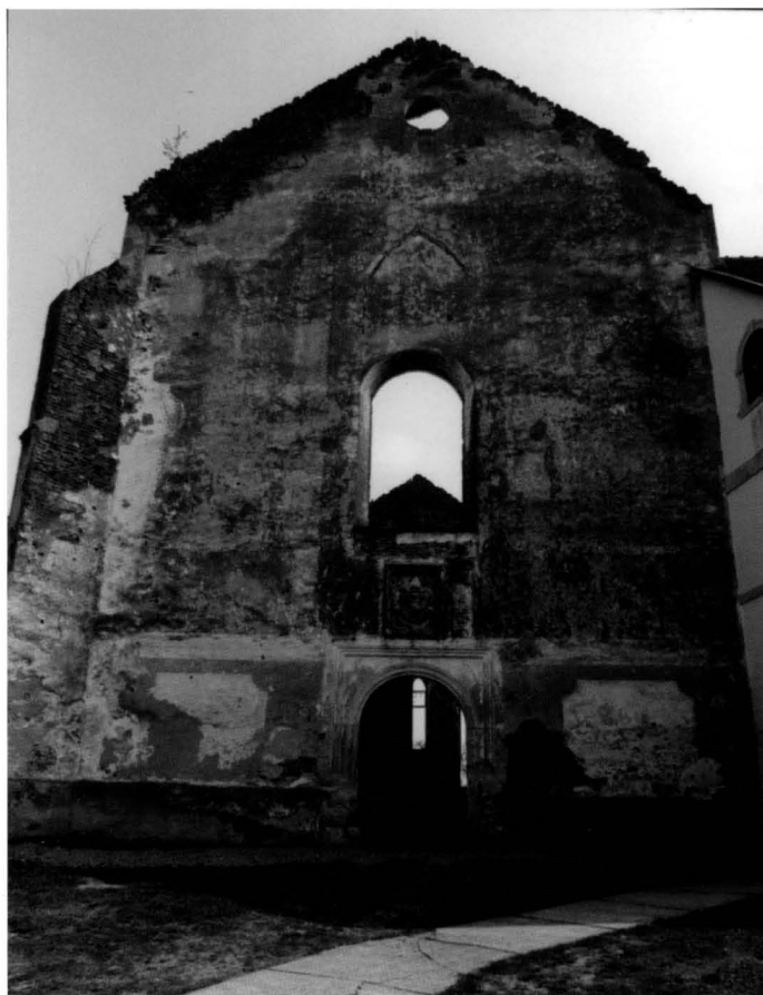
4. Stanje glavnog pročelja prije konzervatorsko-restauratorskih istraživanja / Main facade before the investigation and restoration works

veliki požar 22 pored samostana i crkve i to je prouzročilo eksploziju, a crkva je teško oštećena. Nužne popravke na samostanskoj zgradi kapetan Pettheo izveo je o svom trošku 23 ali o većem popravku crkve nema podatka. Zagrebački biskup Herešinec (1585–1588. godine) nastavio je s radovima i pokrio istočnu stranu samostana, 24 gdje su se nastanili njegovi službenici i činovnici. Temeljita obnova nastupila je tek nakon ponovne predaje crkve i samostana franjevcima 1639. godine. 25