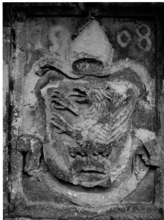
2. Grb biskupa Baratina / Coat-of-Arms of Bishop Baratin

U 16. stoljeću franjevci su napustili samostan zbog opasnosti od Turaka. Kada su Turci 1543. godine zauzeli Pakrac, 1544. Kraljevu Veliku na rijeci Ilovi, 1545. tvrđu Moslavinu i 1552. Čazmu, i samom Ivaniću zaprijetila je velika opasnost 21 i narod se povukao prema sigurnijim krajevima. Tako su pobjegli i franjevci, a samostan je ostao pust i prazan i polako se pretvarao u ruševinu. Zagrebački biskup Vuk Đulaj predao je napuštenu crkvu i samostansku zgradu zapovjedniku ivaničke tvrđe, kapetanu Pettheu koji je u samostan smjestio 50 konjanika i izbjeglice iz okolice Čazme, a u crkvu pohranio barut. Godine 1572. nehotice je izbio