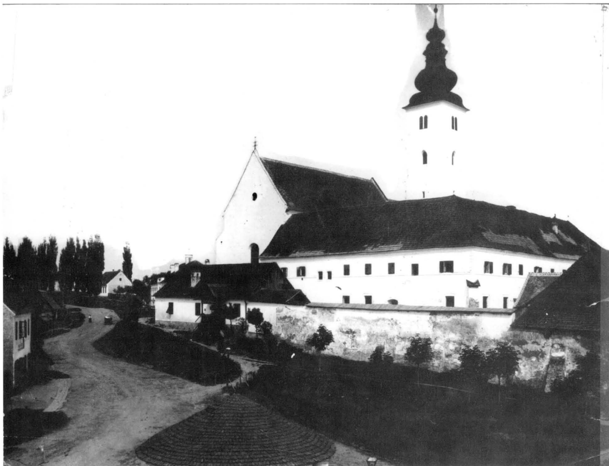
7. Stanje crkve sredinom 19. stoljeća / View of the church around the middle of the 19 th century

rješenje da se crkva upiše u Registar nepokretnih spomenika kulture kao “jednbrodna građevina s izdužnim svetištem, poligonalno završenim s desne strane kojeg stoji visoki gotički zvonik, kasnogotička, građena od opeke iz 15. stoljeća, u 17. stoljeću barokizirana” .