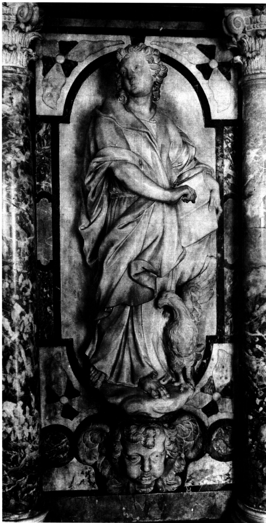
4. P. Callalo, sv. Ivan Evandelist, propovjedaonica, katedrala, Zagreb / P. Callalo, St. John the Evangelist, pulpit, Zagreb Cathedral