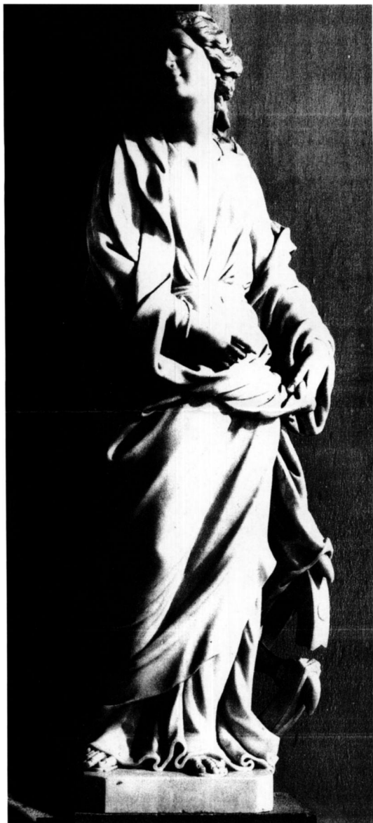
5. P. Callalo, sv. Katarina, župna crkva Hrenovice (ranije franjevačka crkva, Ljubljana) / O. Callalo. St. Catherine, Parish Church at Hrenovice (formerly the Franciscan Church in Ljubljana)