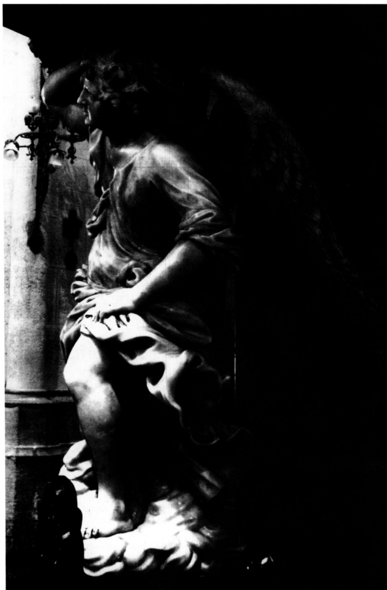
< 1. i 2. G. Piazzeta, anđeo- atlant, propovjedaonica, katedrala, Zagreb / G. Piazzeta, Atlas-angel, pulpit, Zagreb Cathedral

i širokog tijela, gotovo trbušasti, oblihi su i masivnih udova, kose razbarušene u krupne, poput jezičaca plamena uzne-mirene pramenove. Haljina od tanke, svilaste tkanine u oba andela pripijena je uz tijelo i plitko je nabrana nizom paralelnih nabora. A jednako im se prelama i rukav, zavrnut iznad lakta. Preko haljine prebačni plašt ispod pasa uvija se u spiralno ornamentiranu traku, napetu poput užeta. Bočni pogled na zagrebačkog andela s desne strane, zasjenjene stubišnim usponom na balkon propovjedaonice također otkriva sličnosti u oblikovanju plašta. U oba andela pla-