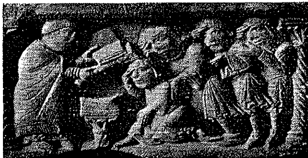
Vjernici se znamenuju s tri prsta Katedrala u Modeni, 12. st.

7 To je propis za svećenike, ali vjerujemo da su i obični vjernici činili upravo tako znak križa što nam potvrđuju i neki dokumenti iz toga vremena.