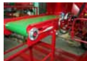
6. Transporter za kutije