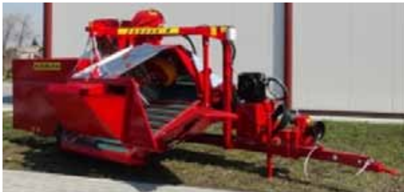
Slika 8: Suvremeni europski bočni berač

Iako je sustav opremljen modernom tehnikom i tihim hidrauličnim hodom glave za otresanje bobica, takvi su strojevi spori i imaju mali radni učinak. Kako bi se povećao radni učinak stroja, radnoj jedinici kombajna obično se priključi dodatna platforma koja može primiti nekoliko redova kutija odnosno većih boks paleta. Transportna traka visoko je namještena kako bi se omogućio centralni istovar bobica u kutije tako da su i bobice na vrhu neoštećene. Kako bi se omogućio što lakši istovar kutija, odnosno većih boks paleta, kombajn može biti dodatno opremljen valjcima za istovar i do 500 kg paleta. Također, postoje i alternativne radne platforme koje imaju prilagođenu veću nosivost od gotovo 1000 kg - takve platforme uglavnom služe za pohranjivanje bobica s dva bočna berača.