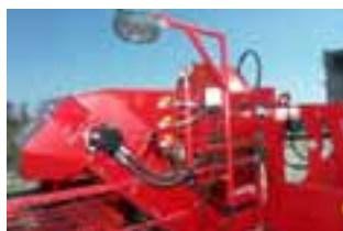
8. Radna svjetla stroja