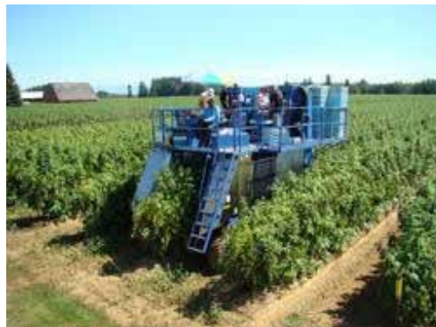
Slika 5: Samohodni berač borovnica u akciji