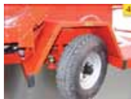
4. Hidraulička regulacija položaja stražnjeg kotača