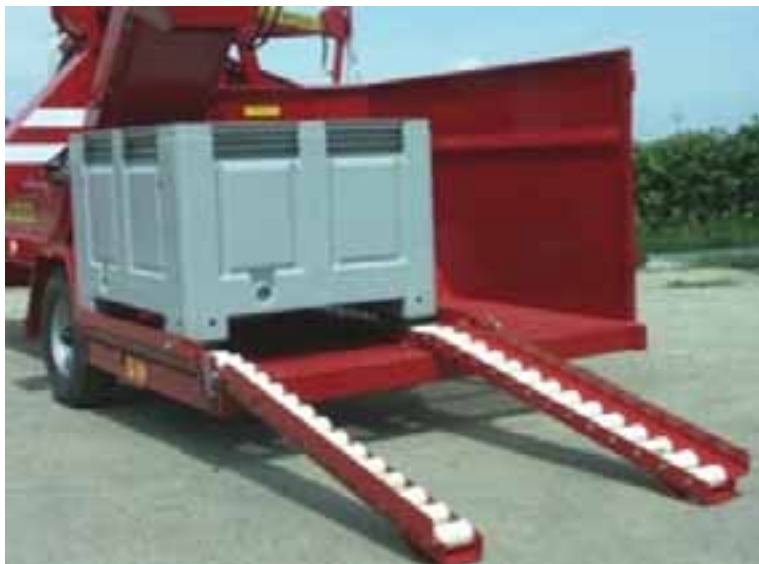
Slika 9.: Radna prikolica s boks paletom - priključena bočnom beraču

Suvremeni stroj za branje bobičastog voća lako se može prilagoditi obliku i širini grmova te zahvaljujući suvremenim tehničkim rješenjima, u stanju je obrati i plantaže s jako visokim urodom (do 20 tona bobica po hektaru). Tako velika intenzivnost berbe bobica moguća je uporabom širokog raspona funkcija za podešavanje stroja među koje se ubrajaju bestupanjsko podešavanje brzine putovanja, hidrauličko podešavanje rotacije jedinice za otresanje bobica, bestupanjsko podešavanje toka zraka ventilatora te podešavanje položaja transportera za istovar obranih bobica u kutiju.