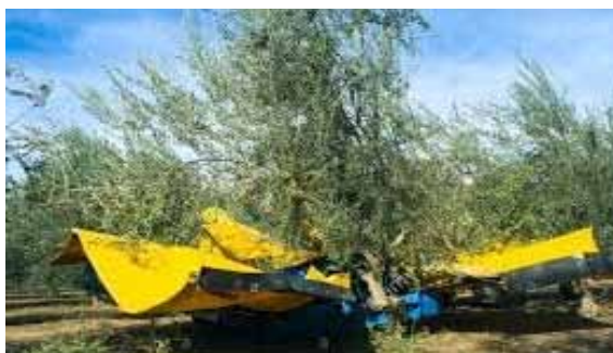
Slika 3: Berba pomoću tresenja glavnog stabla