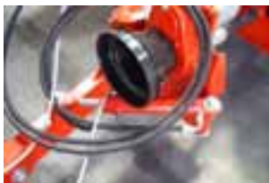
2. Hidraulička prilagodba izvlačenja položaja poluge