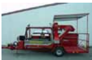
5. Krovište radne platforme