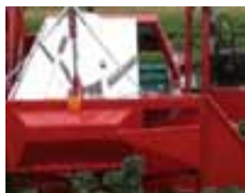
1. Dodatak za berbu niskih grmova (manje od 100 cm)

Slika 10. prikazuje nekoliko detalja dodatne opreme suvremenih strojeva za berbu bobičastog voća.