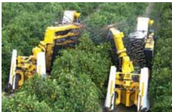
Slika 4: Tresači krošnje kod berbe naranči

Ovaj tip stroja zapravo je nadogradnja tresača stabla s uključenjem dodatnih sustava za tresenje polugama u vertikalnom smjeru kojima se upravlja pomoću hidraulično vodljive vertikalne ruke odnosno dizala. Budući da se pojedini rotori za tresenje vrte velikom brzinom i nasumice udaraju u grane, taj je način berbe vrlo neselektivan pa je pogodan jedino