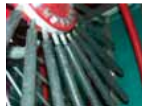
9. Drhteći štap obložen gumom

Slika 10: Dodatna oprema stroja za berbu bobičastog voća