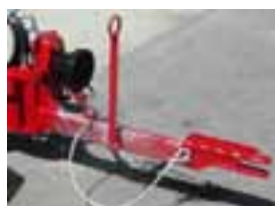
7. Vilica za vuču