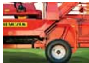
3. Podesivi kotači platforme za rad na unakrsnim padinama (od 5% do 14%)