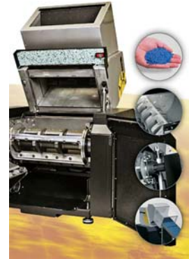
SLIKA 20. Rapidov granulator serije 500

Općenito, Rapidovi granulatori otvorena srca primjereni su za visokoučinsko granuliranje na linijama za injekcijsko prešanje, puhanje, ekstrudiranje ili izdvojeno kao središnji sustav za granuliranje. Rapidovi granulatori omogućuju postizanje jednolikih granula uz minimalan sadržaj prašine i pri granuliranju najžilavijih materijala. Optimalna geometrija noževa omogućuje granuliranje uz uporabu manje sile na noževima, što u konačnici rezultira uštedom energije.