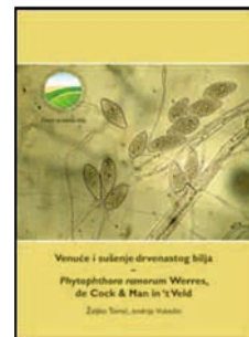
Venuće i sušenje drvenastog bilja – Phytophthora ramorum