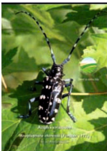
Azijska strizibuba – Anoplophora chinensis Autor: Andrija Vukadin