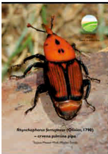
Rhynchophorus ferrugineus – crvena palmina pipa Autori: Tatjana Masten Milek, Mladen Šimala

Specijalisti Zavoda za zaštitu bilja napisali su 12 priručnika o karantenskim štetnim organizmima. Priručnici su napisani vrlo detaljno i na visokom stručnom nivou, ali isto tako i razumljivim stilom za svakog uzgajivača bilja. Pravovremenim prepoznavanjem štetnih organizama moći će se poduzeti mjere zaštite i spriječiti njihovo širenje, što je i svrha priručnika. Tiskanje priručnika omogućilo je Ministarstvo poljoprivrede. Priručnici su dostupni na internet adresi: http://www.hcphs.hr/default.aspx?id=463 . U tiskanom obliku mogu se naručiti u Zavodu za zaštitu bilja.