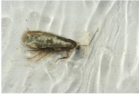
Slika 1. Leptir maslininog moljca