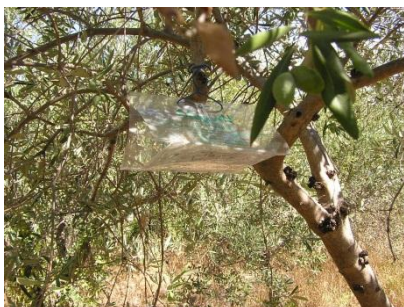
Slika 4. Feromonska klopka tipa RAG

Za uspješno suzbijanje maslininog moljca nužno je raspolagati adekvatnim metodama prognoze i signalizacije. Prognoza se provodi da bi se odredio rok suzbijanja, a signalizacija predstavlja određivanje potrebe tretiranja. Signalizacija može biti pozitivna ili negativna, a temelji se na utvrđenoj visini populacije štetnika. Prognoza se može obavljati ulovom leptira pomoću lovnih posuda s hranidbenim mamcem ili svjetlosnom svjetiljkom. Oba mamca su neselektivna te je potrebno izdvajati i identificirati ulov što zahtjeva specijalistička znanja. Otkrićem feromona za ovu vrstu razvijene su i feromonske klopke pogodne za praćenje leta leptira. Na tržištu danas postoje dva tipa klopki, prozirne tzv. delta trapovi s ljepljivim dnom (slika 4.), koje proizvođač feromona iz Mađarske naziva RAG, te klopke dizajnirane kao posudice ili tzv. VAR tip mamaca (slika 5.), u slučaju da ih proizvode mađarski proizvođači.