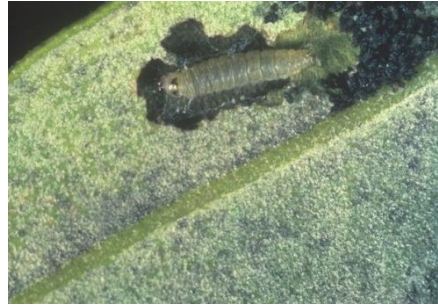
Slika 2. Gusjenica maslininog moljca (izvor: Prays oleae Bern. (snimila: E. Vitanović)

Moljac je oligofagni štetnik, osim masline, koja mu je primarna biljka domaćin, hrani se listovima filireje ( Phyllirea angustifolia L., Phyllirea latifolia L.), jasmina i ligustruma. Štete rade gusjenice koje napadaju cvijet, plod i list. Gusjenice izgrizaju cvjetove, posljedica ishrane je uništavanje cvjetova. Na plodovima gusjenice se hrane mesom plodova i izazivaju njihovu „crvljivost“. Posljedica napada je otpadanje plodova. Ishrana na lišću dovodi do pojave mina na listu (slika 3.), a u slučaju jakog napada do defolijacije.