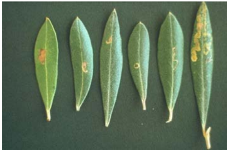
Slika 3. Listovi masline oštećeni od gusjenica

Moljac je oligofagni štetnik, osim masline, koja mu je primarna biljka domaćin, hrani se listovima filireje ( Phyllirea angustifolia L., Phyllirea latifolia L.), jasmina i ligustruma. Štete rade gusjenice koje napadaju cvijet, plod i list. Gusjenice izgrizaju cvjetove, posljedica ishrane je uništavanje cvjetova. Na plodovima gusjenice se hrane mesom plodova i izazivaju njihovu „crvljivost“. Posljedica napada je otpadanje plodova. Ishrana na lišću dovodi do pojave mina na listu (slika 3.), a u slučaju jakog napada do defolijacije.