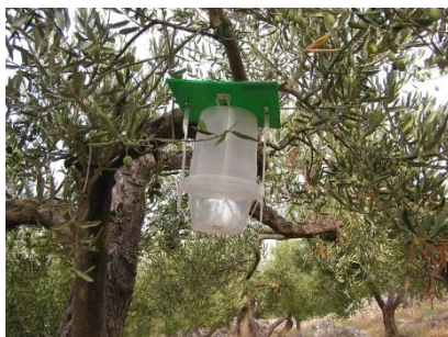
Slika 5. Feromonska klopka tipa VAR

Oba tipa mamaca pokazala su se podjednako dobra za praćenje moljca. Do danas nije razvijena mogućnost signalizacije temeljem visine ulova na feromonima budući da veliki broj čimbenika kao što su uvjeti za razvoj štetnika i biljke, različito trajanje razvoja jaja, mortalitet jaja i gusjenica zbog drugih razloga i dr., utječe na konačan razvoj šteta. Ulov na feromonima koristi se kako bi se pratio razvoj populacije i kako bi se odlučilo o trenutku kada treba početi s vizualnim pregledima. Feromoni se u nasadu postavljaju pojedinačno, osim u većim voćnjacima gdje se moraju postaviti dva mamca na minimalni razmak od 200 m. Vizualni pregledi provode se (ovisno o generaciji koja se promatra) uzimanjem uzoraka biljnih organa koji se u laboratoriju pregledavaju, te se utvrđuje broj cvjetova po izbojku, udio fertilnih cvjetova, broj gusjenica svakog stadija kao i postotni udio gusjenicama s parazitima.