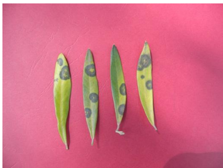
Slika 1. Simptom na listovima

Otpadanje listova može uslijediti u koliko je zaražena samo peteljka lista, a da se simptomi ne manifestiraju na plojci.