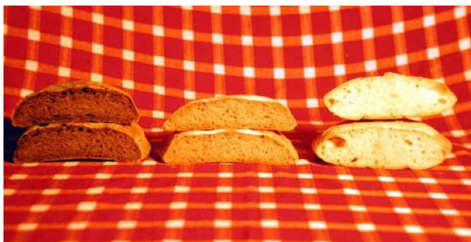
Slika 1. Kruh proizveden od brašna kontaminiranog s 10 snjetljivih zrna na 1000 zdravih (sredina), 3 snjetljiva zrna na 1000 zdravih (desno), te nekontaminiranog brašna (lijevo)

U pet županija (Osječko-baranjskoj, Vukovarsko-srijemskoj, Požeško-slavonskoj, Varaždinskoj i Međimurskoj) utvrđena je zaraza pšenice smrdljivom snijeti. To je najstarija poznata bolest, nekada uz crnu žitnu hrđu ( Puccinia graminis ), najvažnija bolest pšenice. Posljednja epifitocija smrdljive snijeti na području Sjeverne Amerike i Europe zabilježena je 1920. godine, uz gubitke u prinosu i do 80% (Cvjetković i sur., 1999). Na području RH sredinom prošloga stoljeća bili su uobičajeni gubitci 175-500 kg/ha (Potočanac i Kišpatić, 1948). Osim gubitka uroda,