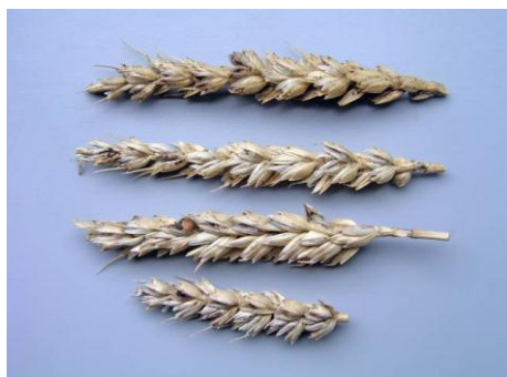
Slika 3. Simptomi smrdljive snijeti na klasovima