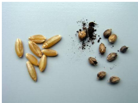
Slika 4. Zdrava i snjetljiva zrna pšenice pšenice