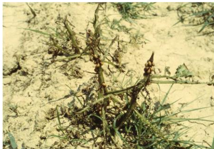
Slika 5. Ličinke krumpirove zlatice na jako oštećenju biljci krumpira

Zlatica je oligofag, hrani se krumpirom, patlidžanom i rajčicom. Štetu uzrokuju ličinke i odrasle zlatice ishranom na listu krumpira. Posljedica ishrane može biti potpuna defolijacija (slika 5.), tj. uništenje cime, što u konačnici rezultira znatnim gubitkom prinosa.