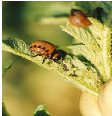
Slika 4. Ličinke krumpirove zlatice

Krumpirova zlatica ima dvije generacije godišnje (tablica 1.). Prezimi u tlu na starim krumpirištima kao odrasli oblik. U proljeće izlazi iz tla kada temperatura tla poraste na 14 °C. Odrasle prezimjele zlatice traže biljke krumpira kojima se hrane prije nego počnu kopulaciju i odlaganje jaja. U proljeće nakon izlaska iz tla kreću se hodanjem, tražeći polja pod krumpirom. Kada se temperatura povisi iznad 20 °C, zlatica počinje letjeti pa je potraga za novim poljima krumpira uspješnija. Nakon parenja zlatice odlaze jaja iz kojih za nekoliko dana izlaze ličinke koje su jako proždrljive. Jaja su odložena na donju stranu lista u skupinama, najčešće 30-70 jaja. Ličinke se nakon razvoja, koji traje dva-tri tjedna, spuštaju na tlo i kukulje u tlu.