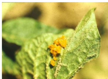
Slika 2. Odrasla krumpirova zlatica (snimio D. Bertić) Slika 3. Jaja krumpirove zlatice (snimio D. Bertić)