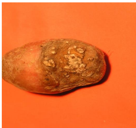
Slika 1. Suha trulež gomolja Fusarium sp.

Suha trulež gomolja jedna je od najvažnijih bolesti gomolja krumpira jer može uzrokovati velike gubitke tijekom skladištenja, ali i u razdoblju vegetacije. U SAD-u su zabilježene štete u sjemenskim usjevima do 25 %, a u skladištu može biti inficirano do 60 % gomolja (Wharton i sur., 2007). Uzočnici bolesti jesu vrste roda Fusarium : Fusarium coeruleum Lib. Ex Sacc., F. sambucinum Fückel, F. avenaceum te F. solani (Mart.) Sacc ((Wharton i sur., 2007; Ocamb i sur., 2006, Leslie i Summerell, 2006). Budući da su to stanovnici tla i paraziti rana, intenzitet suhe truleži u skladištu ovisi o mehaničkom oštećivanju gomolja