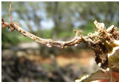
Slika 1. Jedinke P. turanicus na korijenu graška

➤ Skupljanje biljaka domaćina napadnutih štitastim ušima u plastične vrećice, označavanje