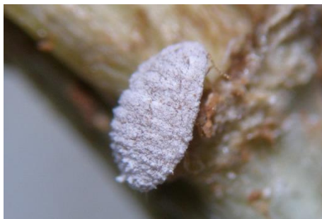
Slika 2. Ženka P. turanicus na korijenu graška

Vrsta P. turanicus široko je rasprostranjena u Palearktičkoj regiji: Armenija, Bugarska, Kreta, Gruzija, Iran, Italija, Kazahstan, Moldavija, Rusija, Tadžikistan, Turska, Ukrajina i Uzbekistan (ScaleNet, 2013). Štitaste uši štetnici su primarno na vočkama, vinovoj lozi i ukrasnom drveću i grmlju. Vrlo rijetko predstavljaju štetnike na ratarskih i povrtlarskim kulturama. Upravo je vrsta P. turanicus jedna od štitastih uši koje mogu pričinjati gospodarski važne štete na ratarskim i povrtlarskim kulturama. Do sada su u svijetu poznati njezini brojni domaćini iz 16 porodica: Asteraceae, Brassicaceae, Cistaceae, Convolvulaceae, Dipsacaceae, Euphorbiaceae, Fabaceae, Lamiaceae, Malvaceae, Poaceae, Polygonaceae, Rosaceae, Scrophulariaceae, Solanaceae, Umbelliferae i Vitaceae. Kostarab & Kozar (1988) i Danzig (2001) ukazuju da P. turanicus može imati status štetnika ako se hrani na korijenu duhana ili gomolju krumpira. Osim toga, ta vrsta hrani se i na korijenu pšenice (Danzig, 2001). Zabilježena je i na čokotu vinove loze (Pellizzari Scaltriti, 1991).