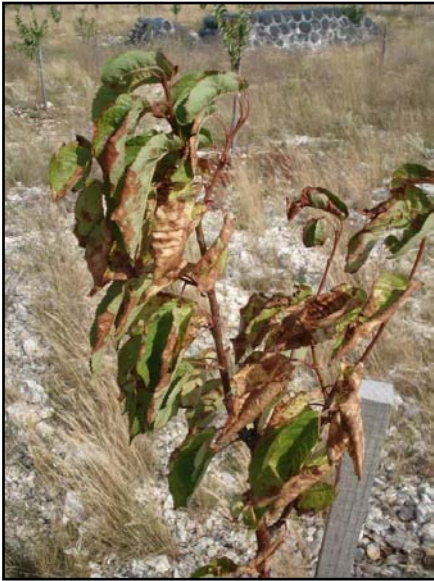
Slika 1. Crvenkasto-smeđe pjege sa žutim rubom na starim listovima zaraženima gljivom Apiognomonium erythrostroma