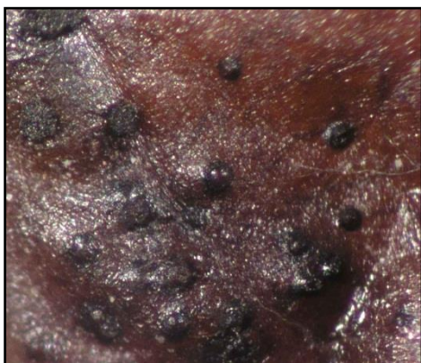
Slika 4. Izgled piknida gljive Libertinia effusa

Pregledom simptomatičnih listova pod binokularnom lupom utvrđena je prisutnost piknida, ali mikroskopskim pregledom u njima nije potvrđena prisutnost spora. Nakon dvotjedne inkubacije u Petrijevim posudama piknidi su detektirani na gotovo cijeloj površini naličja lista (slika 4.), ali je većina njih i dalje bila prazna, a samo u nekima su se razvile duguljaste, jednostanične, bezbojne piknospore (slika 5.), lagano proširene prema vrhu, dimenzija 17.1 \times 1 \mu\text{m} (prosjeck mjerenja 20 spora). Spore su prema morfologiji odgovarale gljivi Libertinia effusa (Vukovits i Wittmann, 1990), poznata kao uzročnik uvijenosti i sušenja lišća trešnje i višnje. Savršeni stadij navedene gljive, Apiognomonina erythrostoma Pers., nije nađen na dostavljenim listovima.