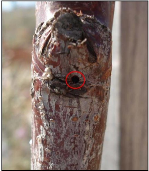
Slika 2. Otvor uz blizini pupa obično nastali kao posljedica dopunske ishrane ženki potkornjaka