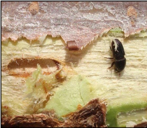
Slika 3. Mali voćni potkornjak Scolytus rugulosus

Kada se na lokalitetu Šestanovac posumnjalo na gljivično oboljenje, uzorci listova simptomatičnih stabala poslani su u Zavod za fitopatologiju Agronomskog fakulteta u Zagrebu. Nakon pregleda pod binokularnom lupom listovi su stavljeni dva tjedna na vlagu u Petrijeve posude da bi se potaknulo stvaranje sporulacijskih struktura, a one su nakon toga analizirane pod mikroskopom. S obzirom da je na više lokacija na stablima s opisanim simptomima primijećena i pojava kukaca nalik na potkornjake, sakupljene su njihove jedinice u svrhu determinacije na temelju morfoloških karakteristika (Alford, 1984., Zahradnik, 1985.) koja je obavljena na Zavodu za poljoprivrednu zoologiju Agronomskog fakulteta u Zagrebu.