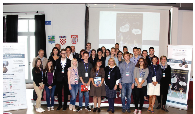
Slika 4 – Zajednička fotografija učenika i mentora s 5. Susreta mladih kemičara