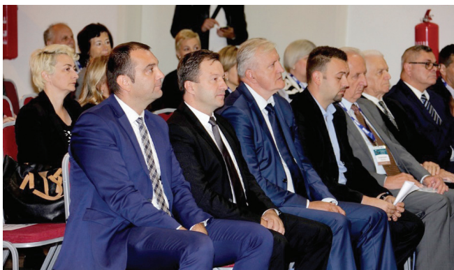
Slika 3 – Dio uzvanika s otvorenja (uzvanici navedeni u sklopu izvještaja)