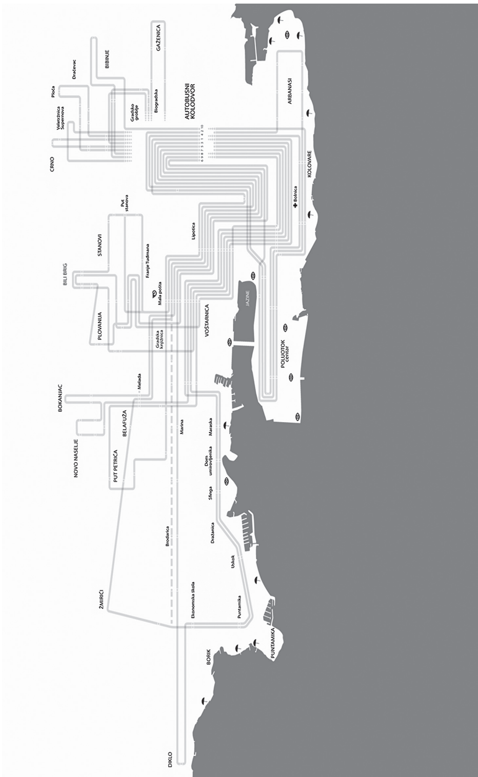
Slika 1. Mreža linija javnog gradskog prijevoza putnika Liburnija d.o.o.