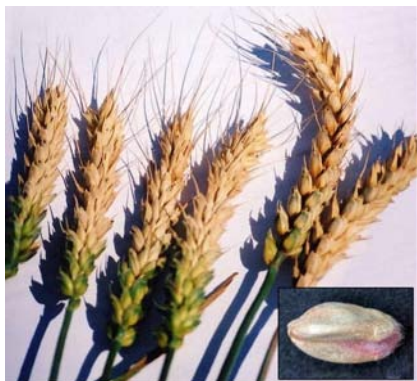
Slika 2. Palež klasa pšenice

zahvaćen čitav cvjetni klas formiraju se klasovi bez zrna. Ako infekcije nastane kasnije, zrno se formira ali bude smežurano. Na već formirana zrna mogu se naseliti spore Fusarium vrsta, što je opasnost za širenje gljive u silosu, ali su izravne štete obično male.