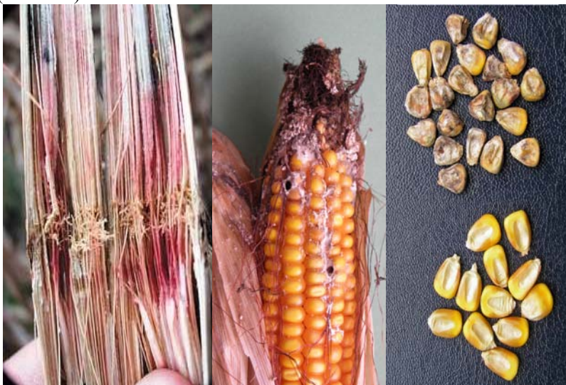
Slika 1. a) zaražena stabljika; b) zaražen klip s oštećenjem od kukuruznog moljca c) zaražena i zdrava zrna

poremećen je primitak vode i hranjiva pa lišće vene, žuti i suši se. Na mjestu zaraze stabljika se lako prelomi. Na klipu zaraza se najčešće očituje na vršnom dijelu (slika 1.b).