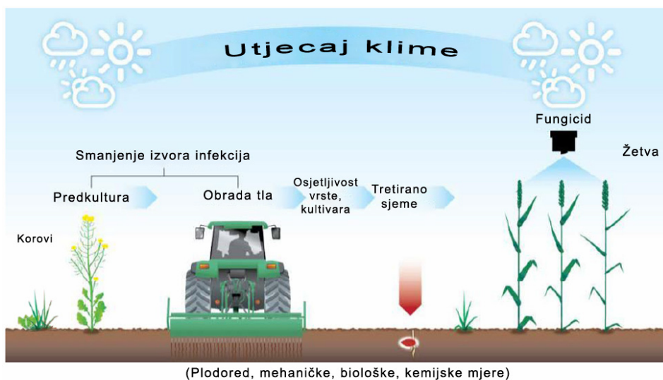
Slika 5. Preventivne mjere u biljnoj proizvodnji za smanjene mikotoksina (M. Klix-dopunjeno)

Mikotoksini mogu nastati u procesu proizvodnje hrane pa prevencija nastanka mikotoksina treba obuhvatiti cjelokupni proces proizvodnje. Biljka je živi organizam koja ima slijed vegetativnih i generativnih funkcija, što omogućava normalan razvojni ciklus biljke (sjeme, klica, cvatnja, oplodnja, plod) i održanje vrste. Čovjek treba agrotehničkim mjerama stvoriti biljci što povoljnije uvjete za rast i plodonošenje s što manje stresnih situacija posebice to vrijedi kada su pitanju mikotoksini. Primjena dobre gospodarske prakse za proizvodnju zdravoga kvalitetnoga zrna prva je mjera u smanjenju zaraza s toksinogenim gljivicama i u smanjenju mikotoksina. U sklopu dobre gospodarske prakse može se smanjiti pojava gljivičnih oboljenja kukuruza i pšenice u polju, uključujući i toksinogene gljivice.