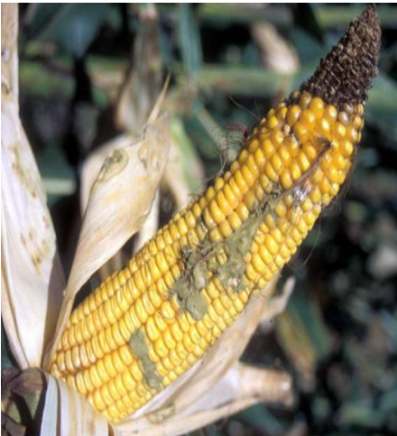
Slika 3. Simptomi na klipu kukuruza (internet)

Aspergillus flavus i Aspergillus parasiticus su toksinogene vrste premda više vrsta roda Aspergillus mogu sintetizirati aflatoksine, ali te su vrste rjeđe zastupljene ili sintetiziraju manje aflatoksina. Izravne štete od vrste A. flavus u polju male su jer je na klipu zaraženo samo nekoliko zrna. Stoga su teško uočljive zaraze zrna prostim okom u polju ili neposredno nakon berbe. U mlječnovoštanom stadiju mogu uzrokovati trulež skuteluma. Ako se pojavi micelarna prevlaka ona je sivkastožute boje (slika 3.), a može se pojaviti u uvjetima visoke vlage i temperature, oko dva mjeseca nakon svilanja. Međutim, na neadekvatno uskladištenim klipovima ili zrnju, uz povišenu vlagu zrna i više temperature dolazi do stvaranja micelija i sponosnih organa sivkastožute boje. A. flavus , A. parasiticus su pretežno se ponašaju kao saprofiti a mogu inficirati sjeme. A. flavus nalazi se u okolišu, tlu na biljnim ostatcima i životinjskim ostatcima. Prezimljuje kao micelij ili u obliku sklerocija (slika 4.).