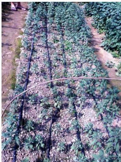
Slika 2. Bolesne krizanteme u „tunelu“, Ribnik, 2008.

Nakon prvoga nalaza slijedila su i ostala tri nalaza tijekom 2008. (Kloštar Ivanić, Pula, Stružec) te jedan u 2009. godini (Jakovlje). Simptomi su bili vrlo slični, većinom su se uočavali u plastenicima za proizvodnju rezanih krizantema, u klasičnim plastenicima ili u „tunelima“ prekrivenim plastičnom folijom i to u dijelovima gdje se zadržavala voda. U Stružecu, kraj Popovače, P.