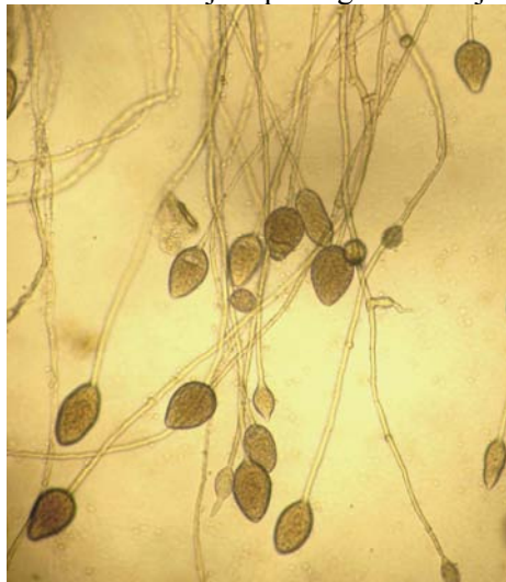
Slika 9. P. chrysanthemi – sporangiji

kao i većina ostalih Phytophthora vrsta P. chrysanthemi obilno sporulira kada se komad V8 hranjive podloge s micelijem stavi u izvorsku vodu.