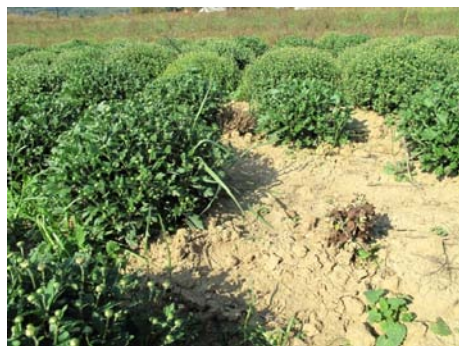
Slika 3. Sušenje multiflore, Stružec, 2008.

chrysanthem i izolirana je iz propale krizanteme - multiflore u polju (slika 3.), a u Puli je izolirana iz lončanice u plasteniku sa simptomima venuća (slika 4.).