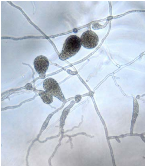
Slika 10. P. chrysanthemi – nabrekli hifa