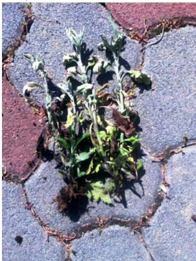
Slika 1. Karakteristični simptomi venuća P. chrysanthemi

P. chrysanthemi prvi put je izolirana u rujnu 2008. iz trulog korijena i stabljike krizanteme s područja Ribnika, u blizini Karlovca. Tijekom fitosanitarnog pregleda zamijećeno je zaostajanje u rastu i propadanje u dijelu tzv. „tunela“ za proizvodnju rezanih krizantema (slika 1.), a nakon izvlačenja bolesnih biljaka iz tla, uočeni su simptomi truleži korijena i baze stabljike karakteristični za Phytophthora vrste (slika 2.). Zaražene biljke bile su višestruko kraće od zdravih, sivkasto-zelene boje, najčešće koncentrirane u dijelu „tunela“ gdje se zadržavala voda. Donji dio stabljike poprimio je tamno smeđu boju i bio je oštro ograničen od zdravoga dijela (obilježeno strjelicom na slici 2.).