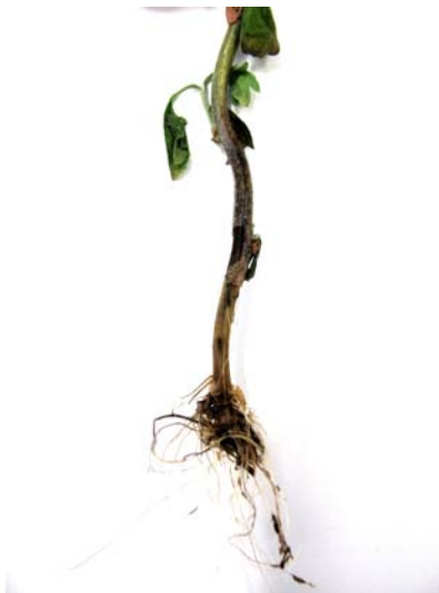
Slika 8. P. chrysanthemi - trulež korijena i donjeg dijela stabljike na umjetno zaraženoj biljci