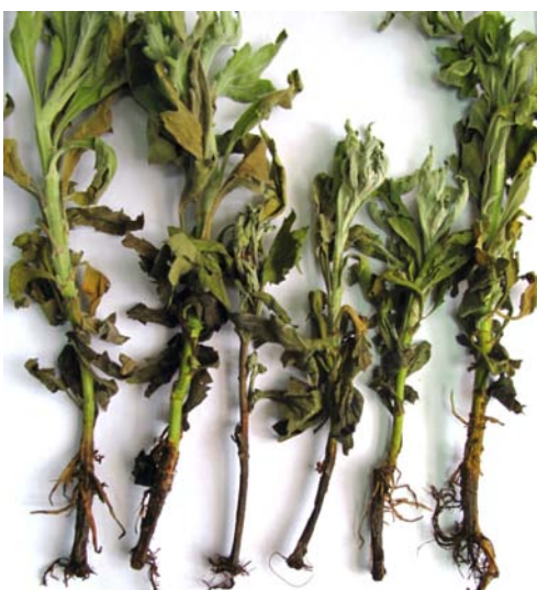
Slika 6. Trulež korijena i donjeg dijela stabljike – proizvodnja rezane krizanteme u plasteniku, Jakovlje, 2009.

Opisani simptomi lako se mogu zamijeniti simptomima uzrokovanim napadom Pythium vrsta (najčešće P. aphanidermatum ), koje su često prisutne na korijenu i, zbog brzog rasta na hranjivoj podlozi, mogu stvarati probleme pri izolaciji P. chrysanthem i .