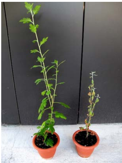
Slika 7. Umjetna zaraza presadnica krizanteme, zaražena biljka - desno, kontrola - lijevo

Znaci bolesti, istovjetni simptomima na uzorkovanim biljkama, razvili su se šest tjedana nakon umjetne infekcije suspenzijom zoospora (slika 7. i 8.), a nakon reizolacije potvrđen je uzročnik – Phytophthora chrysanthemi .