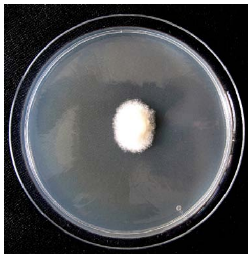
Slika 12. P. chrysanthemi – PDA, nakon 7 dana na 20 °C

- Izgled i veličina nabreklina hifa (hyphal swellings) i hlamidospora jedno je od morfoloških obilježja važnih za točnu identifikaciju vrste roda Phytophthora . Velike (do 70 \mu\text{m} ), izdužene, najčešće interkalarne nabrekli hifa vrlo su specifične za P. chrysanthemi i rijetko su prisutne u drugim Phytophthora . Često su okrugle, lančano poredane na hifama ili solitarne, slične hlamidosporama. Formiraju su se i u CPA hranjivoj podlozi i u vodi. (slika 10.). Tankostijene