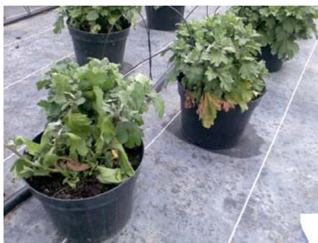
Slika 4. Propadanje krizanteme lončanice, Pula, 2008.

Na svim zaraženim biljkama vidjeli su se simptomi reduciranog rasta, jake truleži korijena i posmeđenja donjega dijela stabljike (slika 5. i 6.)