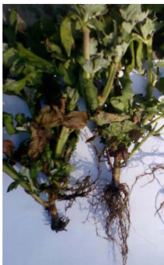
Slika 5. Trulež korijena i korienovog vrata na krizantemi iz lončanica, Pula, 2008.

Na svim zaraženim biljkama vidjeli su se simptomi reduciranog rasta, jake truleži korijena i posmeđenja donjega dijela stabljike (slika 5. i 6.)