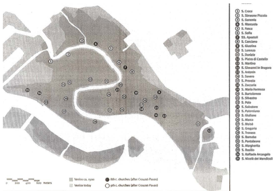
Fig. 6. Map showing the locations of the new churches built in Venice in the ninth century. The lighter symbols identify the churches that were already there in the eighth century (see figs. 3–4). After Crouzet-Pavan 1992, maps 1–2.

Ako Veneciju promatramo kao točku poveznicu između kontinentalnog i morskog prometa, kao granicu između Bizanta i Franačke, mogli bismo se zadovoljiti zaključkom kako Venecija postaje trgovački grad „ne zbog vlastite potrebe, nego zbog svoje sustavne lokacije“. 42 Dakle, kako je rečeno u 1. poglavlju – Venecija sama po sebi ne bi bila ništa.