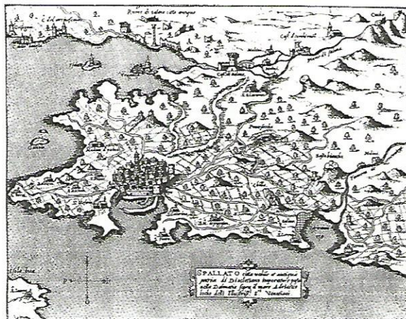
Slika 2. Veduta grada Splita u isularu F. Camoccia iz 1572. godine. 4

Grad Trogir opisuje kao lijep i dobro utvrđen grad. Kaže da je najbolje utvrđen grad u čitavoj Dalmaciji, iako ima primjedbe na održavanje obrambenih jaraka i gradskih zidina. Gradu sa sjevera nalazi se planina koja je prohodna kroz tri prijevoja. Oni se i bez artiljerije mogu lako braniti. Grad ima dosta dobre prihode od 5 288 dukata, bez carine za konje koja se daje u zakup za 836 dukata. Trogir ima i nekoliko solana koje daju malen prihod, pa Giustiniano kaže da ima potencijala za gradnju drugih i kako bi se taj prihod mogao znatno povećati.