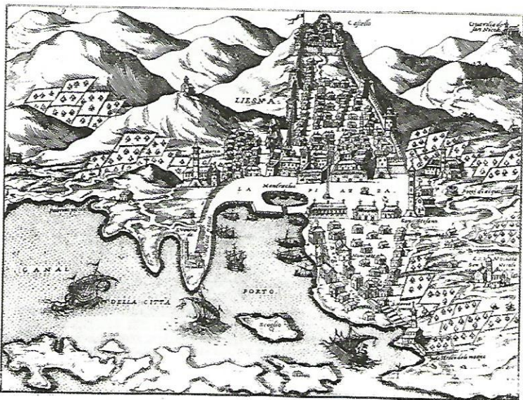
Slika 1. Veduta grada Hvara u isolaru F. Camoccia iz 1572. godine. 3

Grad Hvar nalazi se na sredini plovnog puta s Levanta prema Veneciji te u njega navraćaju mnogi brodovi. Pod njegovu jurisdikciju potpada i otok Vis koji zbog obilnih ulova srdela daje carinu u zakup za čak 4000 dukata.