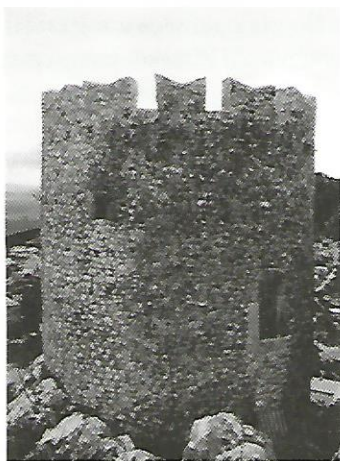
Slika 2. Cukarinovićeve kula