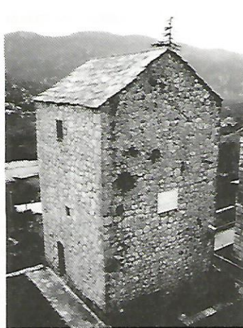
Slika 3. Kula Avala

Još prije svih prijelomnih događaja u 17. stoljeću, Vrgorska krajina bila je slabo naseljena. Uz Vrgorac, gdje su živjeli ponajviše muslimani, u krajini se tad nalazio niz slabo naseljenih sela u kojima je živjela siromašna kršćanska raja . Mnoga od tih sela vuku svoj kontinuitet do današnjih dana.