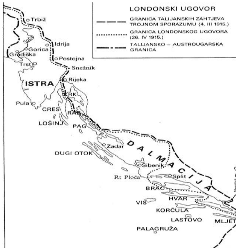
Karta br. 1 – razgraničenje utvrđeno Londonskim ugovorom