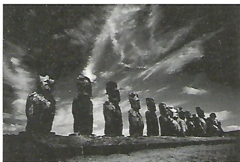
Slika 2. Moai Tongariki