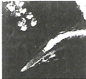
Slika 2. Napad na nosač Hiryu .

Spruance koji je bio obaviješten o novom položaju neprijateljske eskadre, smjesta je naredio napad. Eskadrila TBD Devastatora je napala u 9 h i 30 min, no ovi su avioni bili prespori za japanske lovce Zero , samo je jedan pilot preživio napad. Amerikanci nisu htjeli gubiti previše vremena, poslali su novi nalet aviona. Ovaj put su torpedne avione pratili lovci za obranu. Lovci su letjeli dosta ispred torpednih aviona, jer su trebali na sebe privući obranu japanskih lovaca. Ali američki lovci nisu naišli na nikakvu obranu, te su javili torpednim avionima da krenu u napad. Bila je to kobna pogreška. Za nekoliko minuta koliko je bilo potrebno torpednim avionima da dolete do japanskih brodova, japanci su podigli svoje lovce u zrak, te su napadači ponovno odbijeni i uništeni. Od 14 aviona, ovaj put se uspjelo spasiti njih 4. Nekoliko minuta kasnije došla je nova eskadrila torpednih aviona, njih 13, praćenih sa 16 lovaca sa Yorktowna . Cilj je bio nosač Akagi . Uspjeh je bio kao i kod prethodnih eskadrila, nikakav.