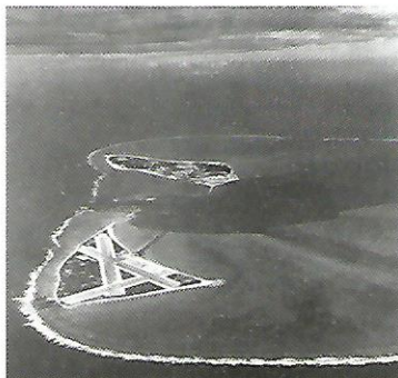
Slika 1. Zračni snimak Midway iz 1941. godine

23° 13' N i 177° 23' W - Kružni atol u srednjem dijelu Pacifika, oko 2100 km SZ od Honolulua. Zatvara plitku lagunu sa dva otoka, Sand Island i Eastern Island. Pripada teritoriju SAD. Na kopnenu površinu otpada 5 km 2 . Otoci se nalaze u južnom dijelu lagune. Atol je 1859. godine otkrio kapetan Brooks, a SAD su zaposjele atol 1867. godine. Od 1903. godine Midway se nalazi pod upravom RM SAD, a od 1905. godine na otoku Sand island nalazi se postaja za transpacifički podmorski kabel, koji spaja San Francisco s Manilom. Od 1936. godine na otoku postoji aerodrom koji je služio za transpacifički promet, pa je Midway zbog aerodroma i postao važna strateška baza u II. svjetskom ratu.