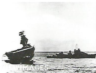
Slika 8. Posljednja fotografija Yorktowna .

Kasno poslije podne prestali su zračni napadi. Yorktown je ostao plutati na moru, te se pokušalo spasiti brod tegljenjem do Midwaya. Razarač Hamman vezao je čeličnim užetom nosač, te ga počeo tegliti. No brzina je bila mala, jer je nosač još uvijek usprkos svim pokušajima da bude ispravljen ostao nagnut. Ujutro 6. lipnja brodove je pronašla japanska podmornica I-168 . ispalila je četiri torpeda, dva su pogodila razarač, a druga dva Yorktown . Razarač je potonuo nedugo nakon pogodaka, dok se Yorktown održao na površini do slijedećeg jutra, kada je i on potonuo.