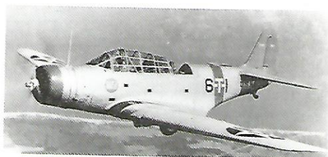
Slika 3. TBD Devastator .

Od ukupno 41 Devastatora koji su sudjelovali u napadima samo 4 su preživjela. Pokazalo se da ovi već zastarjeli avioni nisu bili dorasli japanskim Zeroima , niti njihova brzina, koja je iznosila max. 370 km/h, niti njihove manevarske sposobnosti, kao i oklop aviona.