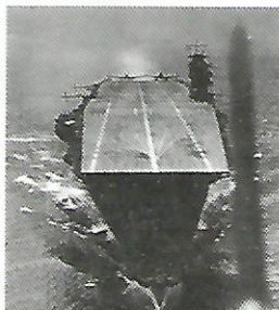
Slika 5. Nosač aviona Akagi .

Nagumo nije htio čekati, shvatio je težinu čitave situacije, te je naredio da se sa preostalog nosača aviona napadne nosač Yorktown . Već u 11 sati su poletjeli avioni. Ukupno 18 bombardera i 6 lovaca za zaštitu, te u 12 h i 45 min 10 torpednih aviona praćenih sa 6 lovaca. Yorktown se našao u istoj situaciji kao i japanski nosači u prethodnom napadu. Avioni koji su sudjelovali u napadu upravo su se vraćali i spuštali na palubu. U zraku se nalazilo samo 12 lovaca za zaštitu. Udaljenost između flotnih sastava Japana i SAD smanjila se na samo 80 Nm, te su japanski avioni lako pronašli Yorktown i usmjerili svoj napad na taj brod.