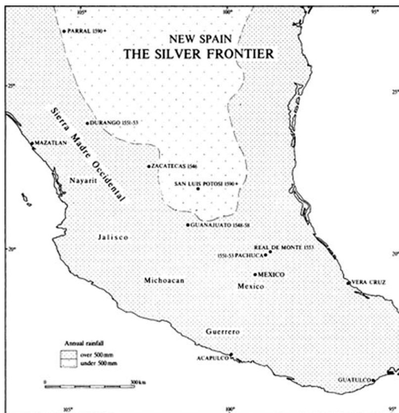
Slika 5. Rudnici srebra na teritoriju Nove Španjolske u 16. st.

put premija (tzv. partido ), ovisno o proizvodnji. Međutim, unutar tog zatvorenog svijeta rudara i gazde i radnici bili su rasipnici i kockari koji su neracionalno trošili svoju visoku zaradu. Između Španjolske i Portugala uspostavlja se direktna trgovačka veza pa se španjolske plemenite kovine iz Amerike koriste za plaćanje portugalskih začina. 531 Stoga je potrebno naglasiti kako je širenje trgovine između Europe i Istoka, koja odnosi plemenite metale, omogućeno njihovim otkrićem i eksploatacijom u Americi. Španjolske kolonije bile su zatvorene za neke europske narode kao i pripadnike drugih vjera. 532