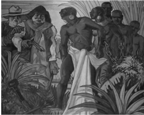
Slika 7. Afričko roblje

Portugalski je dvor, naposljetku isto poput španjolskog, počeo davati monopol na trgovinu pojedincima, zadržavajući kontrolu nad plemenitim metalima, začinicima i trgovačkom flotom. Isto tako, Portugalci nisu uspjeli iskoristiti priljev velikih količina zlata i srebra i time svoje kolonije pretvoriti u izvor trajne ekonomske premoći nad drugim europskim zemljama. Orijehtacijom najvećeg dijela gospodarskih resursa prema trgovini bila je zanemarena poljoprivreda što se u razdoblju revolucije cijena negativno odrazilo na portugalsko gospodarstvo.