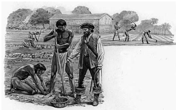
Slika 2. Španjolski sustav encomiende