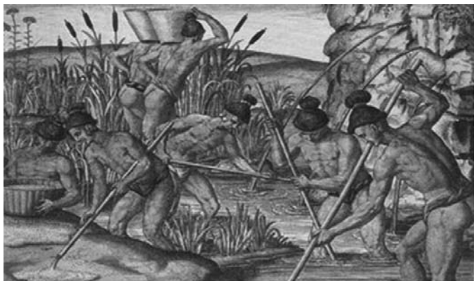
Slika 4. Indijanci u traganju za zlatom

Glavno sredstvo španjolske trgovačke razmjene postale su plemenite kovine zlata, a kasnije i srebra. Kao što je poznato zlato je najprije otkriveno na Hispanioli, Kubi i Portoriku, a njegova eksploatacija u početku je bila brza i laka, budući da se nalazilo na površini, u jamama i nanosima rijeka, a k tome je još doprinosila i jeftina radna snaga Indijanaca. 529