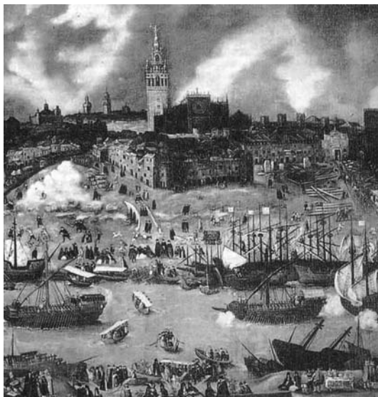
Slika 3. Casa de Contratacion u Sevilli

Otkrićem većih količina zlata i srebra počinje se intenzivnije razvijati španjolska trgovina s Novim svijetom. Kao što je istaknuto, već 1503. g. u Sevilli je utemeljena Casa de Contratacion (Kuća za promet) koja je postala veoma značajna nakon osvajanja Meksika. 526 Njezine glavne zadaće bile su „organizirati trgovinu i iskrcaj brodova, proširivati ovlaštenja, ubirati poreze na robu, biti opća arhiva za Ameriku i američke poslove, biti škola za kartografiju i pomorsko obrazovanje.“ 527