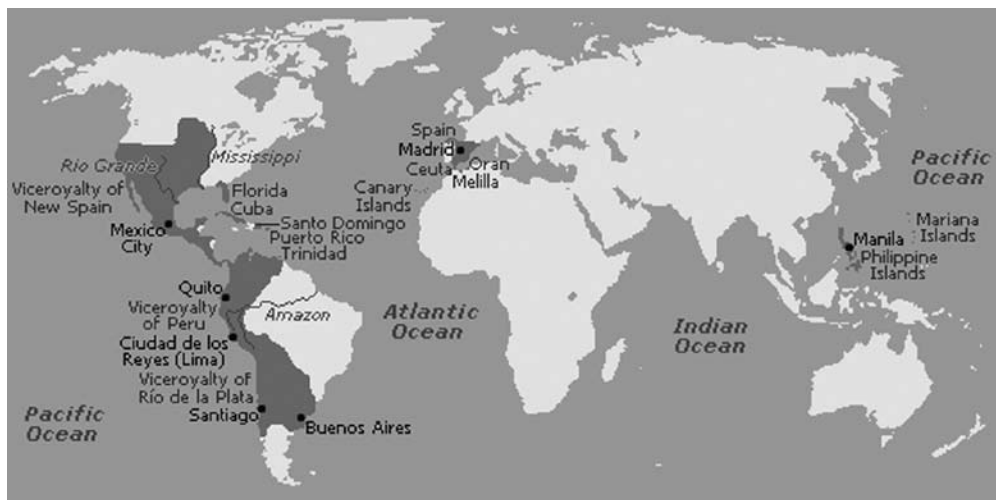
Slika 1. Španjolska potkraljevstva u Zapadnim Indijama

Kako bi smirila sukobe među osvajačima španjolska je vlada 1535. g. donijela odluku o „podjeli osvojenog područja na dva dijela i to Potkraljevstvo Novu Španjolsku koje je obuhvaćalo sadašnji Meksiko i Srednju Ameriku, te Potkraljevstvo Novu Kastiliju (Potkraljevstvo Peru) koje se prostiralo na području Perua i Anda sve do granica današnje Argentine.“ 479 U Americi je ustvari uspostavljena ista ona pravno-politička organizacija koja je već postojala u Španjolskoj. Španjolski avanturisti koji su krenuli u Novi svijet smatrali su se poduzetnicima u novoosvojenim prostorima. Te su osobe kao vanjski agenti tzv. adelantados (tj. izvan domene koja je bila pod izravnom vlašću krune) po imenu i funkcijama bili analogni generalnim guvernerima koje su kraljevi slali u netom osvojena područja, kao npr. nakon rekonkviste na iberском tlu. 480 Osvajanja na američkom kontinentu službeno su završila sredinom 16. st., u vrijeme donošenja kraljevskih odredbi iz 1556. g. Otada pa nadalje Amerika više nije bila zemlja za osvajanje, već se njome nastojalo vladati prema pravilima države. 481