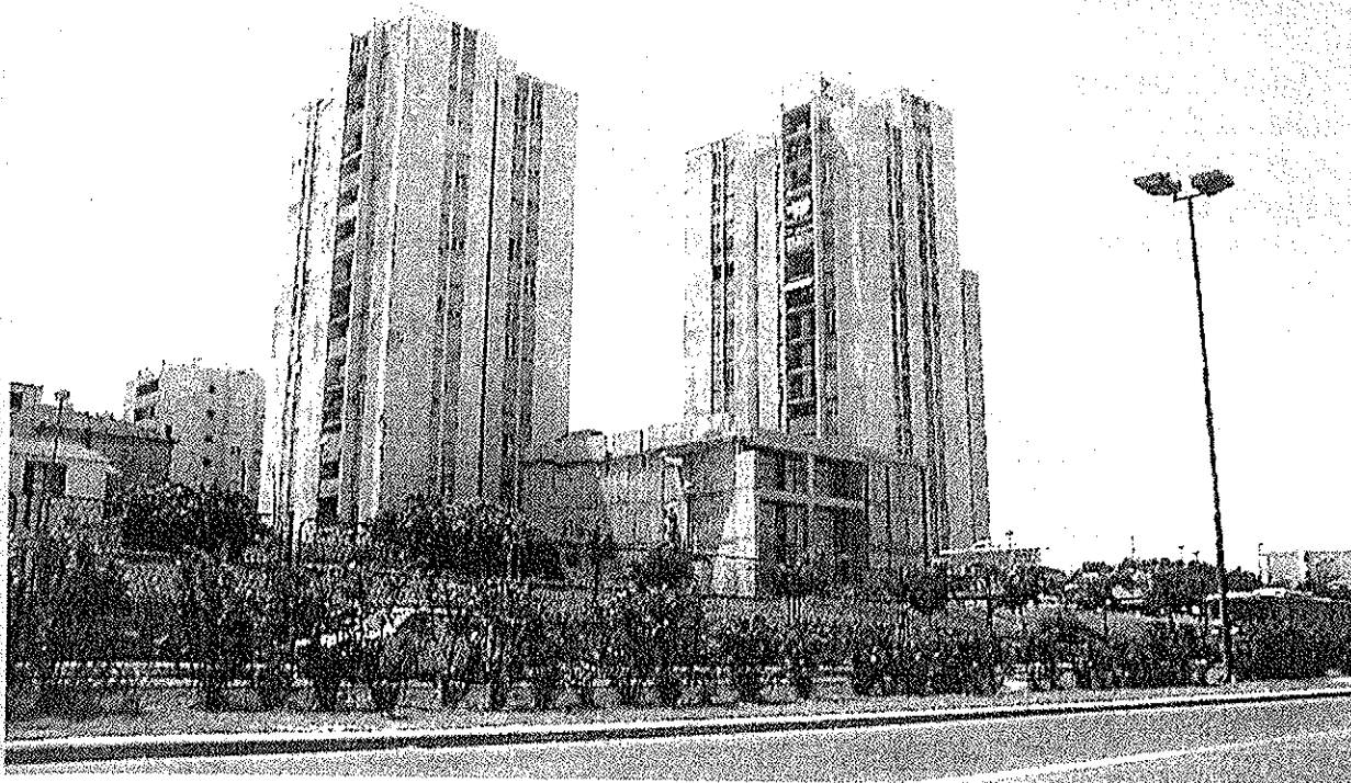
4. Crkva sv. Luke Evand., Kocunar, Split.