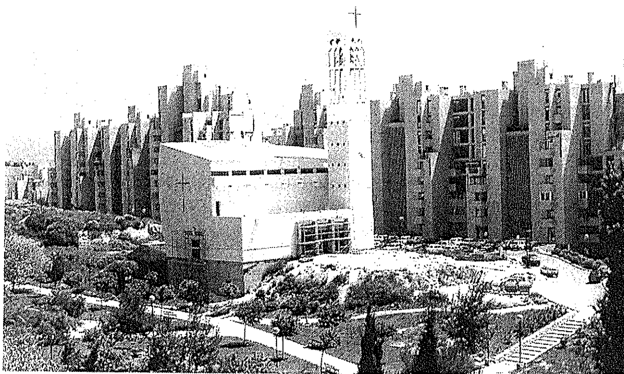
2. Crkva sv. Josipa, Mertojak, Split.