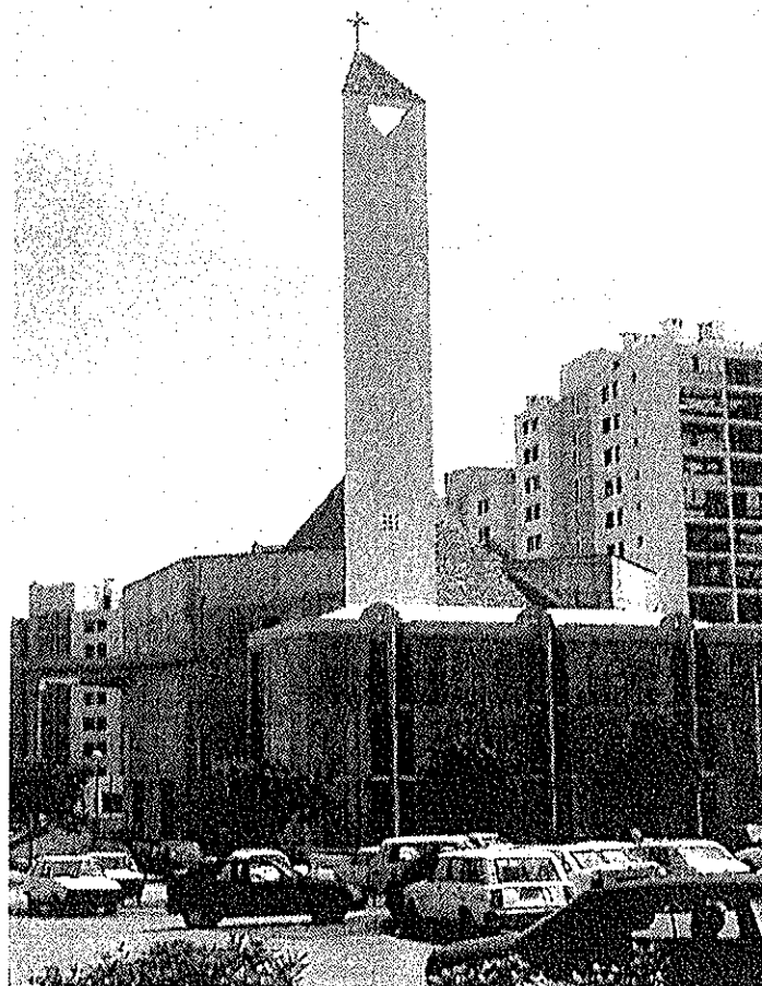
1. Crkva sv. Petra, Pujanke, Split.

žele se nametati impresivnim volumenima i forsiranom arhitekturom. Drugi se unatoč zatečenim prostornim datostima priklanjaju konceptu crkvene građevine kao dominantnog prostornog repera – crkve kao centralne građevine čitava naselja. Takav odabir za razrješenje prostornih odnosa, pa i arhitektonski izraz tu često taštini mnogo tradicijskog ovakve ili onakve provenijencije.