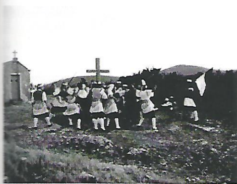
Slika 2. Rekonstrukcija bitke na Giči