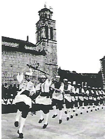
Slika 4. Viteški ples

O tome najbolje govori članak 39. Pravilnika, koji glasi: "Kako bi se pobudilo natjecanje među kapitanima za što bolje izvođenje Kumpanjije, te da bi se starije kapitane zadržalo što dulje među vojskom, vojvoda će svake godine ponuditi izvođenje najstarijim kapitanima jubilarcima." 9 Kapitan jubilarac je tim činom iznimno počašćen, ali ipak prepušta igru mlađem kapitanu.