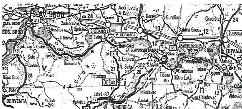
Karta 1. Odžačka Posavina

O toj temi jako se malo pisalo do sada. U režimu koji su stvorili partizani nje se nije bilo mudro doticati, čak ni kad se lažiralo povijesne činjenice ili kad se slavio dan tzv. oslobođenja Odžaka 14. travnja. Partizani u ovaj kraj konačno ulaze tek četrdesetak dana poslije, dakle i taj događaj postao je stvar pobjedničkoga prekrajanja povijesti. Upravo zbog toga, a poučeni primjerima kojim je Narodnooslobodilačka vlast dala do znanja da je o događajima iz travnja i svibnja 1945. u Odžaku i okolici najzahvalnije uopće ne govoriti, ova tema namijenjena je širim slojevima te užoj publici i struci kojoj je do danas ostala uglavnom nepoznata. Istraživalo se jako malo, a rijetka su istraživanja poput onog koje je proveo Marko Babić, a kojim se na temelju metoda tzv. oralne historije, pokušalo od zaborava ukrasti činjenice i događaje kojih se rijetki preživjeli još sjećaju.