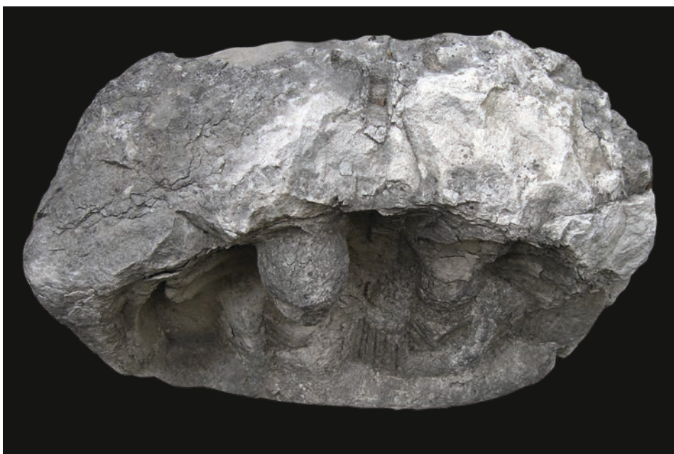
Slika 6 Pogled na instalaciju za središnji akroterij stele