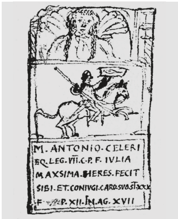
Slika 9 Crtež stele iz Državnoga arhiva u Torinu (obradio Dražen Maršić)

Zadnji primjerak ove tipološke varijante je stela M. Pithe (lat. M. Pytha ), vojnika 2. kohorte Kiresta i njegova oslobođenika Feliksa otkrivena u Gornjim Rakićanima kod Garduna (sl. 11, br. 4). 38 Kronološki najmlađom jasno je predstavljaju modne i stilske karakteristike portreta - napose vlasnika stele M. Pithe koji oblikom glave i kratkom kosom oponaša Vespazijana - te produljeni polufiguralni format u kojemu su pokojnici prikazani, inače atipičan za julijevsko-klaudijevsko razdoblje. Uzevši u obzir sve navedene elemente i podatak da je Pita bio aktivni vojnik sve do smrti u 60. godini života, stelu čini se valja datirati u ranije flavijevsko doba. Nabrojene