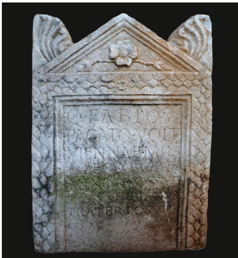
Slika 12 Salonitanska stela Q Fabija Pakata