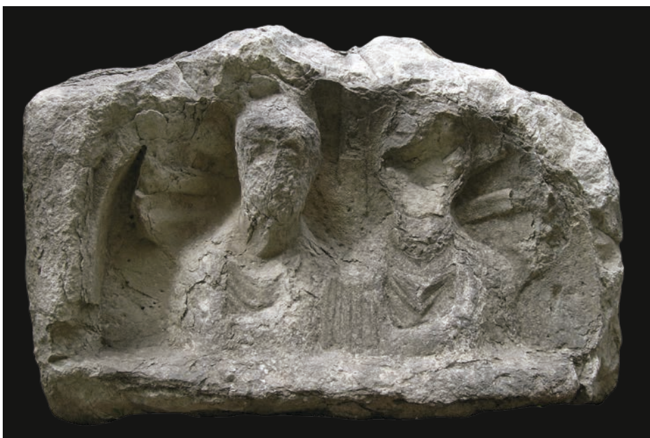
Slika 4 Gornji dio stele godine 2015.