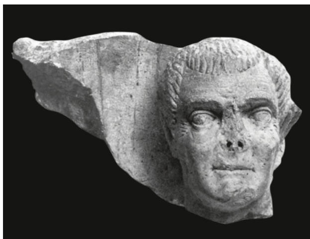
Slika 8 Fragment salonitanske stele s glavom starijeg muškarca (po APJ, 1988)

zadržavao klasično ustrojstvo. Naprotiv, kod stela kojima je funkcija bila ponijeti i portrete pokojnika u dva supraponirana polja ili pak samo jedan portret kod manjih primjeraka, takvom se koncepcijom omogućavao reprezentativniji okvir za prikazivanje pokojnika, ali uz značajnu redukciju visine ploče, a time i uštedu materijala i broja sati potrebnih za izradu.