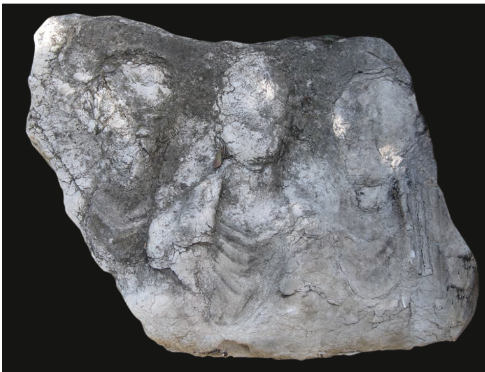
Slika 5 Donji dio stele godine 2012.