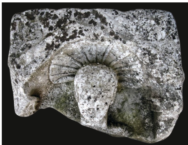
Slika 7 Fragment stele iz Muzeja Cetinske krajine