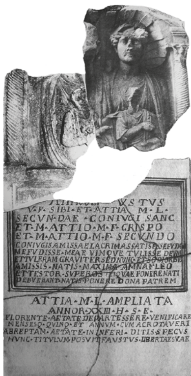
Slika 10 Rekonstrukcija salonitanske stele obitelji Attius (Dražen Maršić)