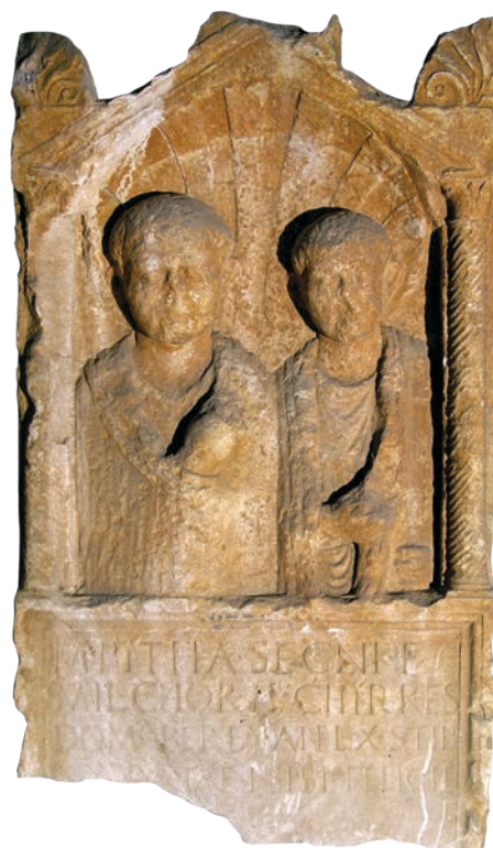
Slika 11 Stela M. Pithe iz G. Rakićana kod Garduna

Susrećemo je samo na znamenitoj Timasionovoj steli iz Ise, no ona definitivno nema ništa zajedničko s kasnijim rimskim stelama (usp. npr. okomito kanelirane stupove, eolske kapitele i dorske metope). 40 Srednjohelenističke i kasnohelenističke stele iz naših krajeva također uopće ne poznaju uporabu prekinutog zabata. U svim izvedenicama, a to je obično ona s profiliranim trokutnim zabatom i ravnim i neraščlanjenim tijelom, takve stele imaju arhitrav, bilo da je on jasno prikazan (Issa, Salona, Budva) ili se njegova prisutnost podrazumijeva (Pharos). 41 Prema tome, moguć je samo jedan zaključak: prekinuti zabat s umetnutom nišom i školjkom uveden je kao značajna inovacija na samom početku formiranja provincijalnoga stila. Kako je rimska Dalmacija najjače pomorske, gospodarske i druge