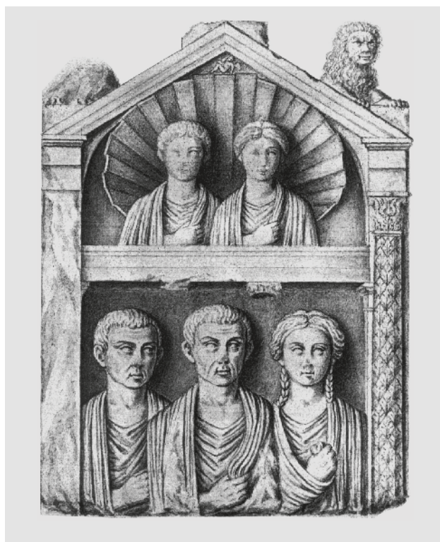
Slika 2 Stela iz istraživanja K. Lanze u crtežu R. Martinija

Razlog zbog kojega ovaj nalaz privlači pozornost znanstvene javnosti krije se u činjenici da postoji i drugi, znatno kvalitetniji crtež stele (sl. 2), koji se čuva u Arheološkome muzeju u Splitu. 6 Izradio ga je dubrovački slikar Nikola Rafael Martini (1771. - 1846.), jedan od najpoznatijih predstavnika klasicističkoga slikarstva u Dalmaciji i priznati portretist svoga vremena. 7 Martini je od 1821. do 1839. radio u Arheološkome muzeju u Splitu, gdje ga je K. Lanza imenovao za nadzornika (podinspektora) solinskih ruševina. U Muzeju je obavljao raznovrsne poslove, od otvaranja zgrade posjetiteljima, preko zahtjevnih poslova konzervacije, do izrade dokumentacije. Godine 1839. obolio je od neke očne bolesti, nakon čega se povukao u rodni grad i nakon nekoliko godina umro. Među glavnim odlikama njegova stila navode se čvrsti klasicistički crtež, izrazita i oštra individualizacija likova, zanimanje za psihološku karakterizaciju i napose istančanost