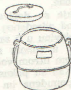
Posuda za odlaganje fekalija