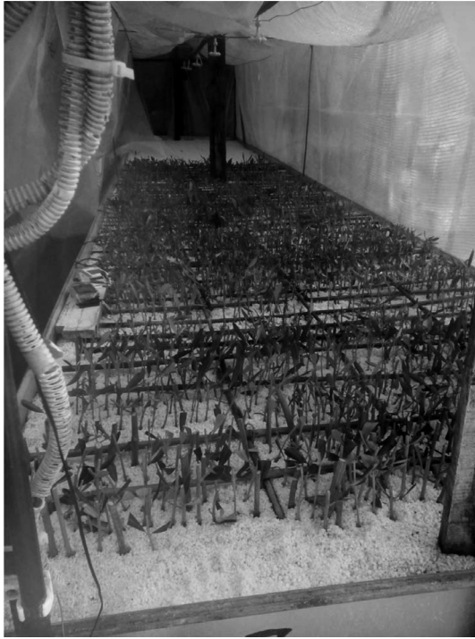
Slika 2.1. Ožiljavanje autohtonih sorata maslina u množarniku Zavoda za mediteranske kulture Sveučilišta u Dubrovniku

U razdoblju od 24. do 30. rujna 2015. s odabranih stabala uzimani su prošlogodišnji izboji duljine od 50 – 70 cm, promjera 6 – 8 mm, zatim su vezivani u snopove i omotani vlažnom tkaninom radi očuvanja vlage. Svaki je snop označen etiketom s imenom sorte i dopremljen je u množarnik i izrezan u reznice koje su isti dan postavljene u supstrat. Reznice su se uzimale iz središnjeg dijela izboja pa su od svakog izboja dobivene 2 – 3 reznice. Rez na gornjem dijelu reznice bio je ukošen suprotno strani pupa. Bazalni dio reznice ostao je ravan. Rezovi su napravljeni iznad i ispod nodija. Reznice su tretirane fungicidima aktivne tvari karbadazina radi preventivne zaštite od gljivičnih bolesti koje se pojavljuju tijekom procesa ukorjenjivanja masline. Poslije su tretirane fitohormonom za ožiljavanje u trajanju od 3 do 4 sekunde po duljini reznice od 1,5 cm. Fitohormon IBA pripremljen je u obliku alkoholne otopine, i to u četiri koncentracije (2 000, 3 000, 4 000 i 5 000 ppm). Reznice su svih istraživanih sorata tretirane sa sve četiri koncentracije hormona, i to je u svakom tretmanu bilo 20 – 50 reznica (tablica 2.1.). Poradi održavanja povoljnih uvjeta temperature i vlage zraka, stol s reznicama bio je zatvoren PVC folijom. Temperatura je supstrata održavana na 21 – 25 °C i prostora 23 – 28 °C, a relativna je vlažnost zraka u prosjeku bila 92 %-tna. Svi podatci bilježeni su digitalnim uređajima za mjerenje temperature i vlage zraka i temperature supstrata proizvođača Testo. Nakon