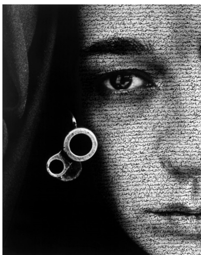
Slika 4. Shirin Neshat, Speechless , 1996. Fotografija iz ciklusa Women of Allah

ženi koju počinitelji nasilja koriste kao svojevrsan paravan/štit? Ovo pitanje posebno se nameće u odnosu na rad Speechless (1996). Fotografija, na kojoj je prikazan portret tradicionalno odjevene žene sa Srednjeg istoka, komponirana je tako da je u njenom gotovo samom centru prikazan vrh puščane cijevi, direktno usmjeren k promatraču. Pišući o ovoj fotografiji, Khosravi primjećuje da ostaje nejasno odakle je cijev usmjerena? Tko drži oružje? Je li ova žena zloupotrebljena kao paravan izvršitelju nasilja? Je li na to prinuđena, odnosno, je li i sama taoc nasilja? (Khosravi, 2011:23).