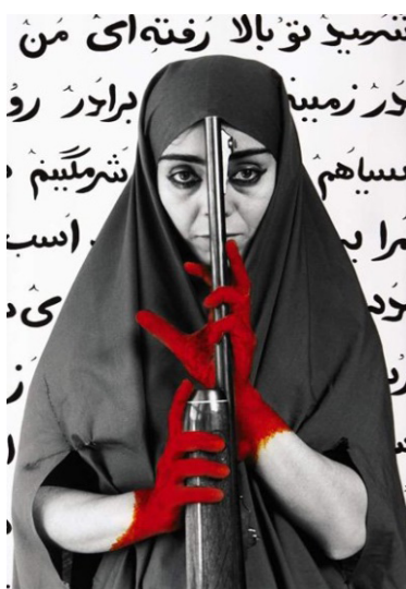
Slika 1. Shirin Neshat, Seeking Martyrdom (Verzija 1), 1995. Fotografija iz ciklusa Women of Allah

Ipak, čini se da koji god od navedenih pristupa prihvatimo, primijenjena arheologija prikazivanja u ciklusu Women of Allah , izmiče tlo postavljenoj interpretaciji. Kako bismo ovaj proces bolje razumjeli, neophodno je podrobnije sagledati smjernice koje sudjeluju u produkciji značenja fotografija. Iako ove smjernice variraju u ovisnosti od fotografije, što u pojavljivanju, što u načinu realizacije, one bi na nivou fotografskog ciklusa mogle biti grupirane u okviru nekoliko elemenata. Za njihovo bliže sagledavanje može poslužiti fotografija Seeking Martyrdom . Na fotografiji je prikazan insceniran autoportret Shirin Neshat, kao muslimanke sa Srednjeg istoka, kako u čadoru, blago pognute glave prema naprijed, upućuje direktan pogled promatraču, dok rukama obojenim u crveno pridržava puščanu cijev. Simbolika prizora posebno je ojačana svedenošću fotografije, kojom je dodatno naglašena snaga motiva. Smještena u dvodimenzionalni prostor, figura zahvaća tri četvrtine polja, ostavljajući nezaklonjenim još jedino fragmente teksta, ispisanog crnim slovima na bijeloj pozadini. Na ovom primjeru, kao osnovne elemente fotografije koji sudjeluju u usmjeravanju interpretacije, izdvojiti ćemo: muslimanka u čadoru, oružje i tekst ispisan arapskim pismom. 138 Naredni korak pretpostavlja da svakom od ovih elemenata posvetimo našu pažnju.