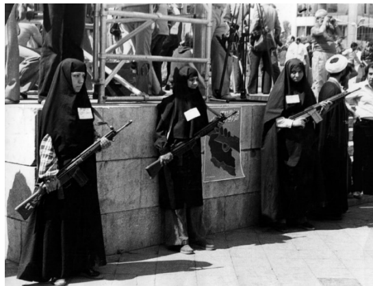
Slika 3. Fotografija naoružanih žena – stražara, na jednom od glavnih trgova u Teheranu, u vrijeme početka Iranske revolucije.

I u slučaju prikaza oružja, prepoznajemo izraženu mogućnost povezivanja fotografija sa značenjskim okvirima postavljenim unutar medijskog izvještavanja o revolucionarnim događajima u Iranu. Medijske snimke naoružanih žena u čadoru, koje se suprotstavljaju prozapadnoj politici šaha Pahlavija, korišteni kako u zapadnim tako i u iranskim medijima, učvršćivani su unutar medijskog diskursa kao označitelji oružanog suprotstavljanja zapadnom sustavu vrijednosti. Time i svaki prikaz tradicionalno odjevene žene sa Srednjeg istoka kako nosi oružje, protumačen na ovom nivou, postaje pokazatelj prijetećeg i neprijateljskog Drugog . Khosravi primjećuje da njena crna odjeća, sagledana s pozicije Zapada, prikriva njeno tijelo, njene pokrete, ali vrlo moguće i oružje (Khosravi, 2011:22). I ovdje, snažan poticaj povezivanju medijski posredovanih i interpretiranih snimaka, i konstruiranog umjetničkog prikaza, daje upotreba fotografskog medija. Na taj način, omogućen je naročit realizam , kojeg Said prepoznaje kao bitnu odliku zapadnih pristupa u prikazivanju Orijenta.