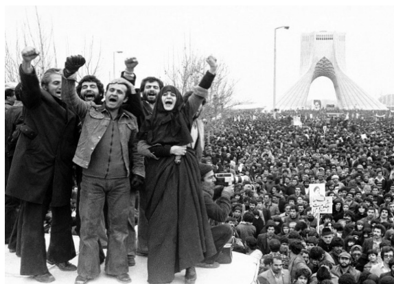
Slika 2. Više od milijun pristalica Islamske republike okupljenih oko Shayad spomenika u Teheranu.

Uspostavljeni interpretativni okviri, zahvaljujući intenzivnim medijskim izvještajima, što od strane zapadnih, što od strane iranskih medija te podržani iranskim propagandnim plakatima na kojima je prikaz žene u čadoru korišten kao simbol revolucije i otpora prema Zapadu, kao i zahvaljujući kasnijim oslanjanjem u medijskom izvještavanju na izgrađene modele prikazivanja, zadržali su svoj utjecaj na Zapadu i u narednim desetljećima. Otuda prikaz žene sa Srednjeg istoka u čadoru, na ciklusu Women of Allah , ostaje snažan element, koji kod prosječnog zapadnog promatrača budi ista ona značenja koja su za ovaj prikaz bila vezivana u medijskom diskursu tijekom sedamdesetih godina dvadesetog stoljeća. Prebacivanje značenja ovog elementa iz diskursa medija na plan umjetnosti, olakšano je odabirom fotografije kao medija umjetničkog izražavanja, koja je u reportažama obilno korištena kao dokumentarno i/ili ilustrativno sredstvo medijskog narativa. Ovakvo usmjeravanje interpretacije, dodatno je podržano nazivom fotografskog ciklusa, kao i tumačenjem prikaza oružja i teksta pisanog arapskim pismom, elementima o kojima će u nastavku biti više riječi.