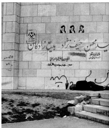
Slika 6. Fotografija uličnih grafita u Iranu

Uporište kojem bi se moglo pribjeći, i u ovom slučaju vrlo je nestabilno. Pomoć je ponovo moguće potražiti u medijskom diskursu. Jesu li ovi natpisi aluzija na revolucionarne grafite, ispisivane na fasadama iranskih gradova? Ukoliko jesu, onda je njihov sadržaj lako moguće sagledati kao refleksiju antizapadnih (prijetećih) parola, kojima je ostvarivanje društvenih promjena u Iranu bilo praćeno. No uspostavlja li sadržaj ovih tekstova ponovno značenja na kojima je Revolucija bila provođena, ili im se suprotstavlja? Je li u ispisanim redovima moguće pronaći pozive ekstremista na džihad, ili se pak, slijedeći dekonstrukciju diskursa orijentalizma, u njihovom pojavljivanju na fotografijama, može prepoznati postupak konstruiranja slike o prijetećem Drugom ? Možda je to neizgovoreno svjedočanstvo, vapaj ili ispovijest, žene osuđene na šutnju u društvu koje legalizira njen podređen položaj, ispisan u maniri tradicionalnog ukrašavanja kanom?