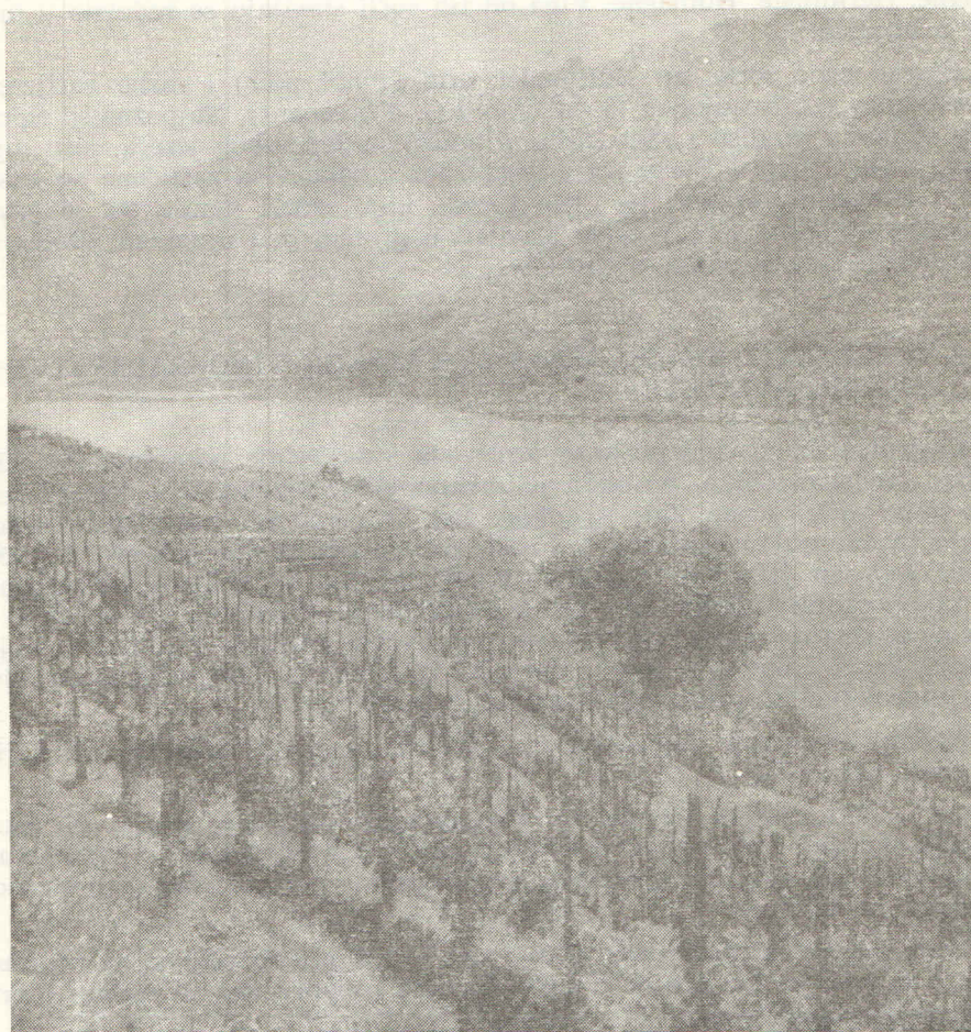
Slika 2 — Suvremeni nasadi i konturna sadnja

Prosječni prinosi pokazuju jasno razlike uvjeta uzgoja vinove loze u pojedinim dijelovima zemlje. Dok je klima u zapadnoj švicarskoj uglavnom izjednačena, a smrzavice se pojavljuju rjeđe, u južnom području uzrokuje tuča svake godine velike štete. U istočnom području pojavljuju se često štete od zime, koje, uz spekulacije s građevinskim zemljištem, utječu vrlo loše na gospodarsko stanje vinogradara, a glavni su uzroci jakog, ali nejednoličnog nazadovanja areala vinograda.