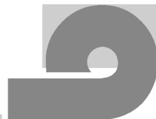
Tablica 2: Primjer poučavanja po modelu prefiks po prefiks (Udier i Gulešić Machata 2014)