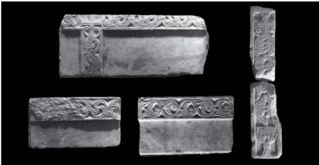
10. Pluteji i pilastar pronađeni u katedrali Sv. Tripuna, Kotor, depo katedrale Plutei and a pilaster from the cathedral of St Tryphon, cathedral depot, Kotor

Zadržavajući se na materijalu pronađenom u katedrali Sv. Tripuna, takvim su motivima ukrašeni reljefno istaknuti vijenci velikih mramornih pluteja s neuobičajeno praznim središnjim ploham (sl. 10). 33 Sudeći po njihovoj izrazitoj monumentalnosti i pozamašnim dimenzijama, bez sumnje pripadali su opremi tadašnje katedrale. Na dva primjera nailazimo na isti tip trolista s voluticom – jedanput na dvoprutoj, drugi put na troprutoj stabljici, dok na trećem pluteju nešto manji trolist s dva listnata izdanka formira virovitu rozetu. Srodan im je i pilastar na kojem vitica, ovdje u varijanti s dva niza nasuprotno postavljenih zaobljenih listića u svakom krugu, izrasta iz kaleža te završava križem s dvije volutice, baš kao i na najvećem od pluteja. 34 Spomenuti biljni motiv nije nepoznat na ranoj predromaničkoj skulpturi jadranskog bazena, od Grada pa sve do Kotora, uključujući i drvene grede zadarskog Sv. Donata. 35 Srodnu pak kompoziciju s križem pokazuju i neki od već spomenutih ulomaka iz Sv. Marije, s već opisanim varijantama biljnih vitica. Na jednome od njih javlja se i simboličan prikaz maloga kaleža pod križem (sl. 7).