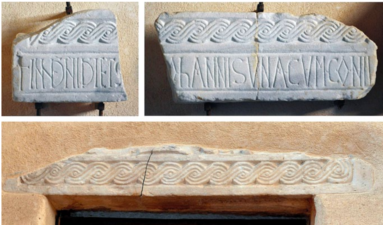
4. Ulomci arhitrava sa spomenom Ivana te spolirani nadvratnik iznad vrata sakristije, Kotor, Sv. Marija Collegiata

sigurnošću utvrditi, valja konstatirati da se ime, ovaj put navedeno u nominativu zajedno sa suprugom – dakle u svojstvu donatora oltarne ograde ili određenih radova na crkvi, ovdje javlja u punom obliku, i to kao Iohannis umjesto Iohannes , što svjedoči o određenom stupnju vulgarnog latiniteta prisutnog u Dalmaciji još od kasne antike. 19 Isti oblik imena javlja se i na sarkofagu Ivana Ravenjanina, pripisanom upravo onom splitskom biskupu koji je sa svojim kotorskim imenjacom 787. boravio u Niceji. 20 Sva navedena zapažanja upućuju na zaključak