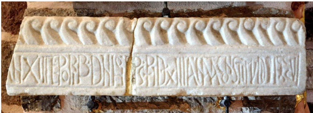
1. Arhitrav sa spomenom biskupa Ivana, Kotor, svetište katedrale Sv. Tripuna Architrave mentioning Bishop Ivan, cathedral of St Tryphon in Kotor

kojoj je već 788. godine uspostavljena franačka vlast, u svim ostalim slučajevima radi se o gradovima koji su, kao i Kotor, bili dijelom bizantske Dalmacije.