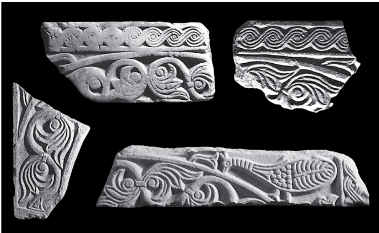
8. Ulomci arkada četverostranog ciborija, Kotor, depo katedrale Sv. Tripuna Fragments of arcades at the four-sided ciborium, cathedral depot, Kotor

sinusoidne vitice s krupnim trolisnim cvjetovima. Voluminozno i zaobljeno modelirana stabljika, bez uobičajene troprute podjele, podsjeća na langobardske reljefe 8. stoljeća ukazujući na početnu fazu u razvoju predro-