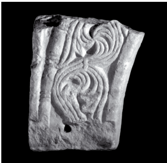
6. Lijeva peta pročelne arkade ciborija, Kotor, sakristija Sv. Marije Collegiate

Left heel of the front arcade of the ciborium, sacristy of St Mary Collegiate in Kotor