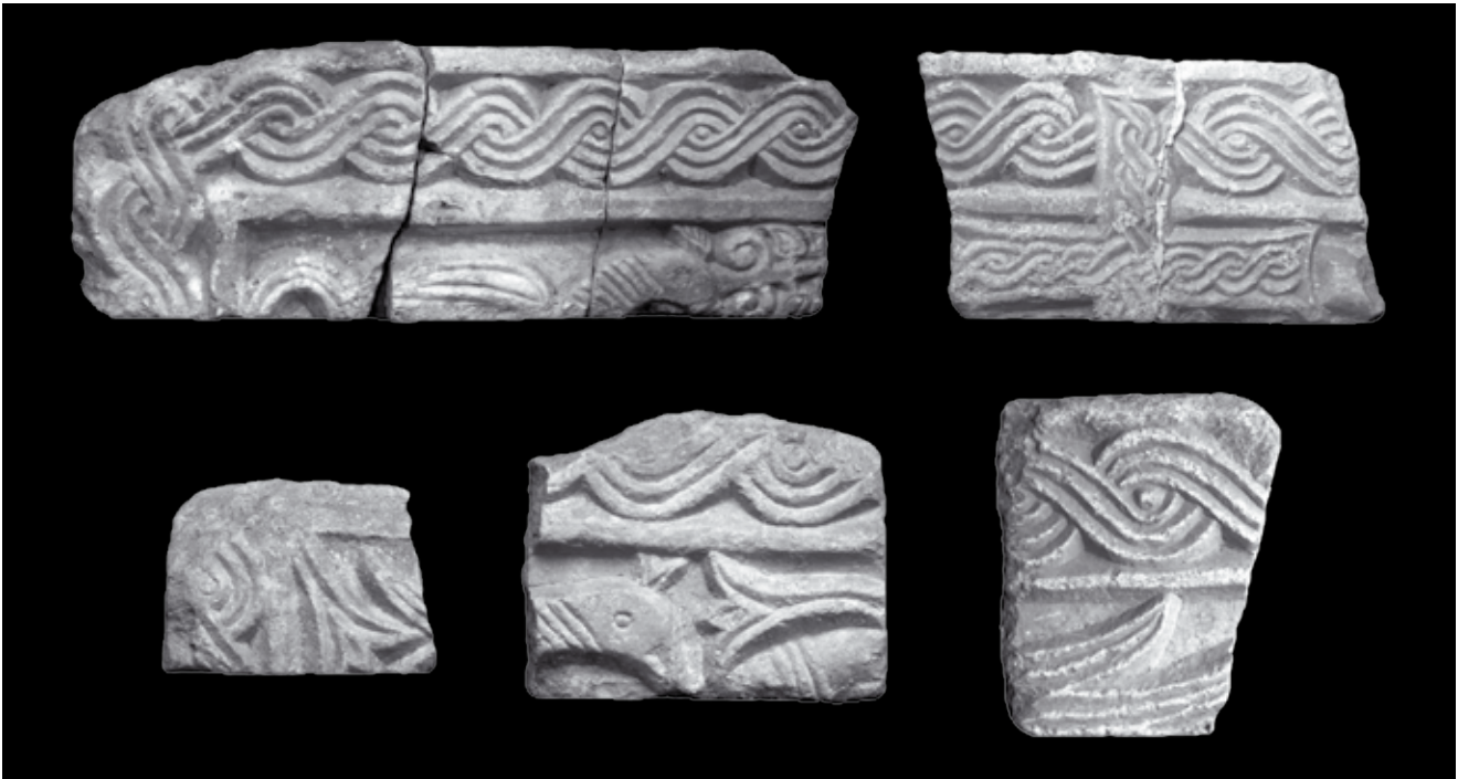
5. Ulomci arkada četverostranog ciborija iz Sv. Marije Collegiate, Kotor, Lapidarij Sv. Mihajla i depo katedrale Sv. Tripuna Fragments of arcades at the four-sided ciborium from St Mary Collegiate in Kotor, lapidarium of St Michael's church and the cathedral depot

da je dotični arhitrav istovremen prethodnim natpisima sa spomenom biskupa Ivana, a time posredno i na realnu mogućnost da se radi o istoj osobi.