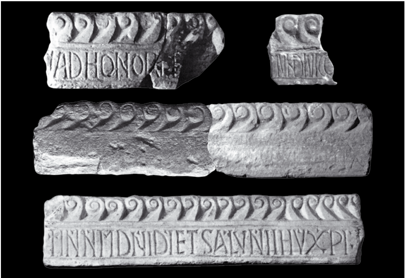
2. Srodni ulomci arhitrava iz katedrale, Kotor, depo katedrale Sv. Tripuna (gore i sredina lijevo, izvor: Z. ČUBROVIĆ /bilj. 13/, 30, sl. 9 i 10; gore i sredina desno, foto: M. Zornija). Dolje: vijenac ciborija s fasade Sv. Mihovila u Kotoru, Lapidarij Sv. Mihajla (foto: S. Kordić)

Analogous architrave fragments from the Kotor cathedral of St Tryphon, cathedral depot. Below: Ciborium cornice from the façade of St Michael's church in Kotor, lapidarium of St Michael's church