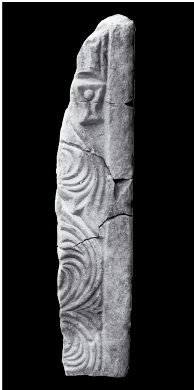
7. Ulomci pilastra s križem iz Sv. Marije Collegiate, Kotor, Lapidarij Sv. Mihajla

Analizom ovog sloja skulpture iz Sv. Marije Collegiate može se donijeti zaključak da je ranokršćanska crkva u sklopu svoje predromaničke obnove, potvrđene i ostacima arhitekture, dobila nove mramorne instalacije sastavljene od ciborija i oltarne ograde visokog tipa s arhitravom. Upravo na temelju jednog njegovog ulomka s natpisom dobili smo čvrsti kronološki okvir za datiranje rečene obnove u doba kada je na čelu kotorske crkve stajao biskup Ivan.