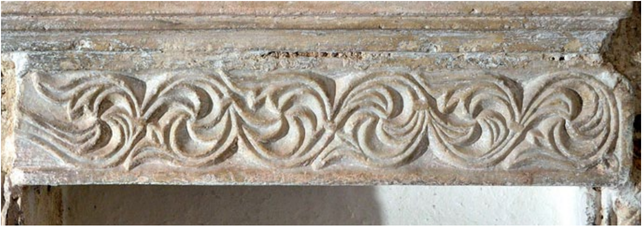
12. Pilastar uzidan u konstrukciju umivaonika, Školj, samostan Gospe od Milosti Pilaster built into the basin construction, monastery of Our Lady of Mercy

neki odaju istu klesarsku maniru, kao što je primjerice peta još jedne arkade ciborija. Na jednom pilastru impresivnih dimenzija, u prokoneškom mramoru isklesana je neobična vitica s izdancima izvedenima na dva različita načina, ali kvaliteta i način klesanja su isti (sl. 11). Majstor je ovdje, poigravajući se ishodišnim biljnim motivom, stvorio unikatni, gotovo apstraktni ornament, što svjedoči o njegovoj inventivnosti i visokoj klesarskoj umješnosti. Drugi mramorni pilastar (sl. 12) u potpunosti odgovara svom pandanu u kotorskoj katedrali, baš kao i treći iz zbirke manastira na Prevlaci, pronađen na obližnjem lokalitetu Račica u Tivtu (sl. 13). 37 Obrada motiva i duktus dlijeta u tolikoj su mjeri identični s vijencima pluteja iz katedrale da ukazuju na mogućnost kako ih je klesala ista ruka. Zbog podudarnosti u materijalu, klesarskoj izvedbi i posebice monumentalnosti navedenih ulomaka, može se zaključiti da su svi oni originalno pripadali najstarijoj opremi ranosrednjovjekovne gradske prvostolnice iz vremena biskupa Ivana, a njezinom su razgradnjom, prema ustaljenoj praksi, naknadno dospjeli u druge crkve na području biskupije.