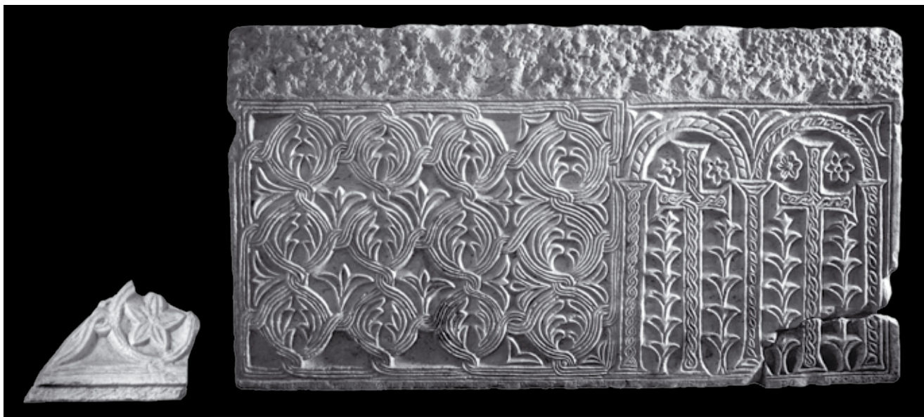
14. Fragment mramornog pluteja, Kotor, Lapidarij Sv. Mihajla; veliki plutej iz memorije Sv. Tripuna (?), Kotor, depo katedrale

Fragment of a marble pluteus, lapidarium of St Michael's church in Kotor; large pluteus from the shrine of St Tryphon (?), cathedral depot, Kotor