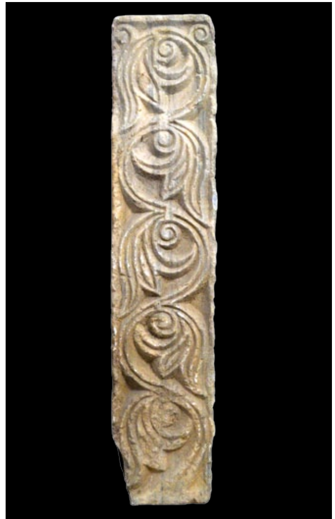
13. Pilastar s lokaliteta Račica kod Tivta, Prevlaka, manastirska zbirka Pilaster from the locality of Račica near Tivat, monastic collection in Prevlaka

Promotrimo sada treći motiv s najvećeg katedralnog pluteja. U ovoj varijanti vitica je tropruta te ima specifično oblikovanu stabljiku: na mjestima gdje iz nje izrasta trolist, proširuje se u obliku lijevka. Nalazimo ju na još jednom pluteju iste oltarne ograde, čija je stražnja strana otkrivena u posljednjim istraživanjima katedrale Sv. Tripuna. 38 S drugačije oblikovanim izdancima ponavlja se i na pilastru s križem i kaležom. Taj karakterističan detalj ljevkastih proširenja na stabljici preuzet će majstori Kotorske klesarske radionice 39 te će on postati jednim od njihovih najučestalijih motiva, potvrđujući neposredni kontinuitet lokalne klesarske