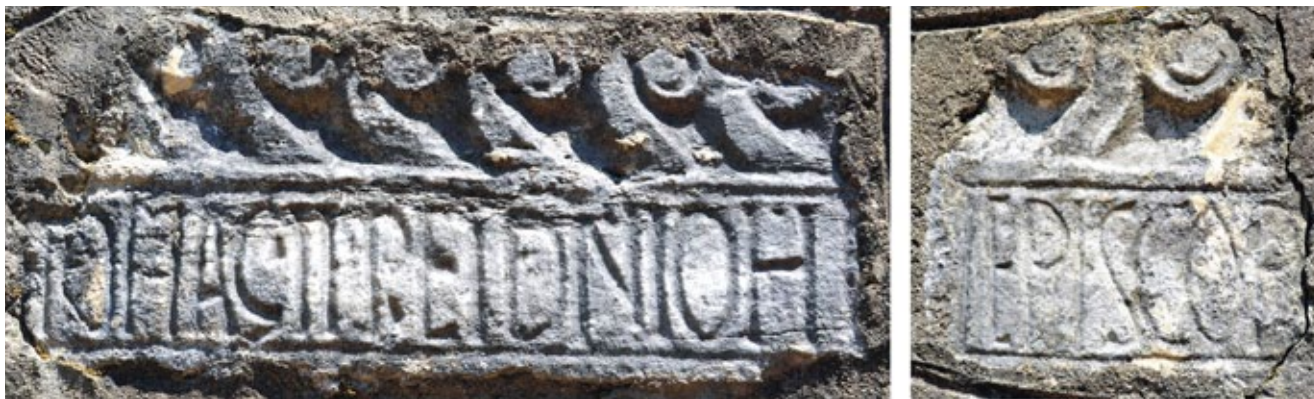
3. Ulomci arhitrava oltarne ograde, Bijela, pročelje crkvice Sv. Petra

Fragments of the architrave, altar railing, façade of St Peter's church in Bijela