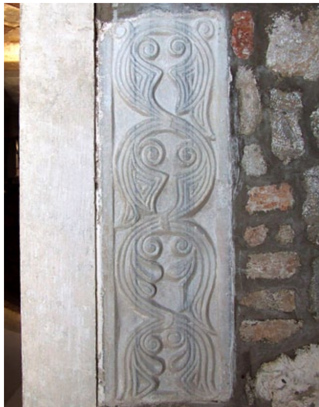
11. Pilastar od prokoneškog mramora, Školj, samostan Gospe od Milosti

Paralele za svaki od navedenih motiva s katedralnih pluteja mogu se pronaći na širem području Boke. Jedan je od lokaliteta i danas isusovački samostan na otočiću Gospe od Milosti u tivatskom arhipelagu, u narodu zvan jednostavno Školj. 36 U njegovim zidovima spolirano je 13 odlično sačuvanih komada predromaničkih liturgijskih instalacija nepoznatog porijekla, od kojih