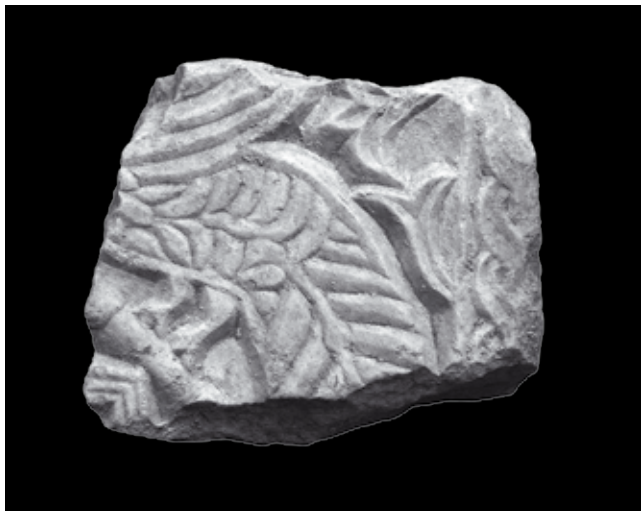
9. Ulomak arkade ciborija, Kotor, Lapidarij Sv. Mihajla Fragment of the ciborium arcade, lapidarium of St Michael's church in Kotor

sinusoidne vitice s krupnim trolisnim cvjetovima. Voluminozno i zaobljeno modelirana stabljika, bez uobičajene troprute podjele, podsjeća na langobardske reljefe 8. stoljeća ukazujući na početnu fazu u razvoju predro-