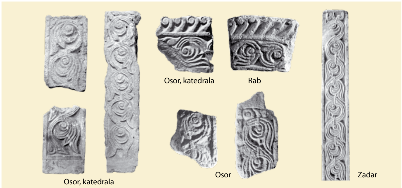
17. Reljefi s motivom sinusoidne trolisne vitice - analogije s bokokotorskim primjerima Reliefs with the motif of sinusoid triple foliage – analogies